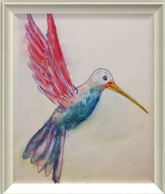
А. Александрова. Колибри. Бумага, акварель