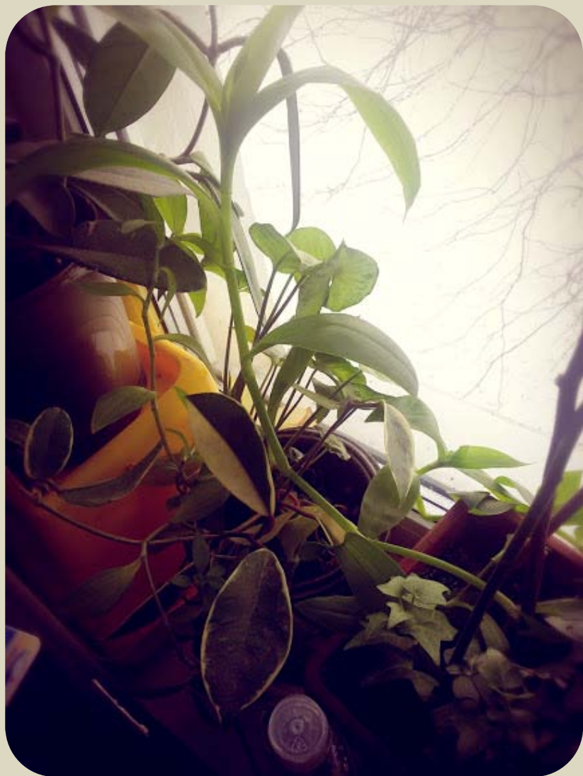
Цветы на подоконнике