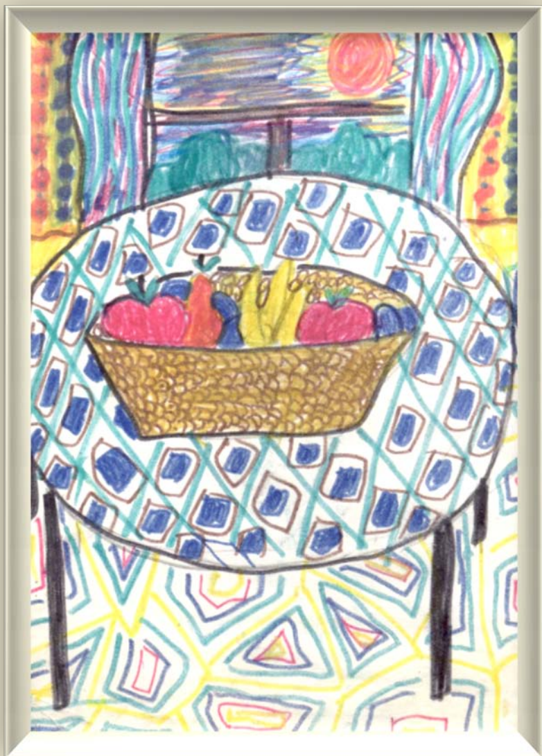
А. Александрова. Комната. Бумага, карандаш. 1987