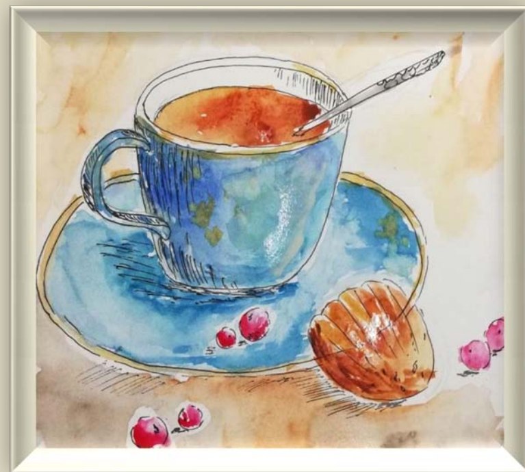
А. Александрова. Чаёк. Бумага, акварель