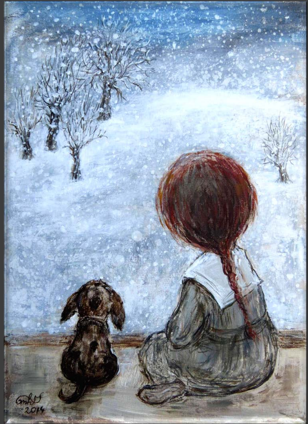
Н. Чакветадзе. Из серии «Сны о Грузии»

Знаешь, друг мой, одиночество, Дни проходят окаянные, Не толкуй своё пророчество, Мне известно толкование.