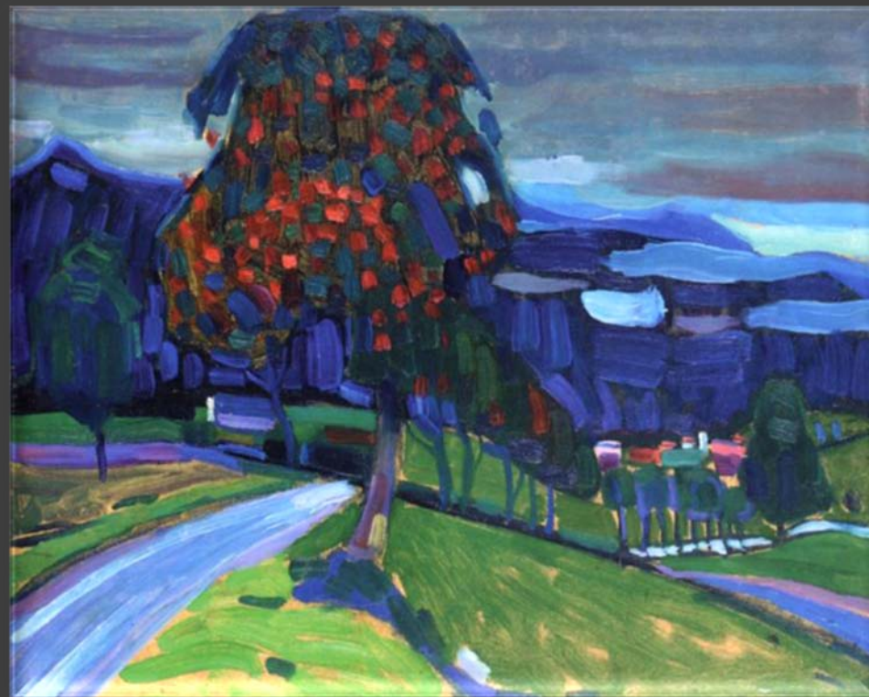
В. Кандинский . Осень в Мурнау