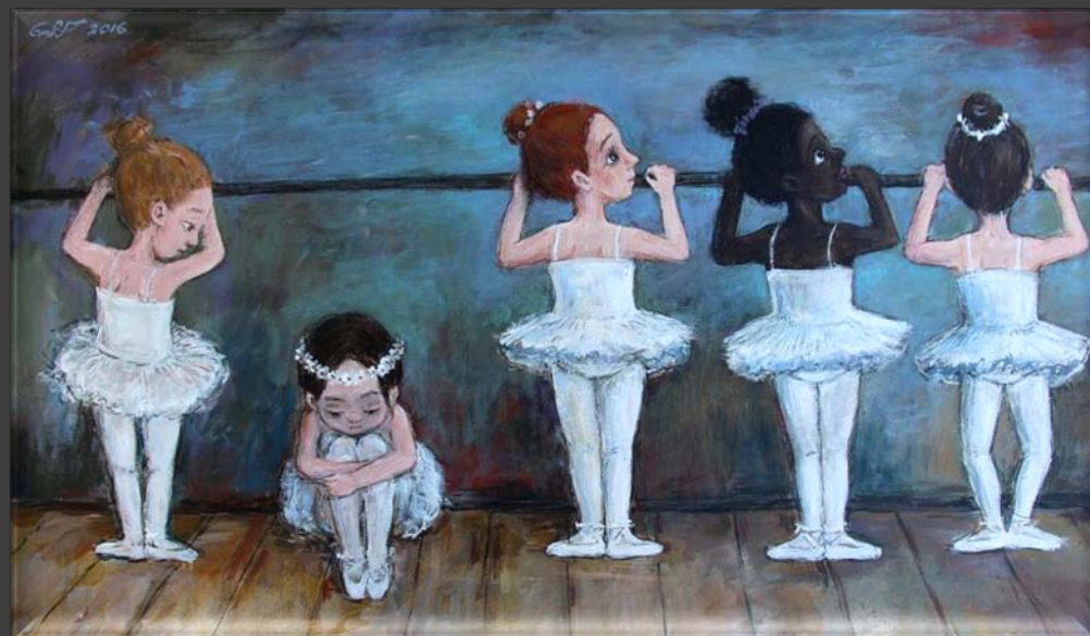
Н. Чакветадзе. Из серии «Сны о Грузии»

Хочется махнуть рукой На советы дам, И нарочно повод дать Вздорным языкам.