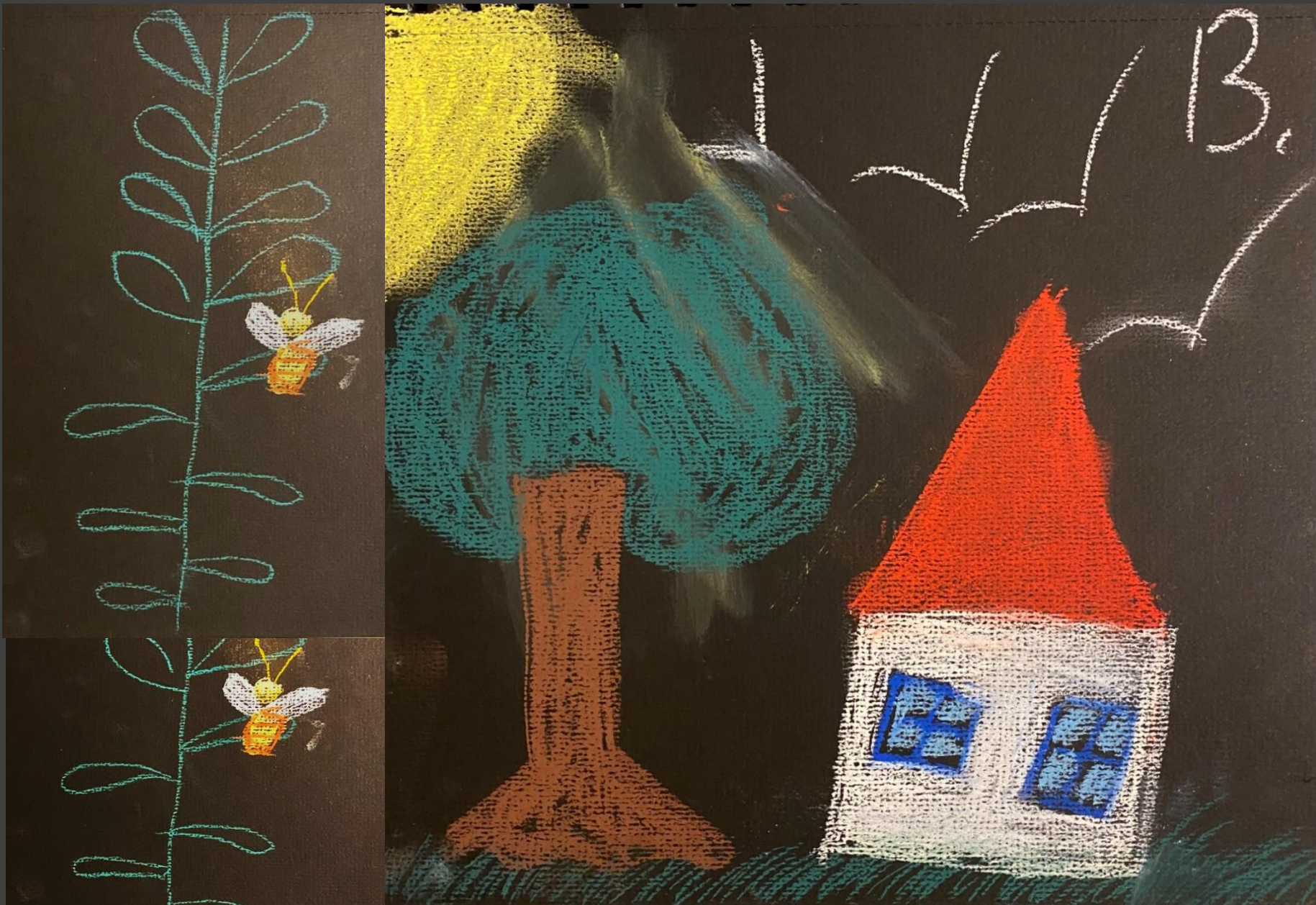
Дом наших соседей