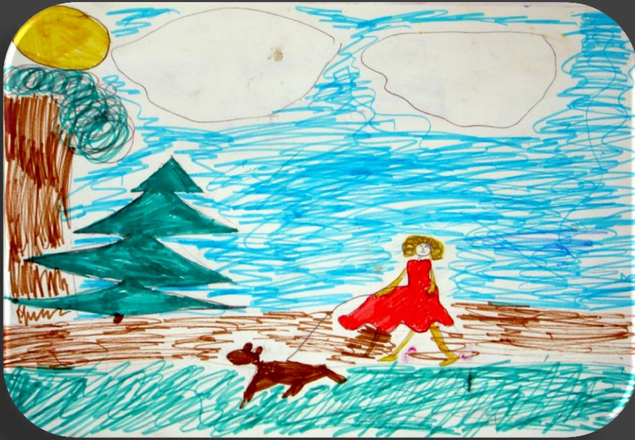
По дороге к роще: Аня и Шарик