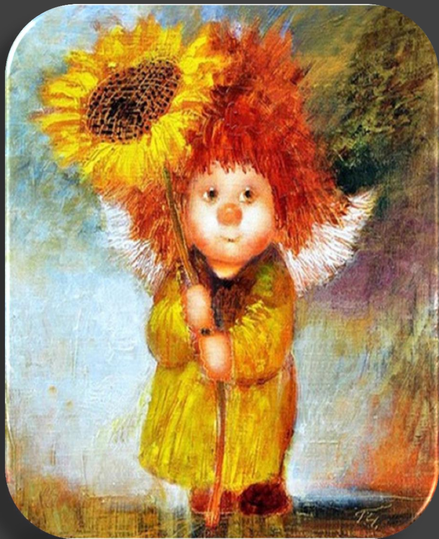
Ангел-Хранитель с подсолнухом

Тася вскочила с кровати и выбежала на улицу. Она опять посмотрела вверх: мячик висел совсем близко. Нужно было только влезть на елку, протянуть руку и достать его. Залезать на елку было трудно и долго. Тася вздыхала и зевала – ей опять захотелось спать, но она все-таки добралась до верхушки дерева. Тася взобралась на самую длинную веточку, протянула руку ... не удержалась и полетела с дерева вниз. Но на лету она успела заснуть.