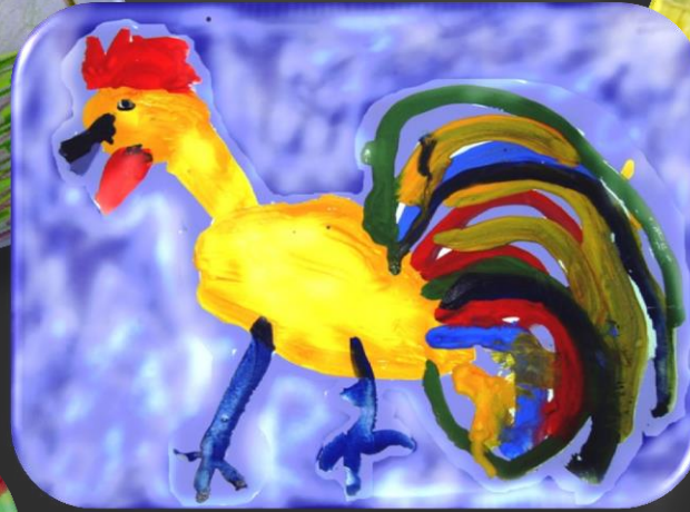
Петушок- золотой гребешок