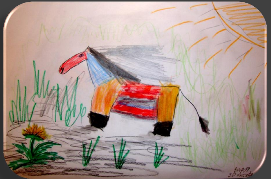
Джимик ест траву