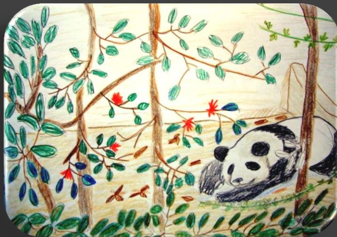
Спит медвежонок Панда