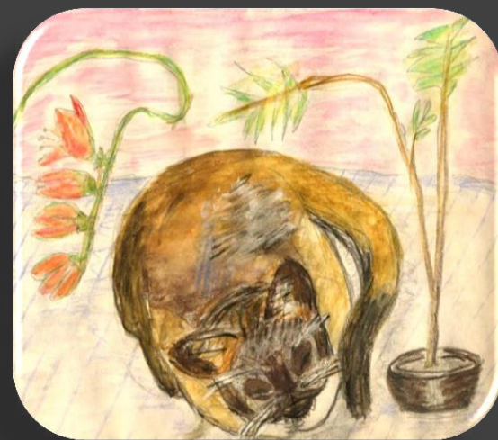
Спит котенок Гав