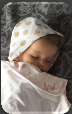
Спит принцесса Тася

Наступил вечер. Друзья так устали за этот день, полный игр и приключений, что после сытного ужина все пошли отдыхать: спит принцесса Тася, спят Белка и Стрелка, кот Кузя и котенок по имени Гав, кузнечик Гриня и медвежонок Панда, курочка Ряба и петушок.