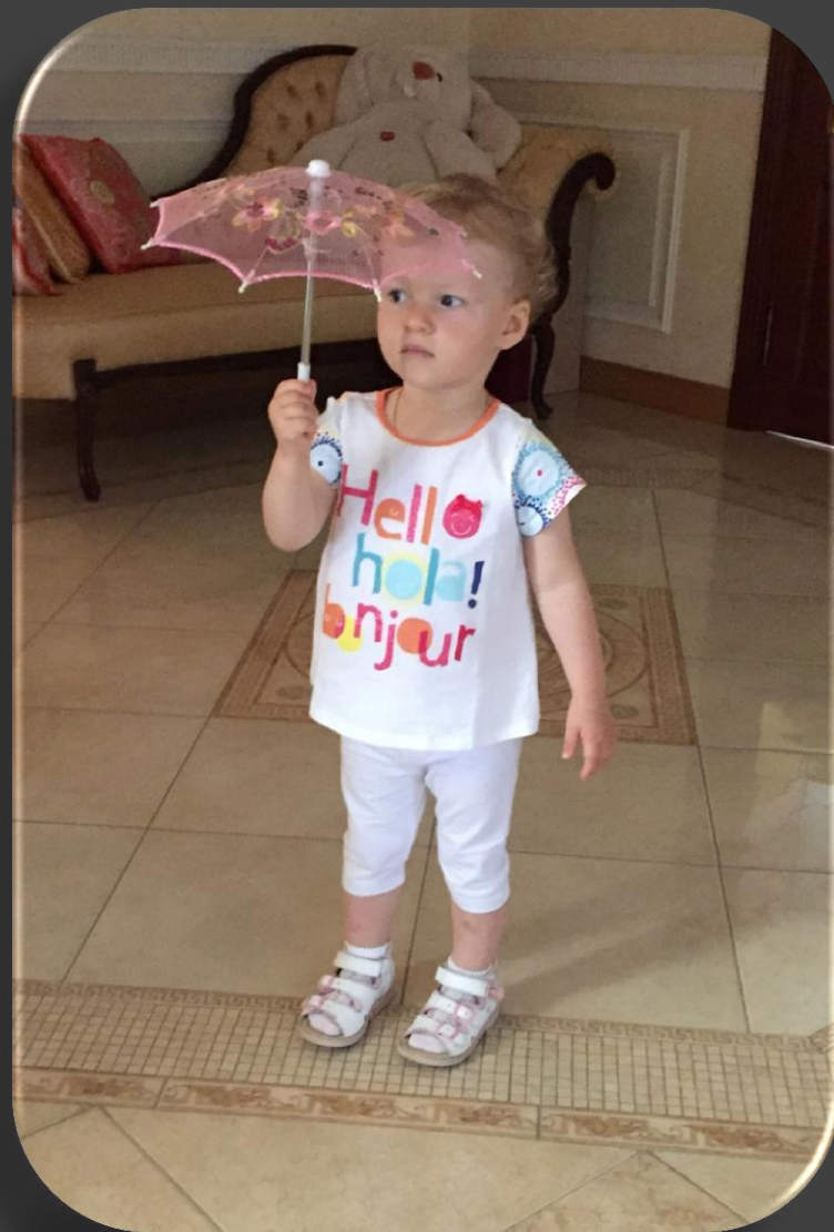
Принцесса Тася с волшебным зонтиком

Дежурными по кухне сегодня были Белка и Стрелка. Они приготовили для всей компании не только вкусный яблочный пирог, но и интересный рассказ про свое недавнее космическое путешествие, про разные планеты и инопланетян. Рассказ был таким увлекательным, что на минуту всем показалось как они сами летят в космическом корабле над планетой Земля!