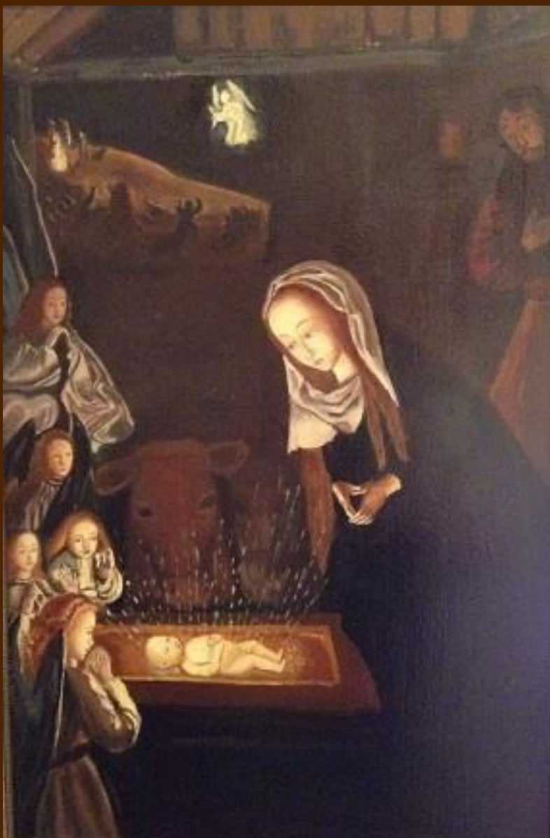
Рождество в ночи (по мотивам картины Гертгена тот Синт Янса) Холст, масло, темпера, 40х60 см