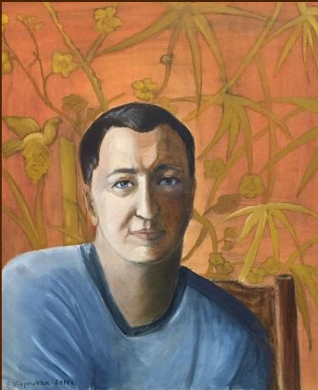
Портрет молодого мужчины Холст, масло, 60х70 см

Владей собой среди толпы смятенной, Тебя клянущей за смятенье вех, Верь сам в себя, наперекор вселенной, И маловерным отпусти их грех; Пусть час не пробил, жди, не уставая, Пусть лгут лжецы, не снисходи до них; Умей прощать и не кажись, прощая, Великодушней и мудрей других.