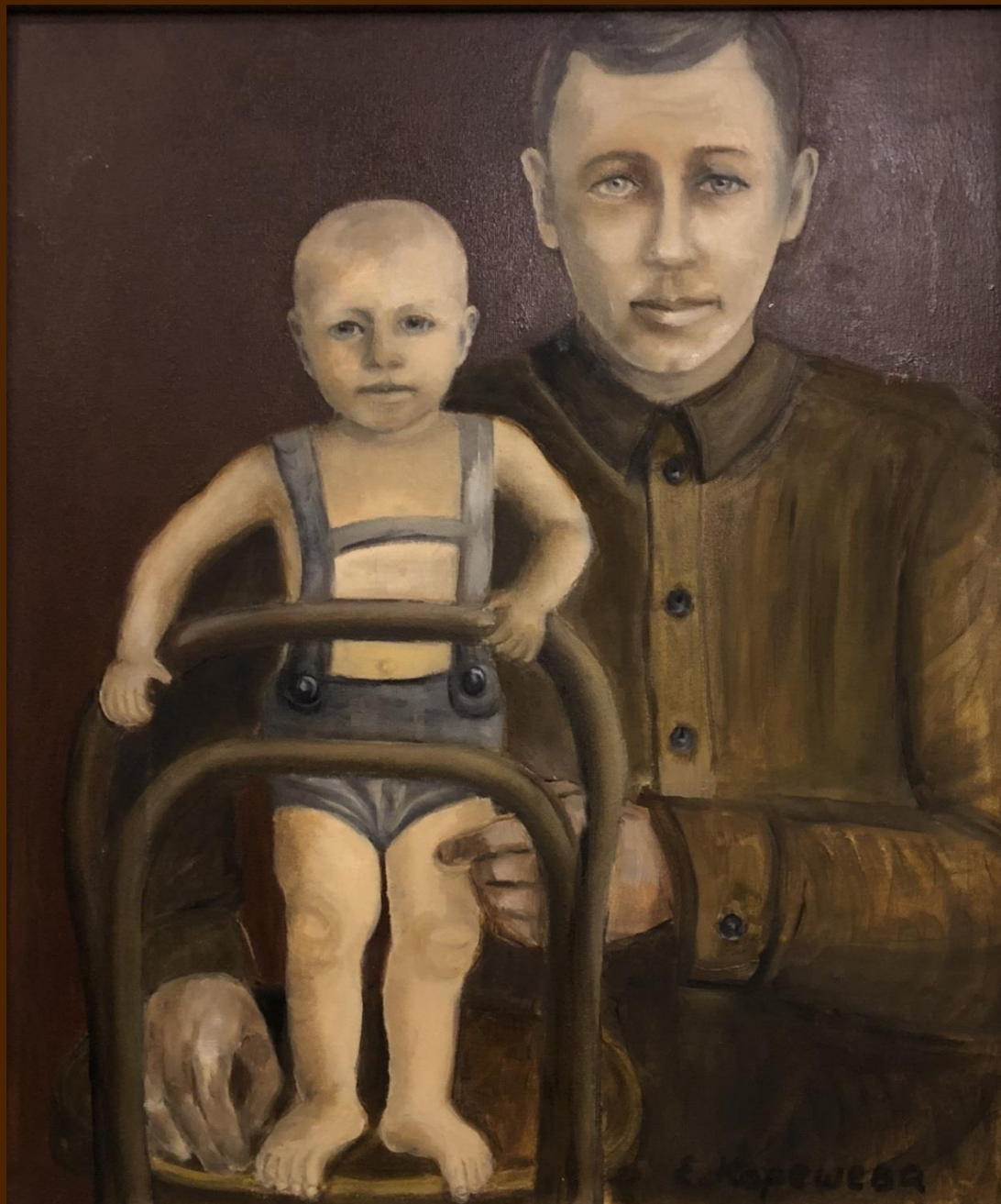
Отец и сын. 1933 год Холст, масло, 50 x 60 см

Хочу похожим быть на папу. Во всём хочу как папа стать. Как он — носить костюм и шляпу, Ходить, смотреть и даже спать. Быть сильным, умным, Не лениться И делать всё, как он — на пять! И не забыть еще, жениться! И нашу маму в жёны взять.