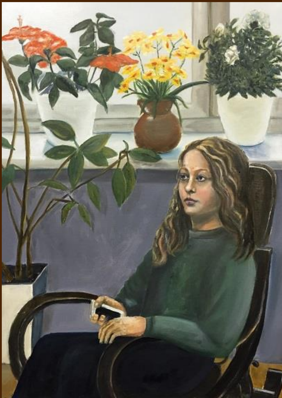
Размышления Холст, масло, 50x70 см

Как мало тех, с кем хочется мечтать! Смотреть, как облака роятся в небе, Писать слова любви на первом снеге, И думать лишь об этом человеке... И счастья большего не знать и не желать.