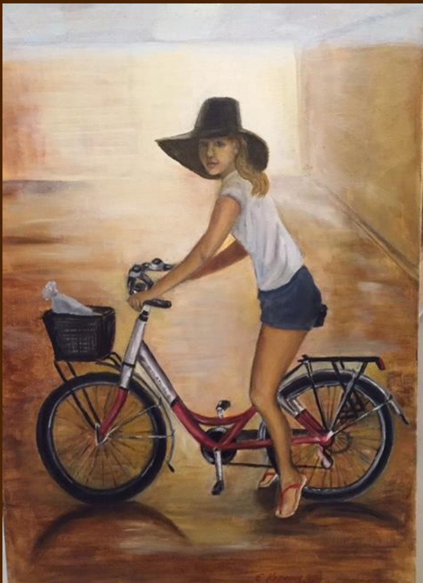
Велосипедистка Холст, масло, 60х60 см