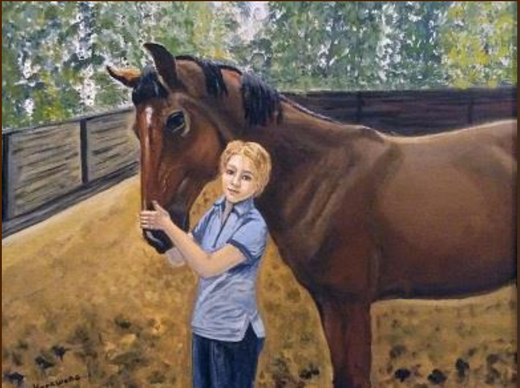
Друзья. Холст на картоне, темпера, 40x50 см. Картина находится в частной коллекции