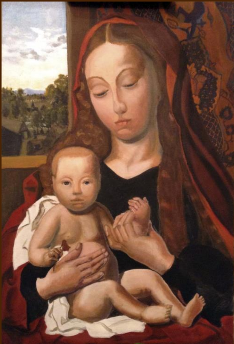
Мадонна с младенцем (по мотивам картины Гертгена тот Синт Янса) Холст, темпера, 40х60 см Картина находится в частной коллекции

Не множеством картин старинных мастеров Украсить я всегда желал свою обитель, Чтоб суеверно им дивился посетитель, Внимая важному сужденью знатоков. В простом углу моем, средь медленных трудов, Одной картины я желал быть вечно зритель, Одной: чтоб на меня с холста, как с облаков, Пречистая и наш Божественный Спаситель – Она с величием, он с разумом в очах – Взирали, кроткие, во славе и в лучах, Одни, без ангелов, под пальмою Сиона.