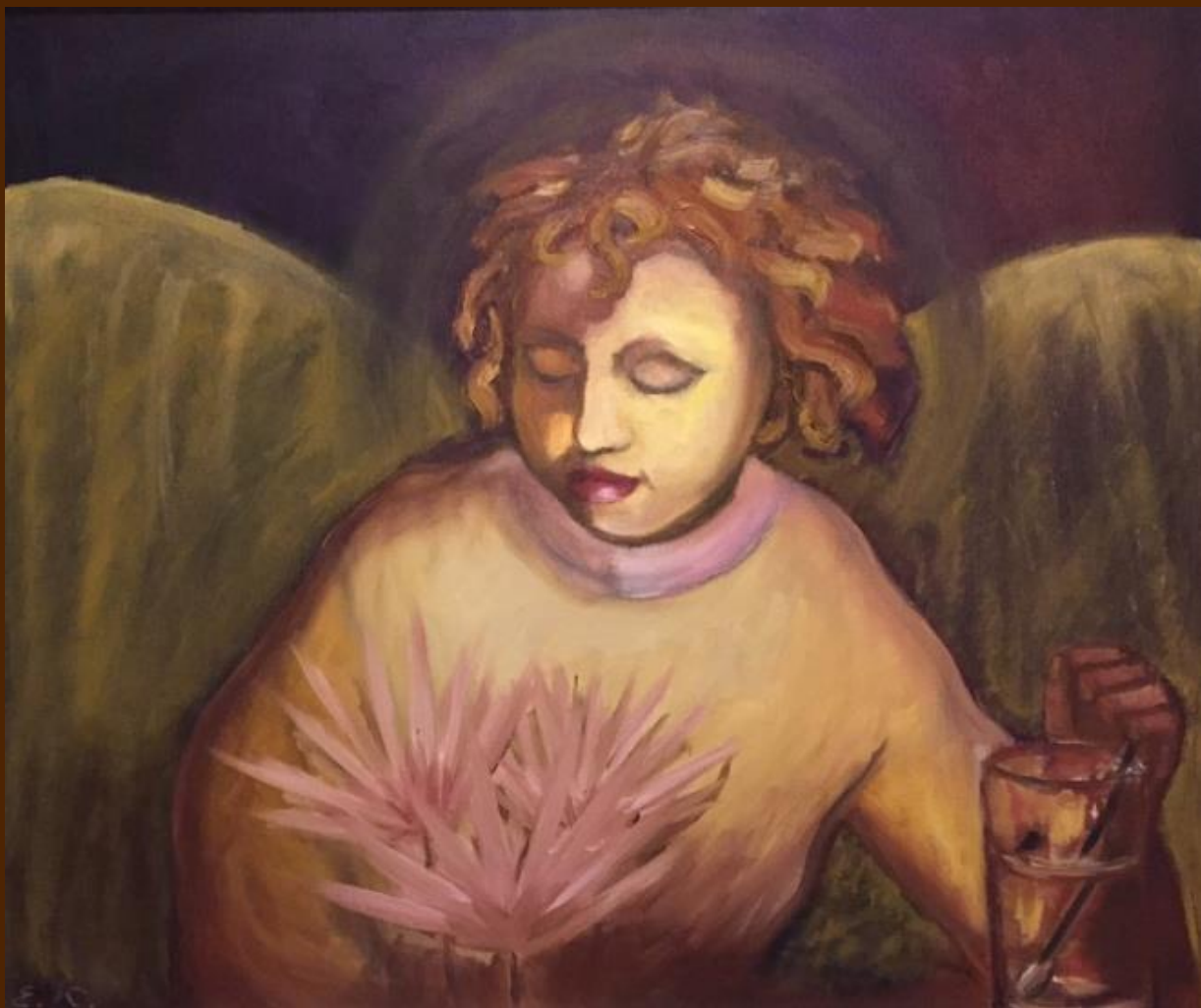
Ангел за чашечкой чая. Холст, масло, 50х60 см

Стаканчик чая, ложечка витая, Взгрустнувший Ангел за столом сидит.