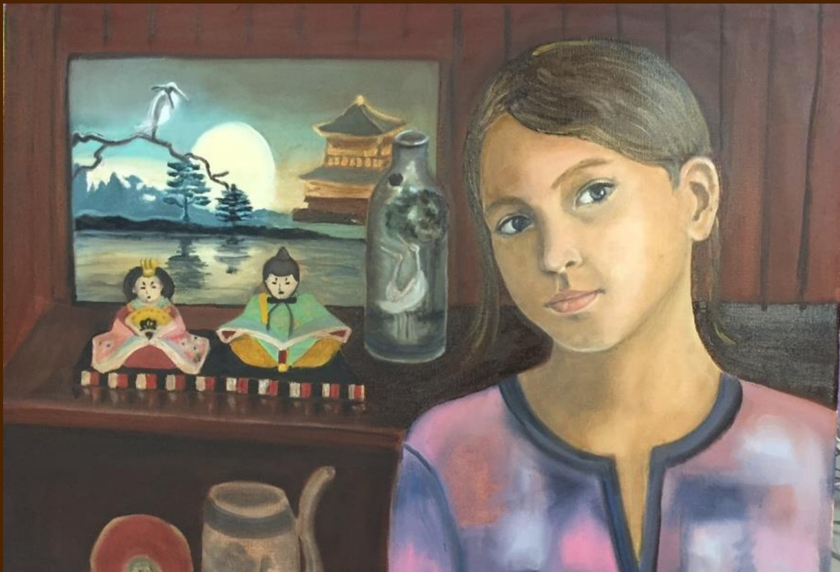
Сувениры из Японии Холст, масло, 60x70 см

Из далекой из Японии сувениры – кататори, Ваза из фарфора с цаплями в узоре... Это все, чтоб люди не были в раздоре, Это чтобы счастье посетило вскоре.