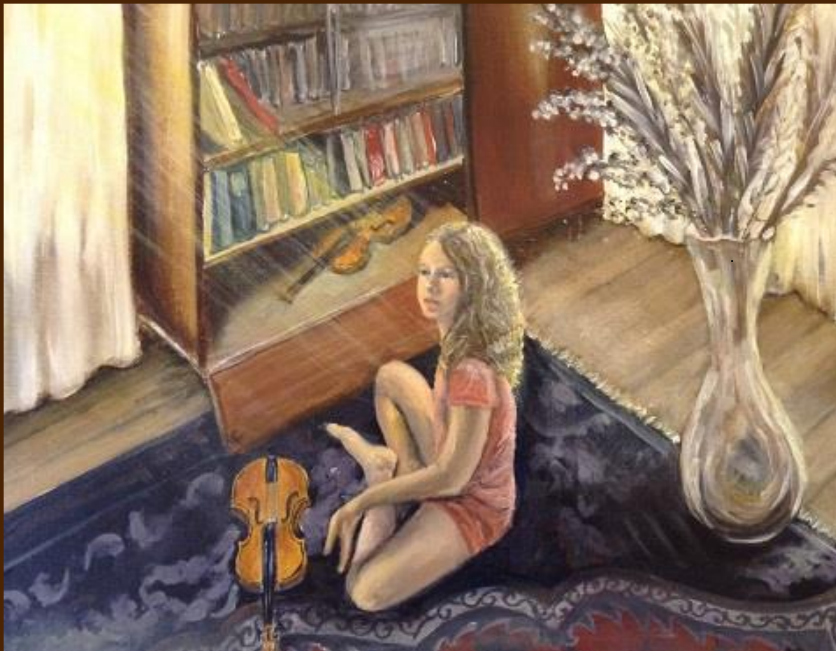
Мамина скрипка. Холст на картоне, масло, 40x60 см. Картина находится в частной коллекции