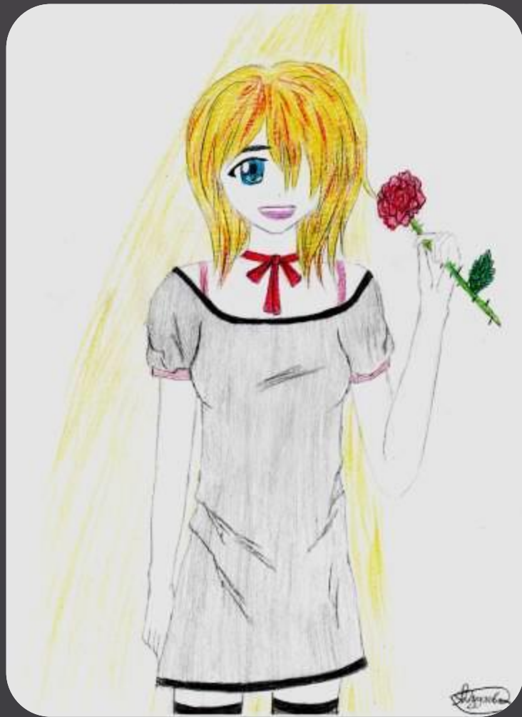
Рисунок Лизы Дудаевой 13 лет