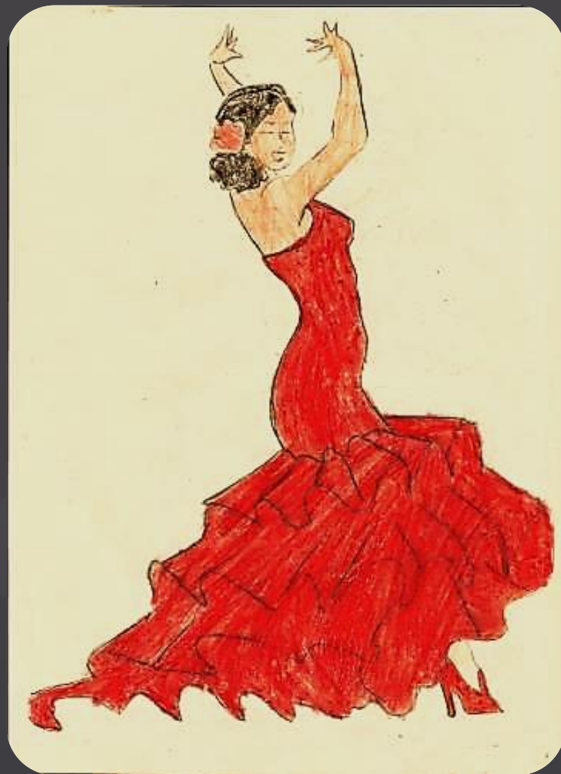
Рисунок Светы Макатуриной 10 лет