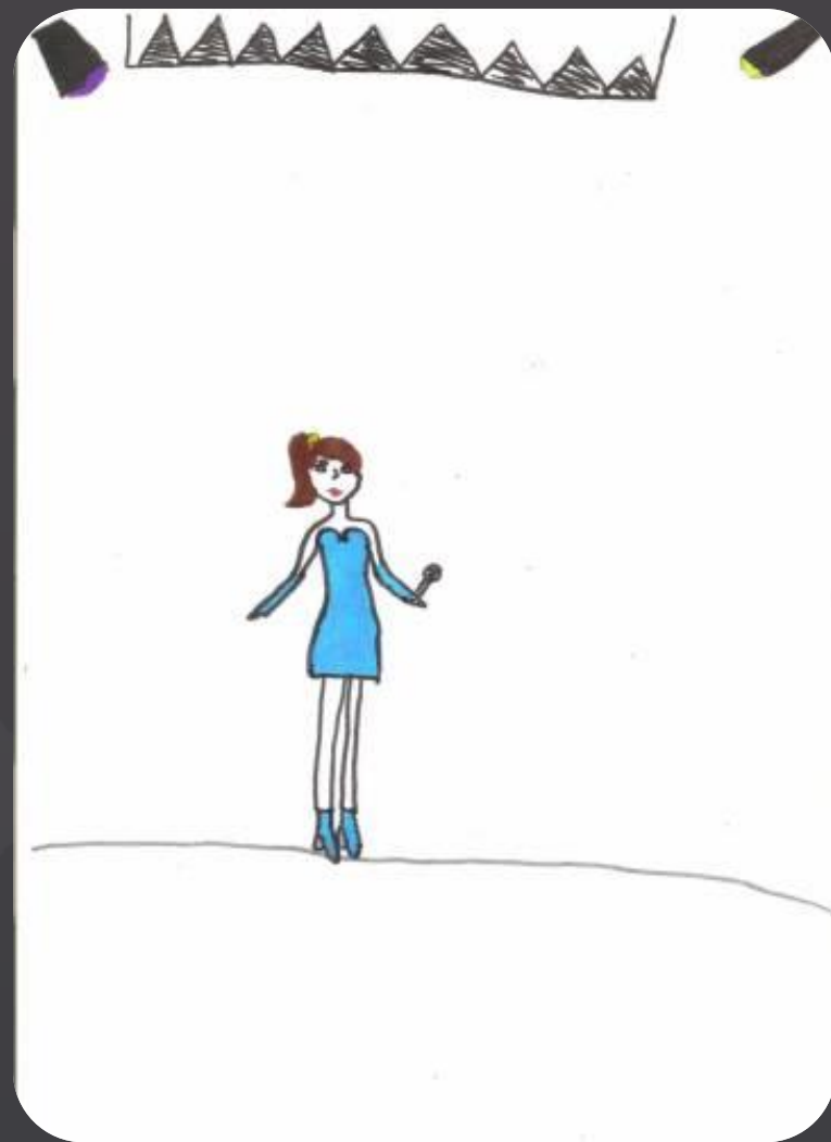
Рисунок Валерии Тарара, 8 лет

Все, дальше я слов не помнила. Ничего, мы умираем, но не сдаемся!