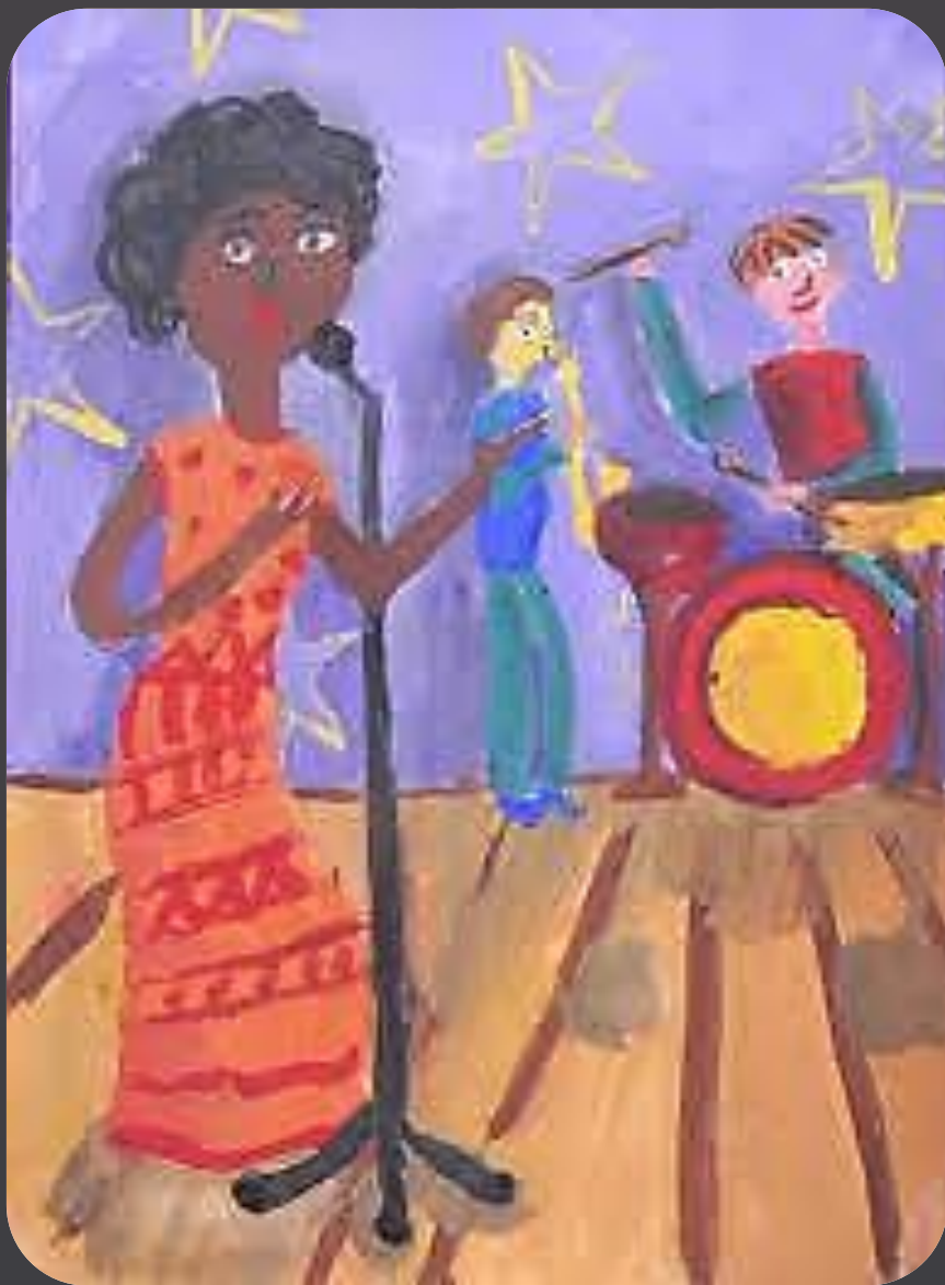
Рисунок Полины Вяткиной 10 лет

Я решила петь одним голосом, в стиле знаменитой джазовой певицы Махайи Джексон.