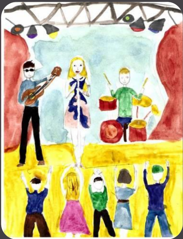
Рисунок Маши Рязановой 11 лет