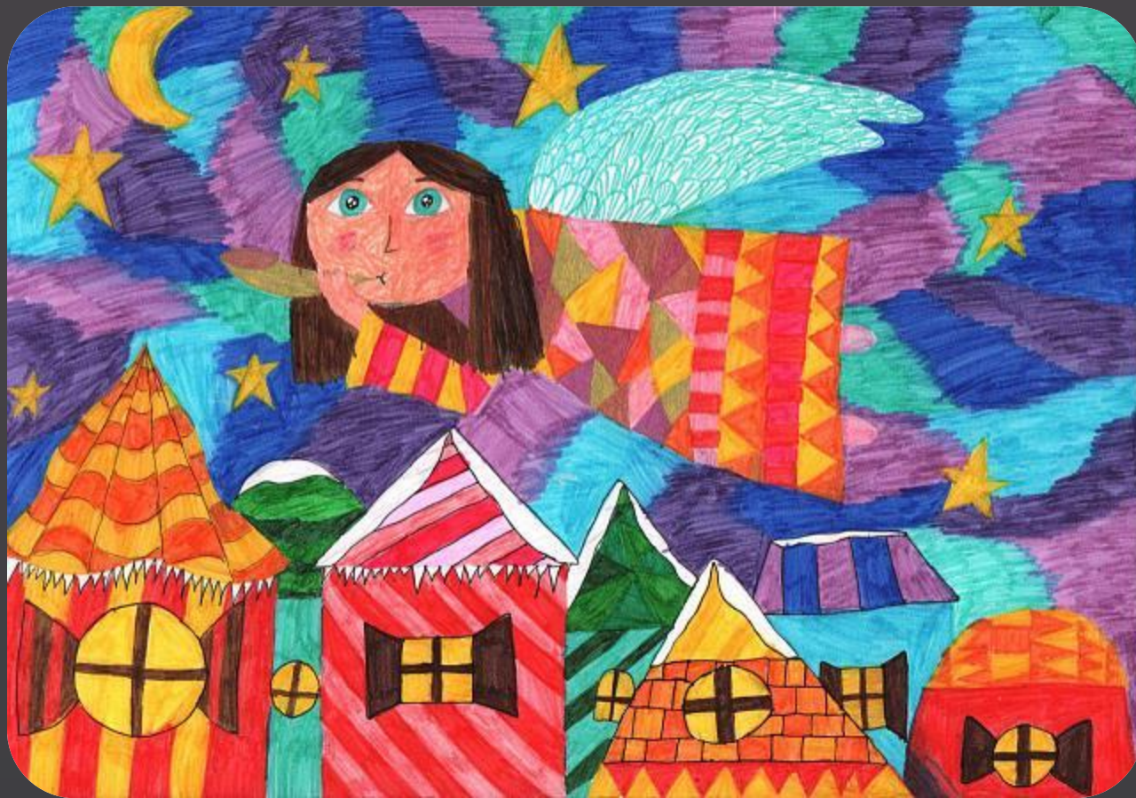
Рисунок Насти Скобельциной, 9 лет