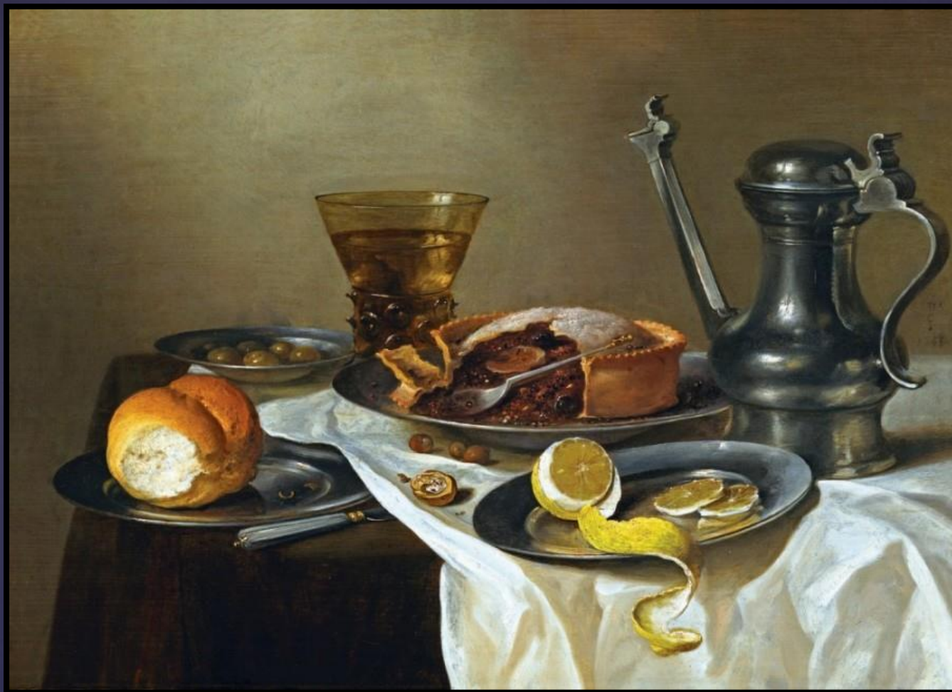
Виллем Клас Хеда Натюрморт с серебряным кофейником

Слава Богу, ни гости, ни Милочка ничего не заметили. Милочка просто упивалась успехом, которым пользовался набор «Квин» и, воодушевленная, продолжала ворковать про высокое качество товара фирмы Икс. Дама в костюмчике листала каталог, представитель фирмы «Автотур» заполнял бланк заказа на набор для виски.