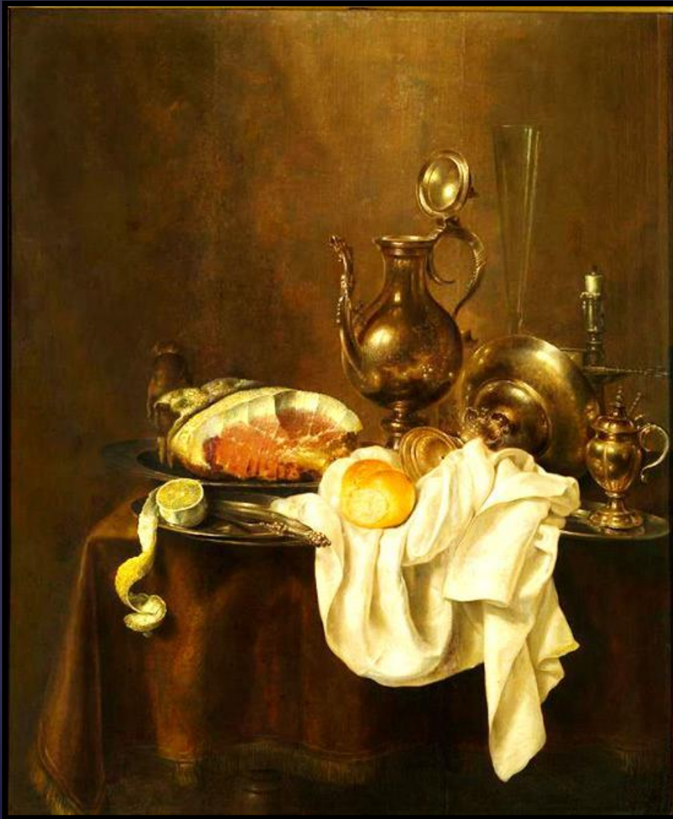
Геррит Виллемс Хеда Ветчина и серебряная посуда

Да-а, момент достаточно тонкий. Почему-то вспомнилось, что где тонко, там и рвется.