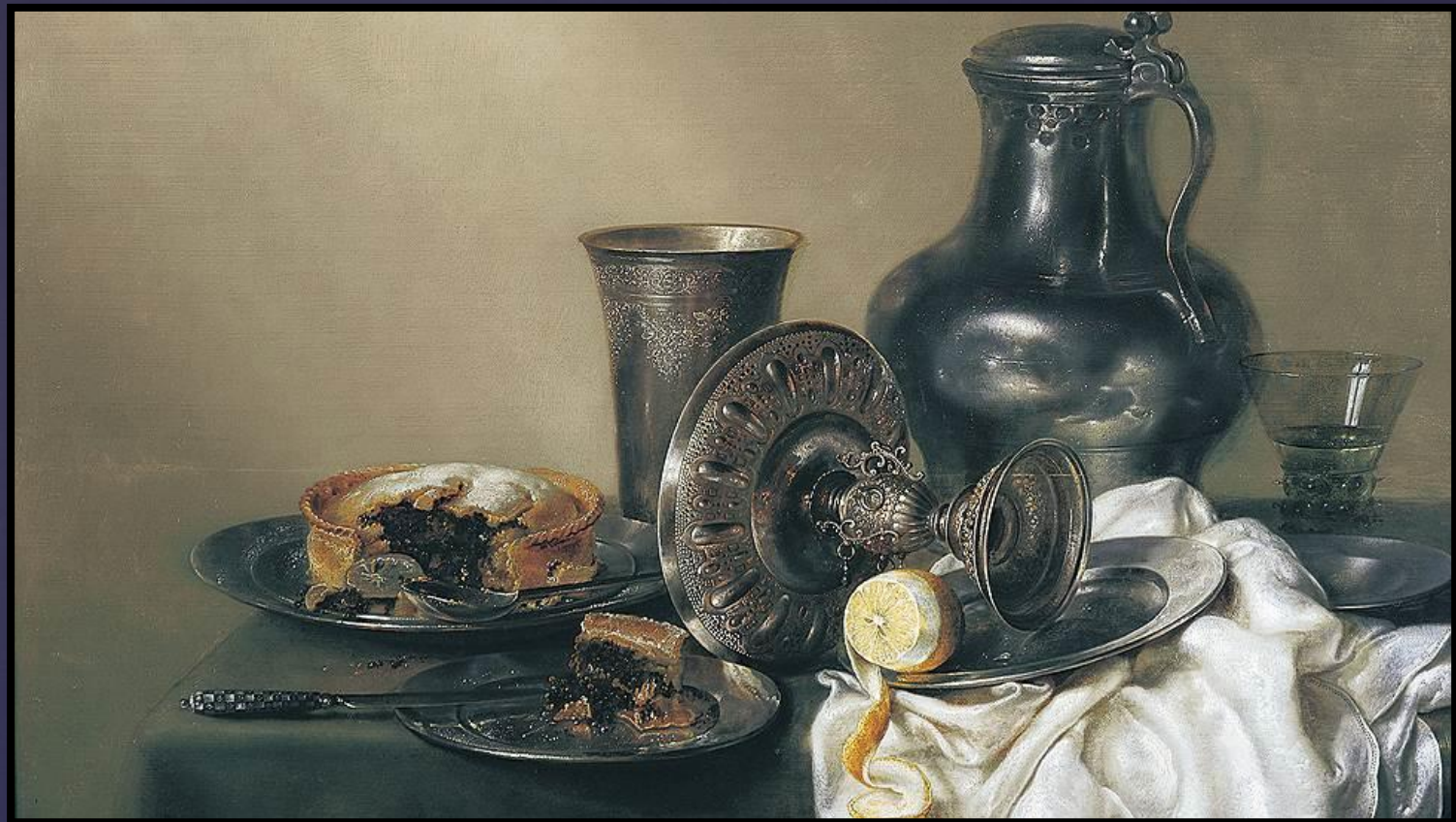
Виллем Клас Хеда. Триумф «мертвой природы»