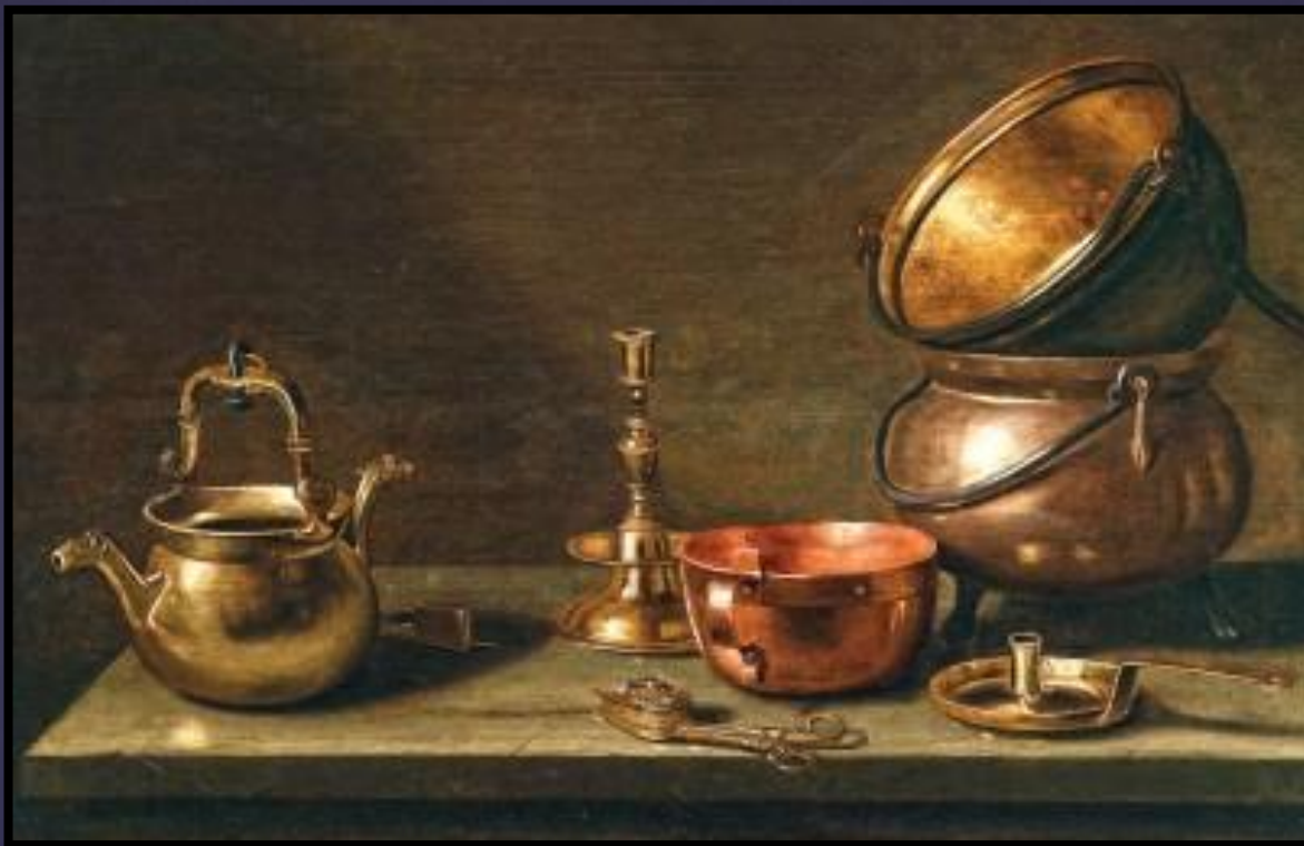
Схотен Флорис Медная посуда