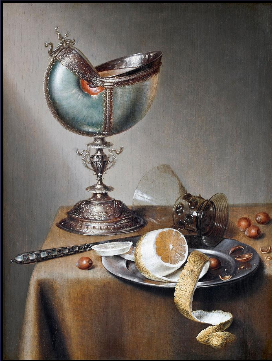
Мартин Буллема де Стомме Натюрморт с кубком-наутилусом

«...фирма Икс предлагает многофункциональную посуду из нержавеющей стали. Современный дизайн, культура питания 21-го века. Стоимость одного комплекта кухонной посуды около 850 долларов. Предлагается также кофейный сервиз, который обладает» ... и тра-та-та и тра-та-та тарактела Милочка в надежде сбавить хоть один набор кому-то из богачеев, приглашенных ко мне домой на презентацию посуды одной известной европейской фирмы.