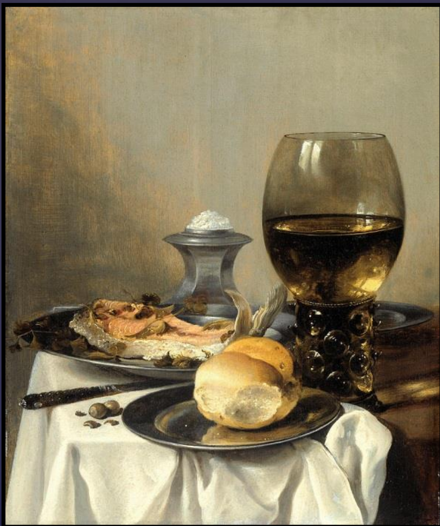
Питер Клас Натюрморт с солонкой

Казалось, дама и молодой человек первую наживку заглотнули. Я продолжала ковать пока не остыло: