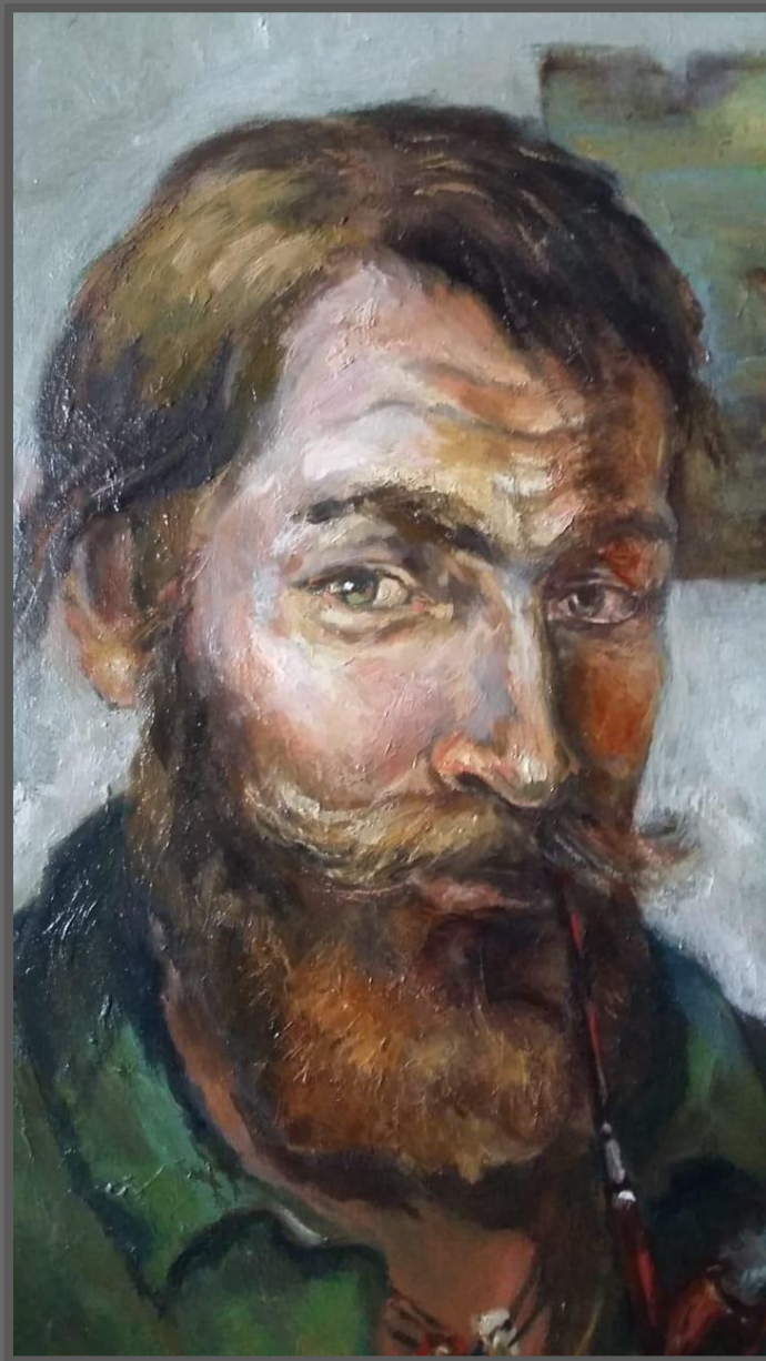
Капитан Юрий-волчонок (деталь). 2016 г. Холст, масло, 80x60 см