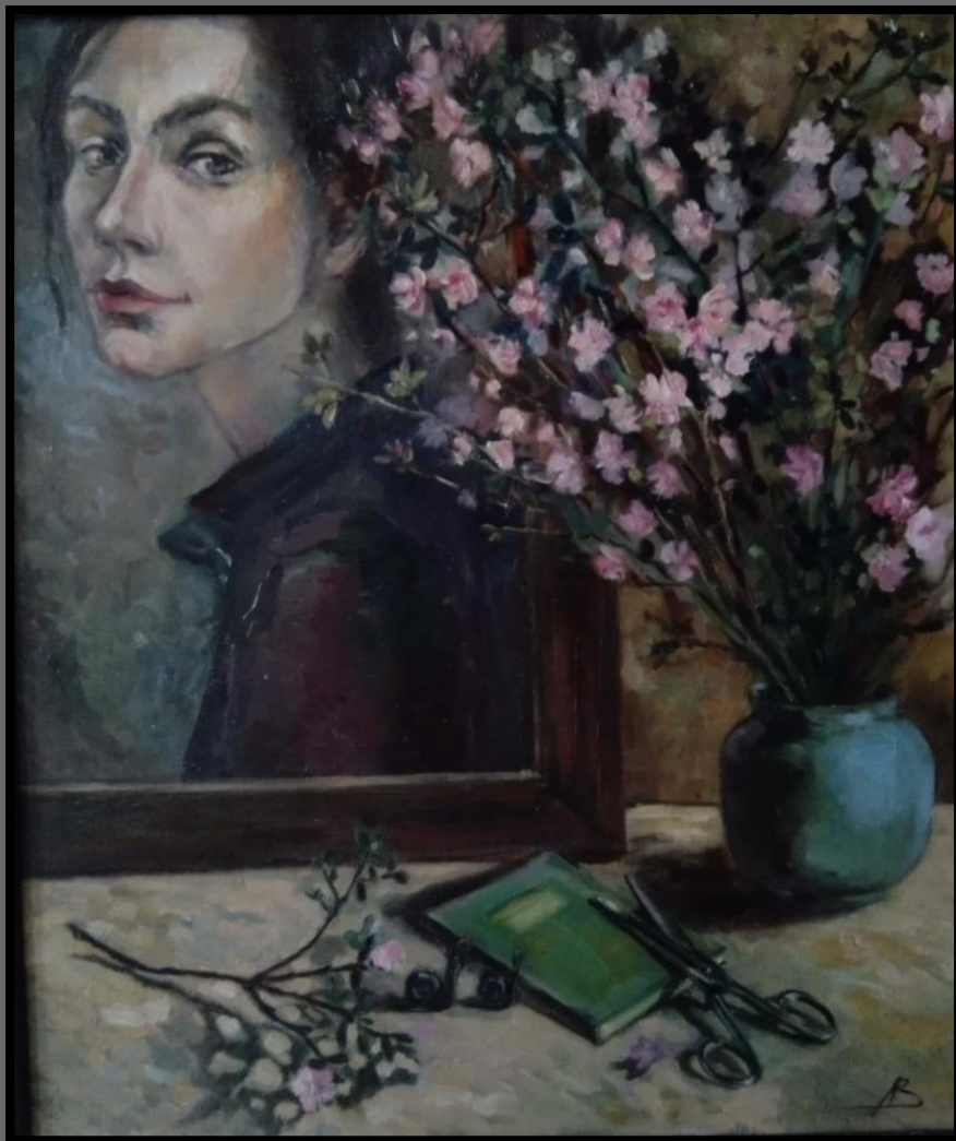
Автопортрет. 2015 г.