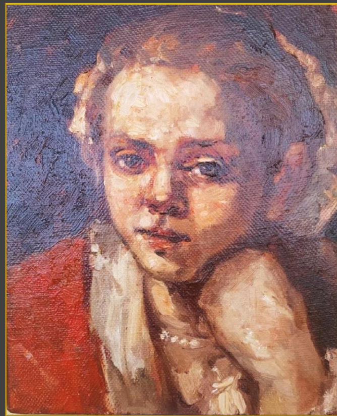
Молодая девушка в окне. 2022 г.