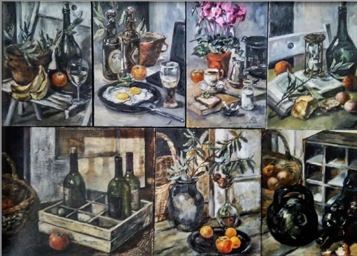
Инсталляция с композициями № 1-7, серия «Простые вещи». 2019 г.