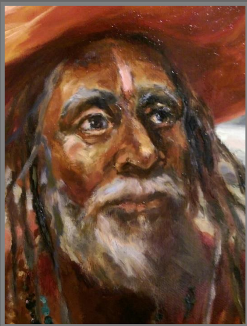
Странник. 2017 г. Холст, масло, 105 x 75 см