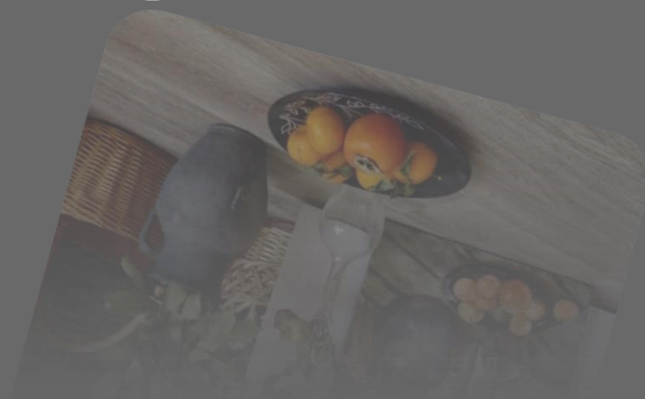
Композиция 1, серия «Простые вещи» 2019 г. Холст, масло, 50 x 40 см