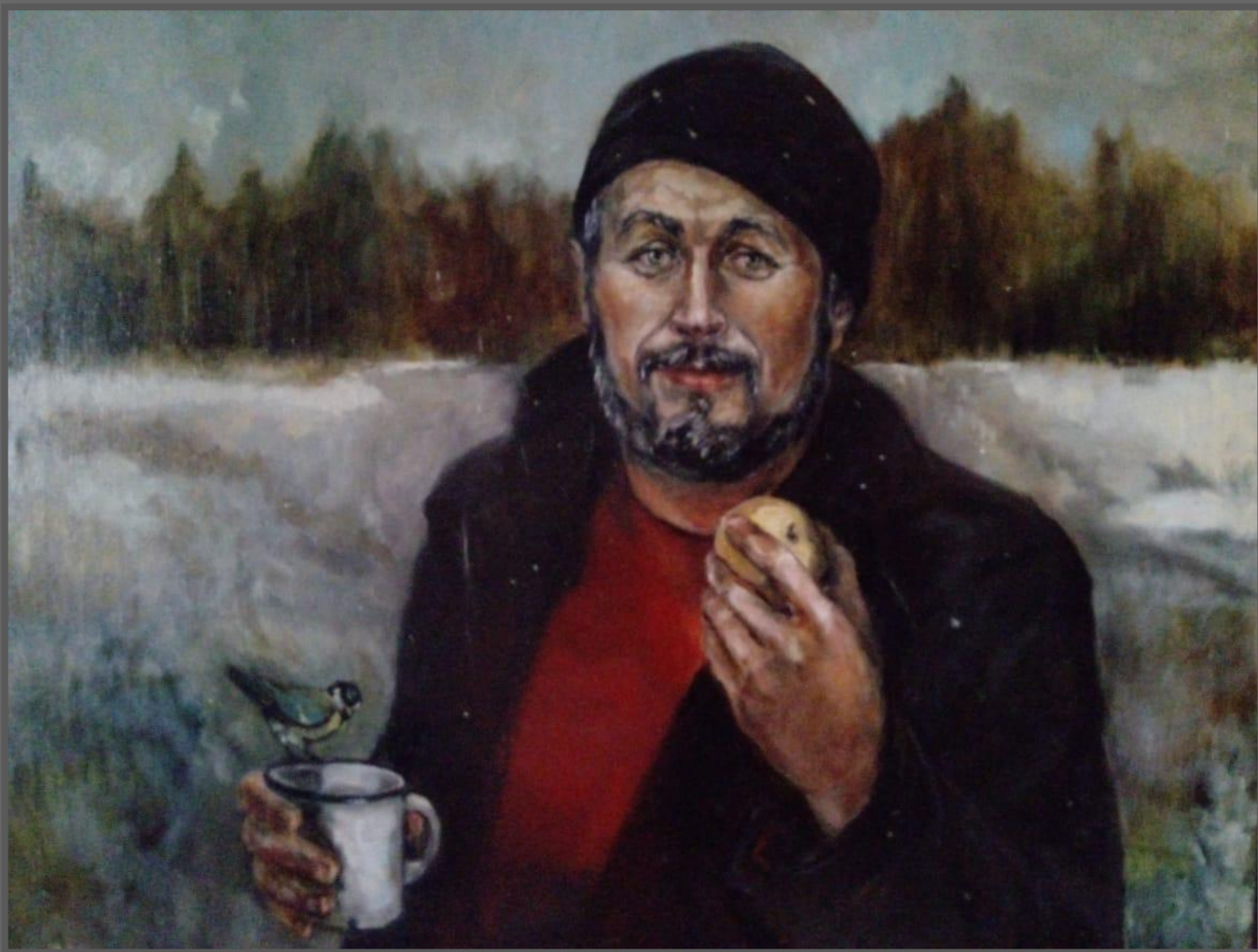
Сергей Ковалев. 2016 г. Холст, масло, 105 x 85 см