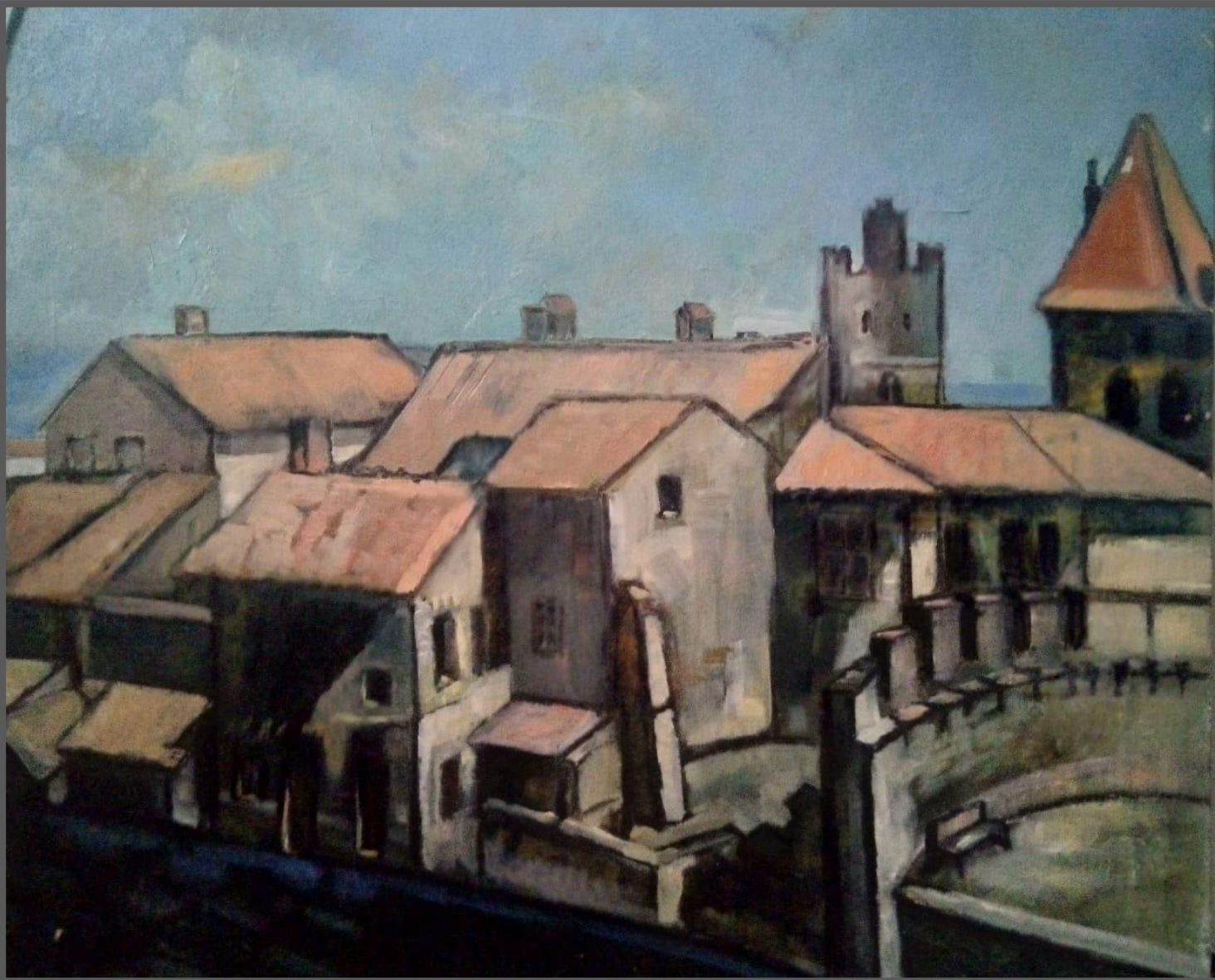
Крепость. 2015 г. Холст, масло, 60x50 см