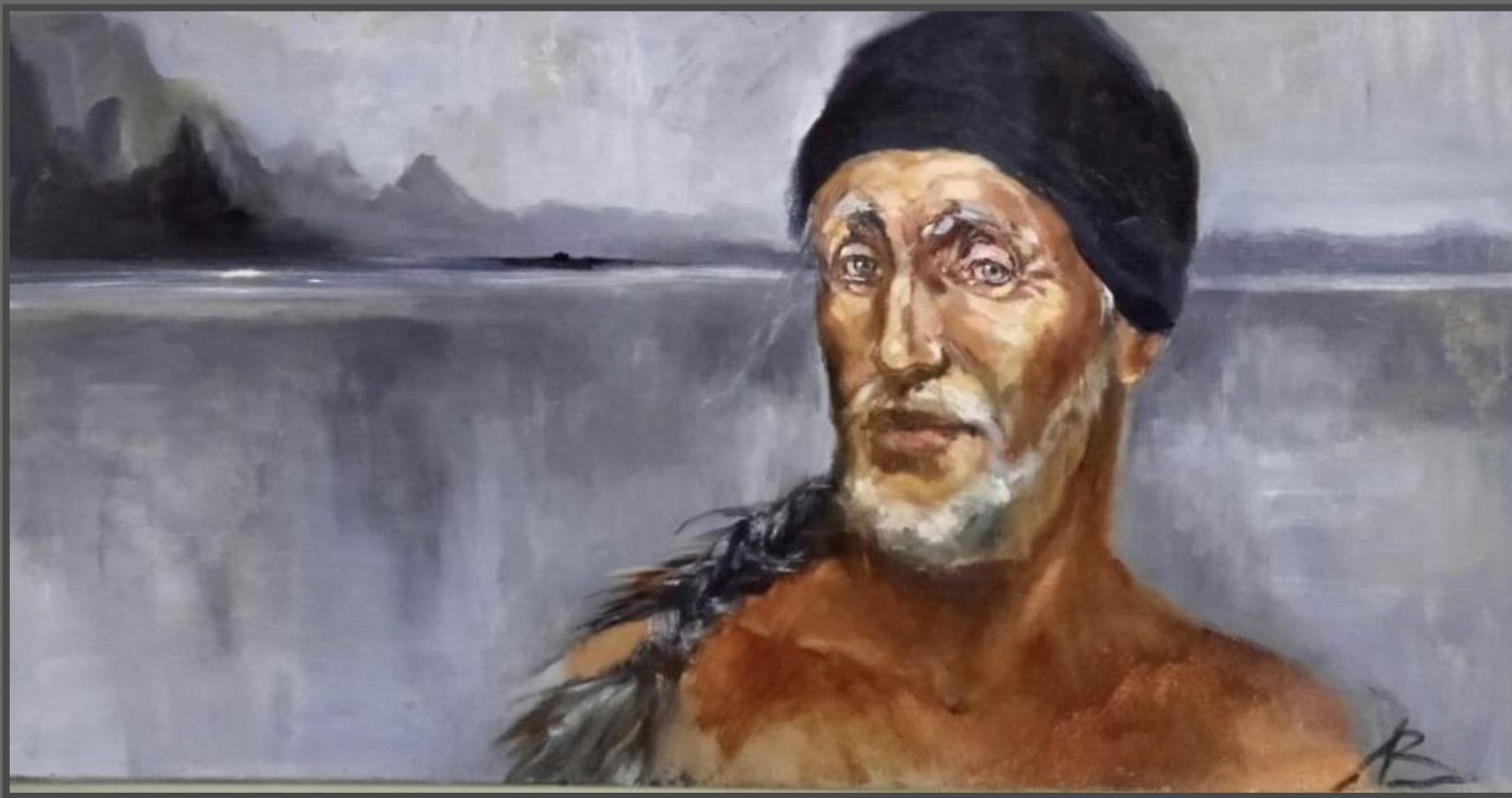
Прохожий. 2018 г. Холст, масло, 100x50 см

Я может быть когда-нибудь вернусь – Меня зовет печальная природа, И зов ее сильнее год от года: Так кличет сына Северная Русь!