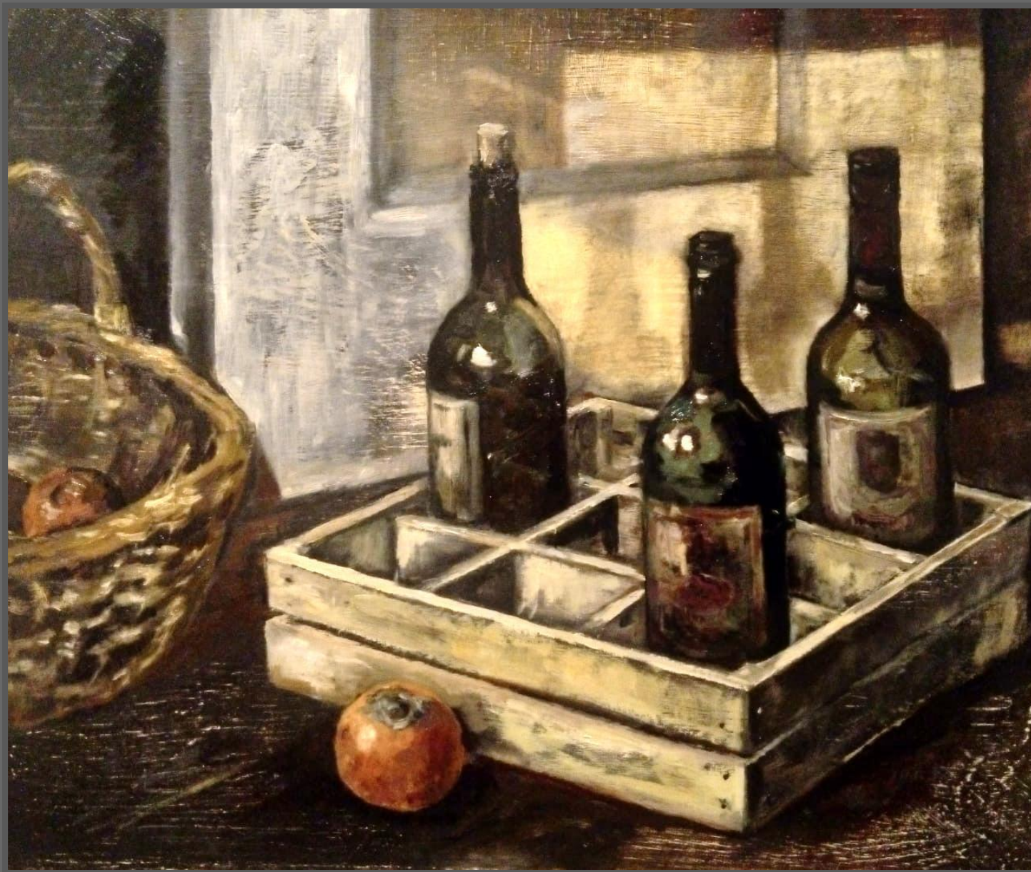
Композиция 7, серия «Простые вещи». 2020 г.