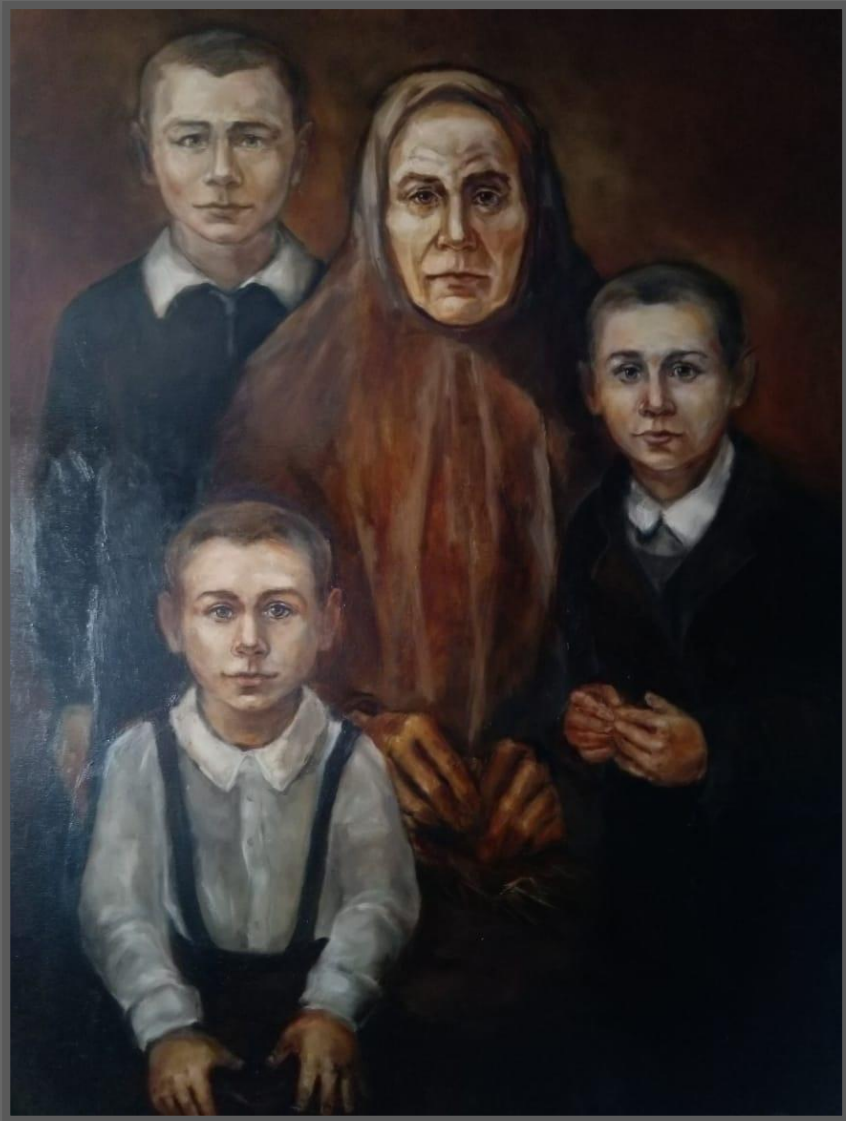
Портрет прабабушки. 2019 г.