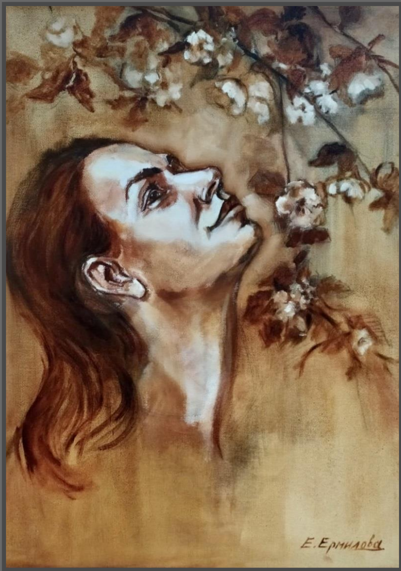
Из серии «Сестра Катя». 2016 г. Холст, сангина, 70х50 см