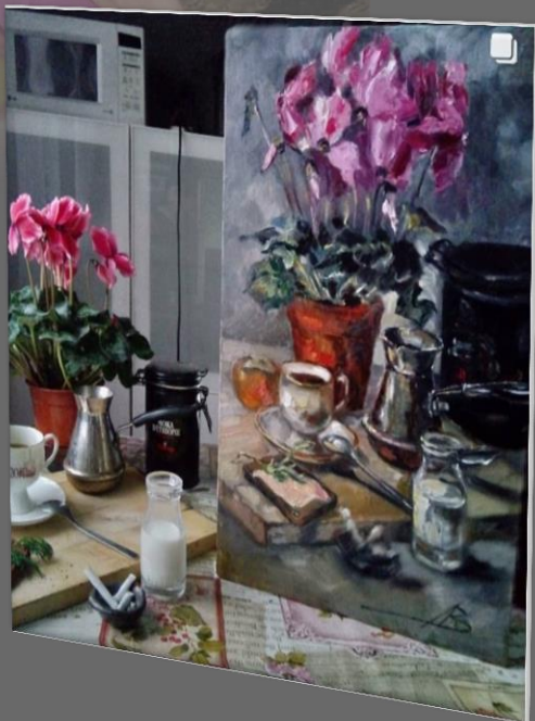
Композиция 4, серия «Простые вещи». 2019 г. Холст, масло, 50 x 30 см