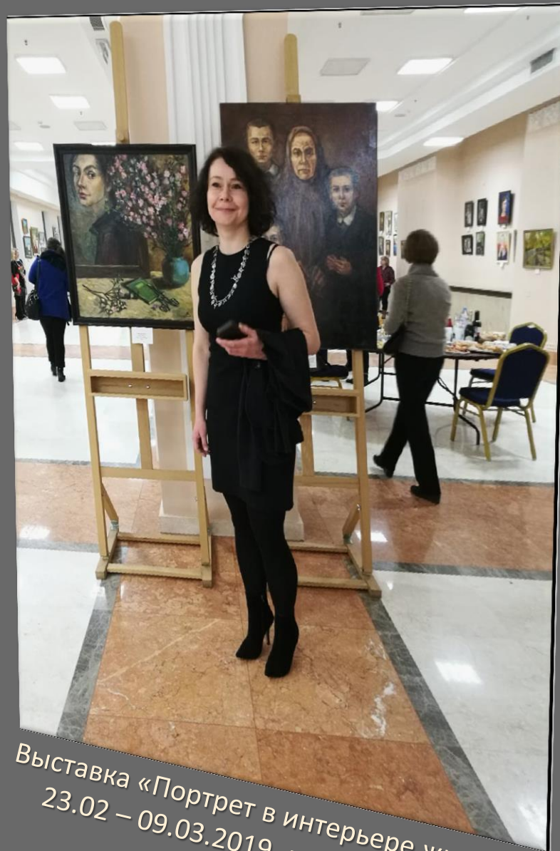
Выставка «Портрет в интерьере жизни» 23.02 – 09.03.2019, музей Ар-Деко