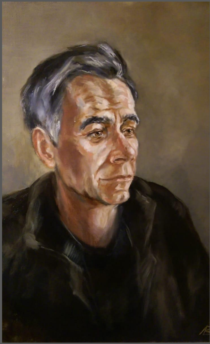
Портрет отца. 2017 г. Холст, масло, 70 x 50 см