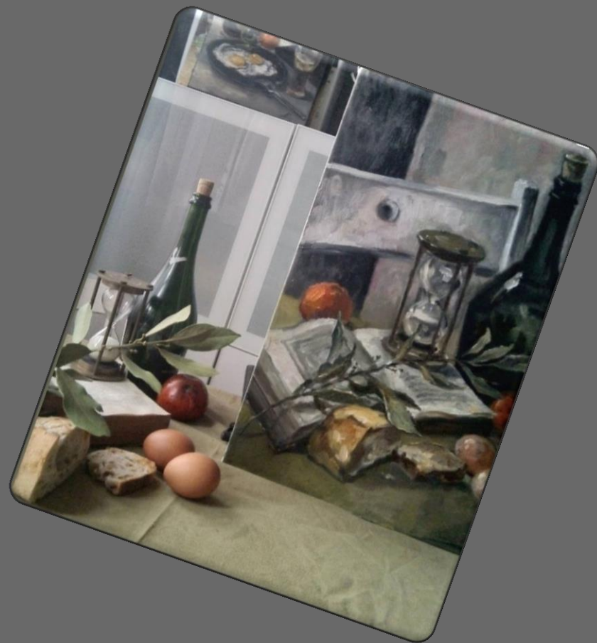
Композиция 2, серия «Простые вещи» 2019 г.