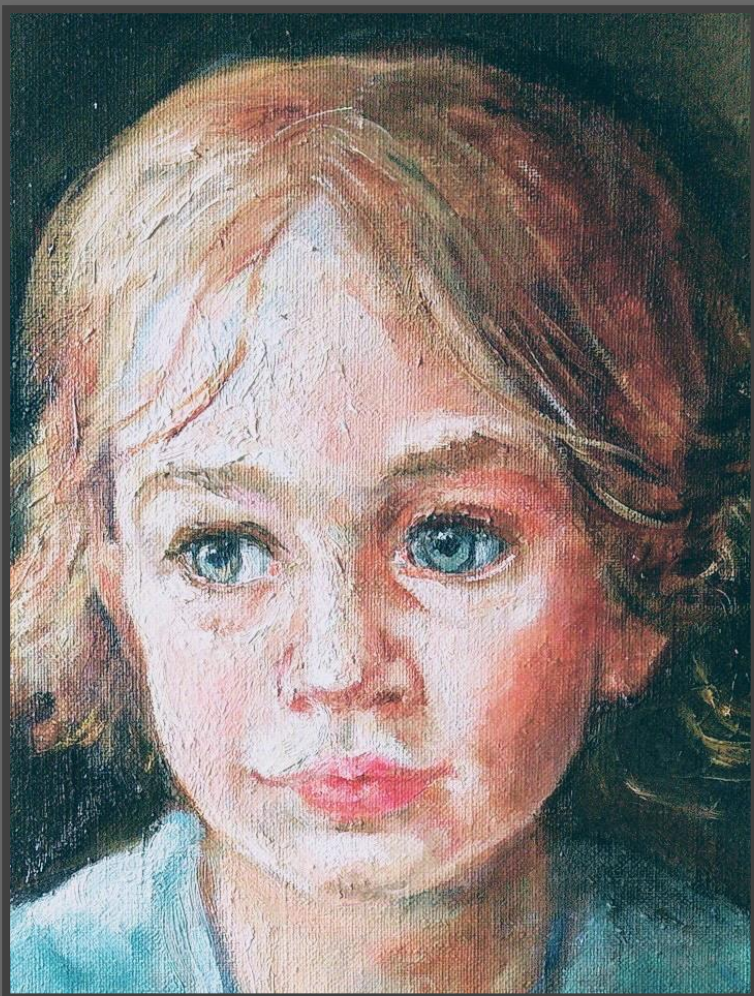
Вероника (деталь). 2018 г. Холст, масло, 60x50 см