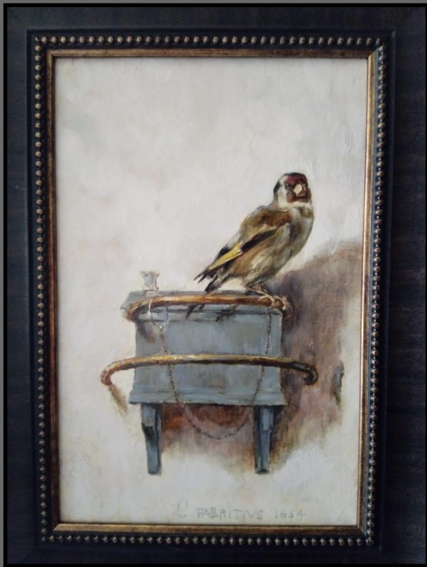
Щегол. 2019 г.

творческая копия с картины художника 17 в. Карела Фабрициуса; Холст, Масло, 20x30 см