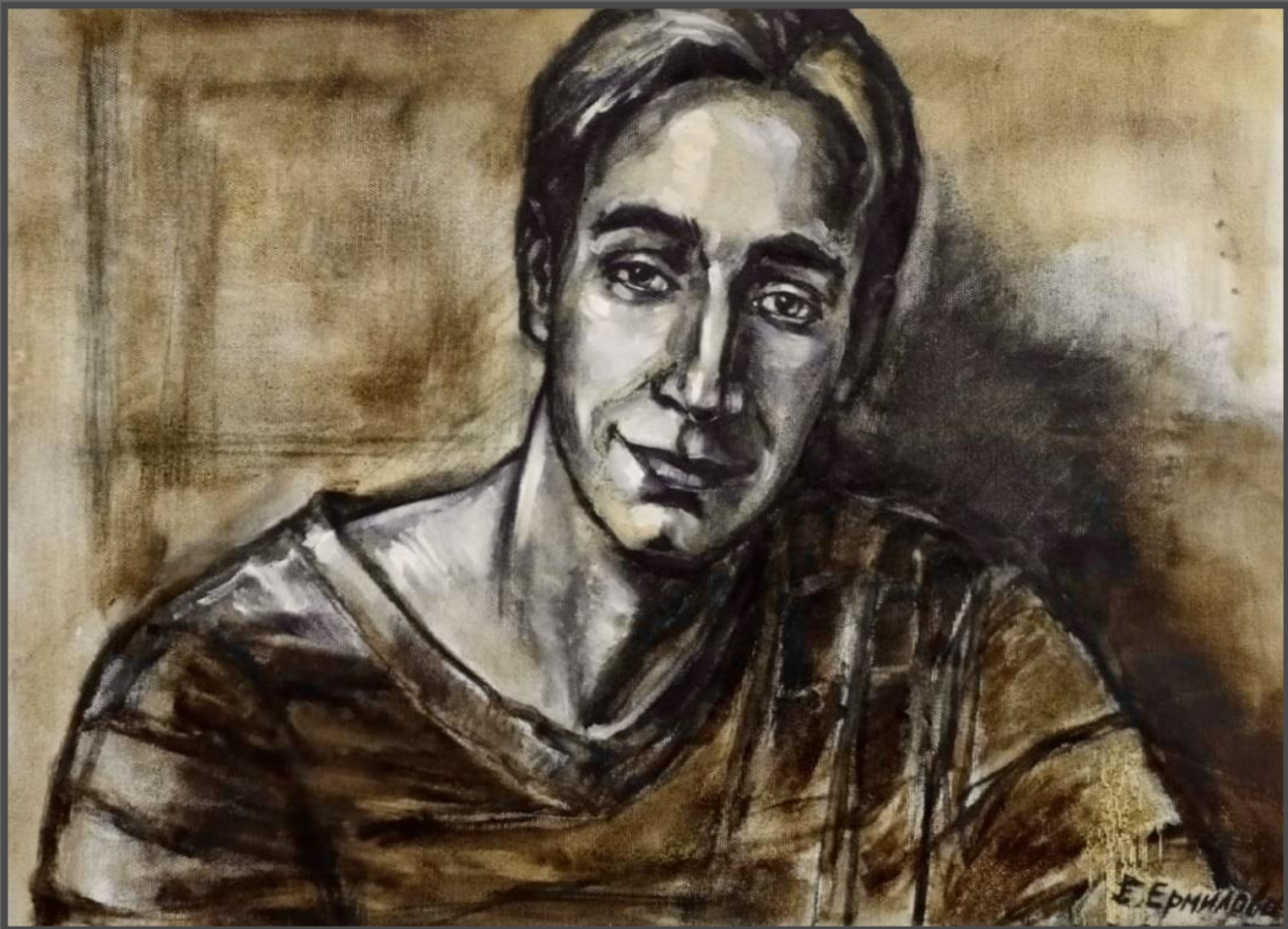
Савелий. Портрет сына. 2016 г. Холст, масло, 70х50 см