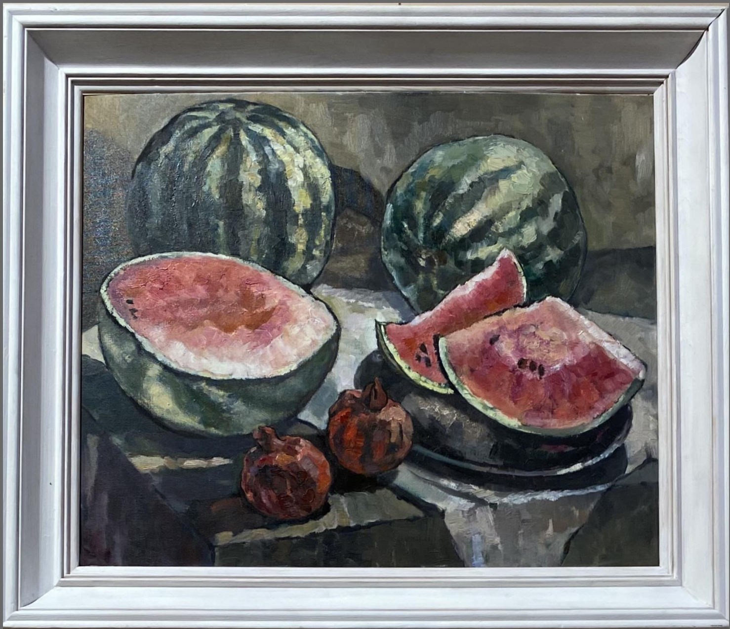
Вкус лета. 2013 г. Х. м., 50x60 см