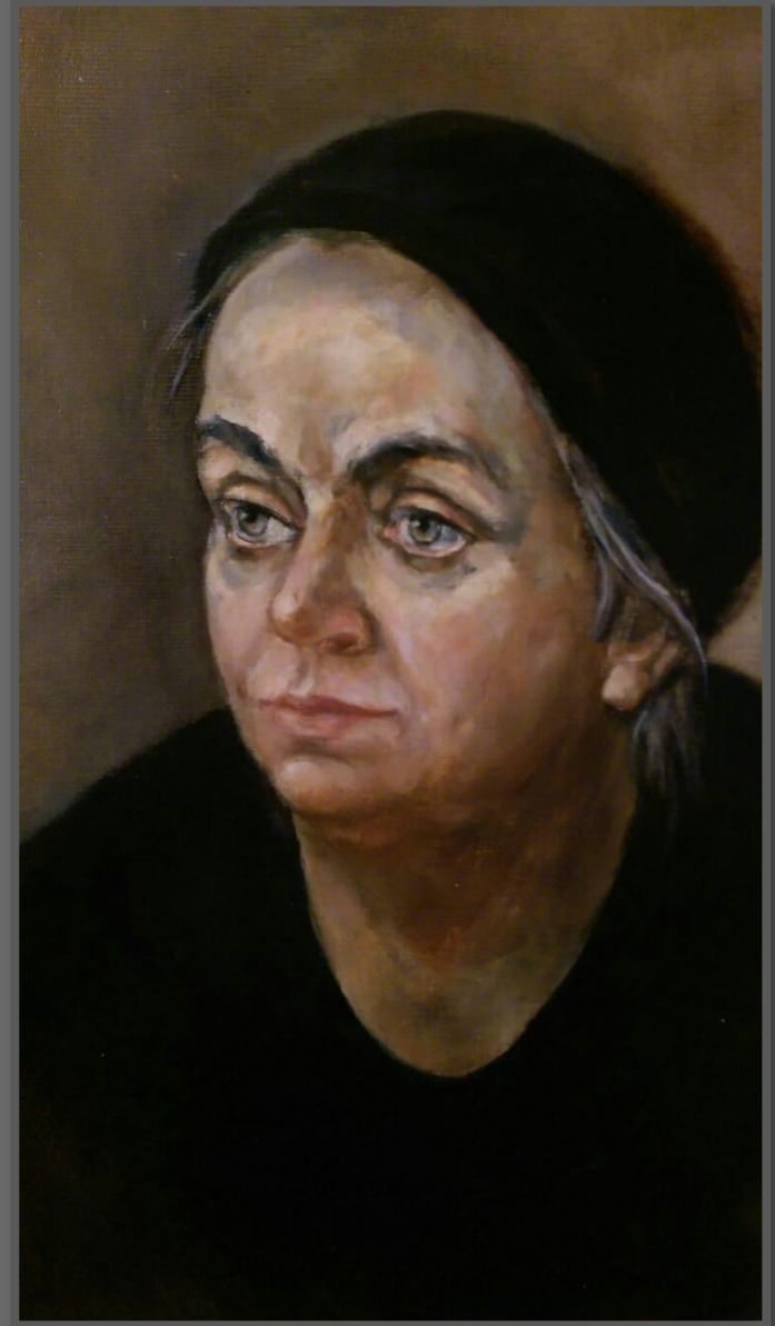
Портрет мамы. 2017 г. Холст, масло, 70 x 50 см