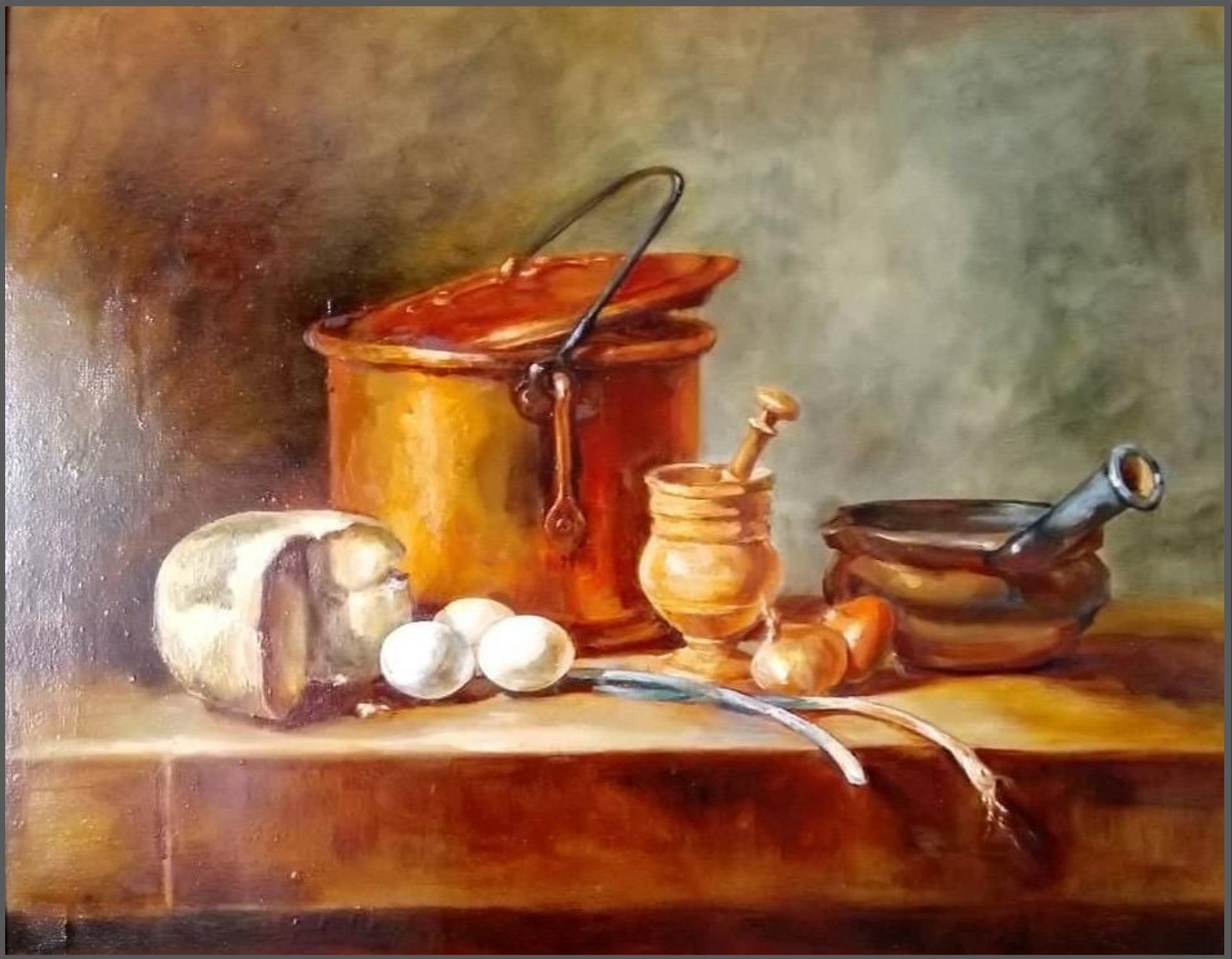
Натюрморт. 2019 г. Творческая копия картины Жан-Батиста Шардена «Натюрморт с медной кастрюлей, сыром и яйцами.1730 г.» Холст, масло, 50 x 40 см

«Кто вам сказал, что рисуют красками? Кто-то, может и красками, а другой – чувствами» - Жан-Батист Шарден