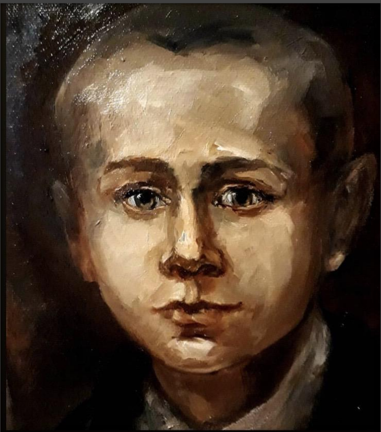
Эскиз к картине «Портрет прабабушки» из серии «Мальчишки». 2019 г. Холст, масло, 30 x 40 см

Рисует узоры мороз на оконном стекле, Но нашим мальчишкам сидеть не по нраву в тепле. Мальчишки, мальчишки несутся по снежным горам. Мальчишки, мальчишки, ну как не завидовать вам.