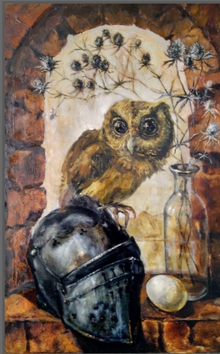
Легенда. 2019 г. х., м., 80x50 см