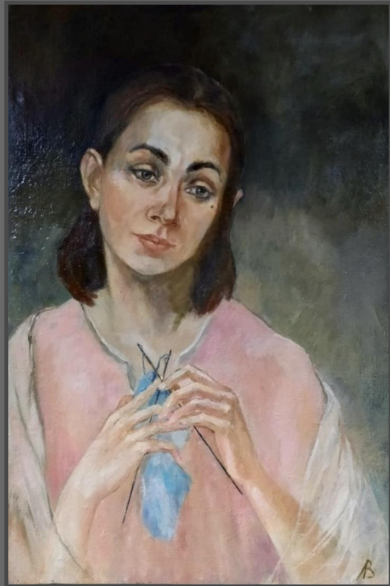
Из серии «Сестра Катя». 2018 г. Холст, масло, 75х50 см