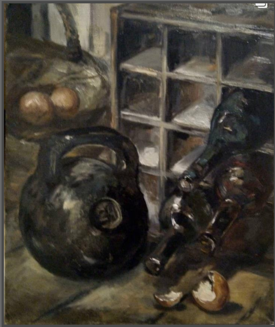
Композиция 3 (Сила и Хрупкость) серия «Простые вещи». 2019 г. Холст, масло, 50 x 40 см