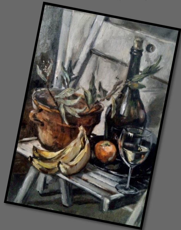
Композиция 5, серия «Простые вещи». 2019 г. Холст, масло, 50 х 35 см