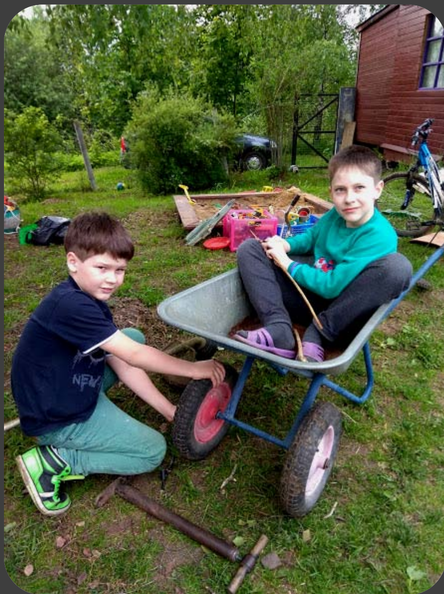
КТО-ТО ИНВЕНТАРЬ ЧИНИТ,