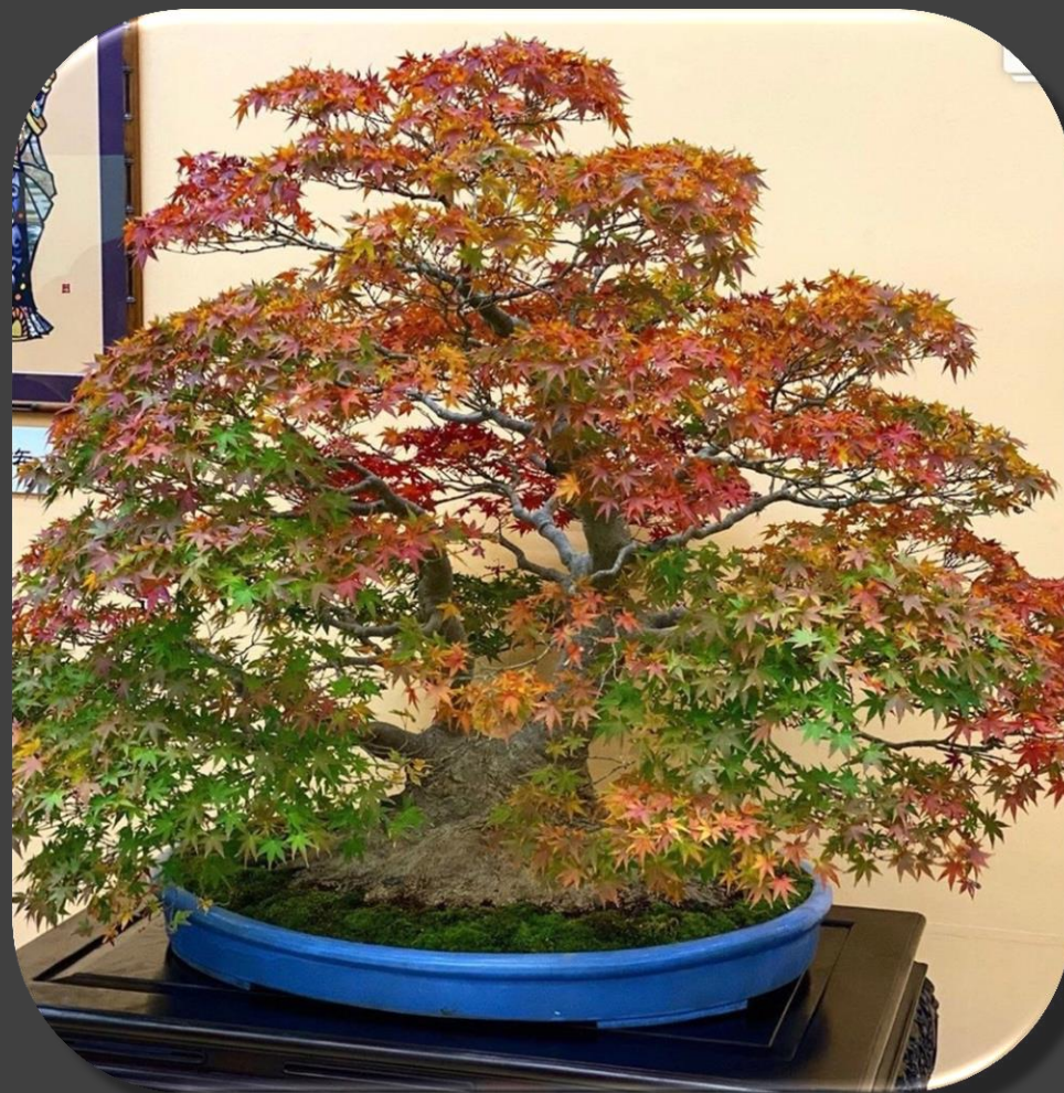
Японский клен бонсай

Деревья бонсай на 39-й ежегодной выставке бонсай в Киото, ноябрь 2019 г.