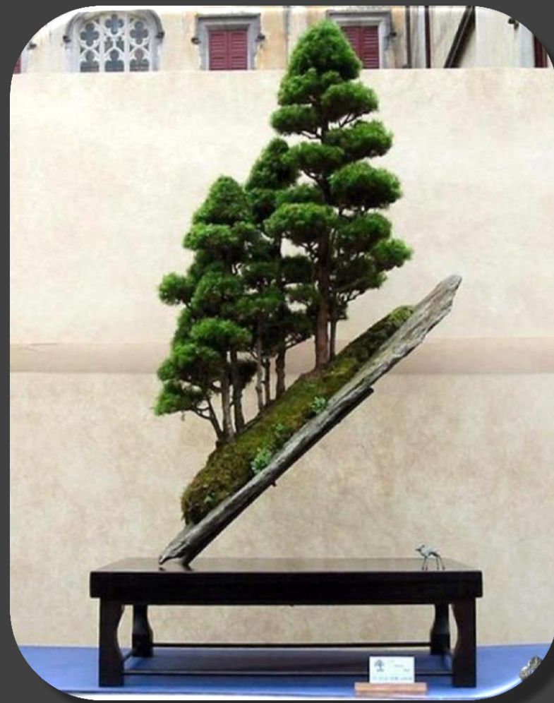
Лесная наклонная композиция из можжевельников.

Слово пенсай со временем преобразовалось в бонсай, хотя его суть не изменилась.