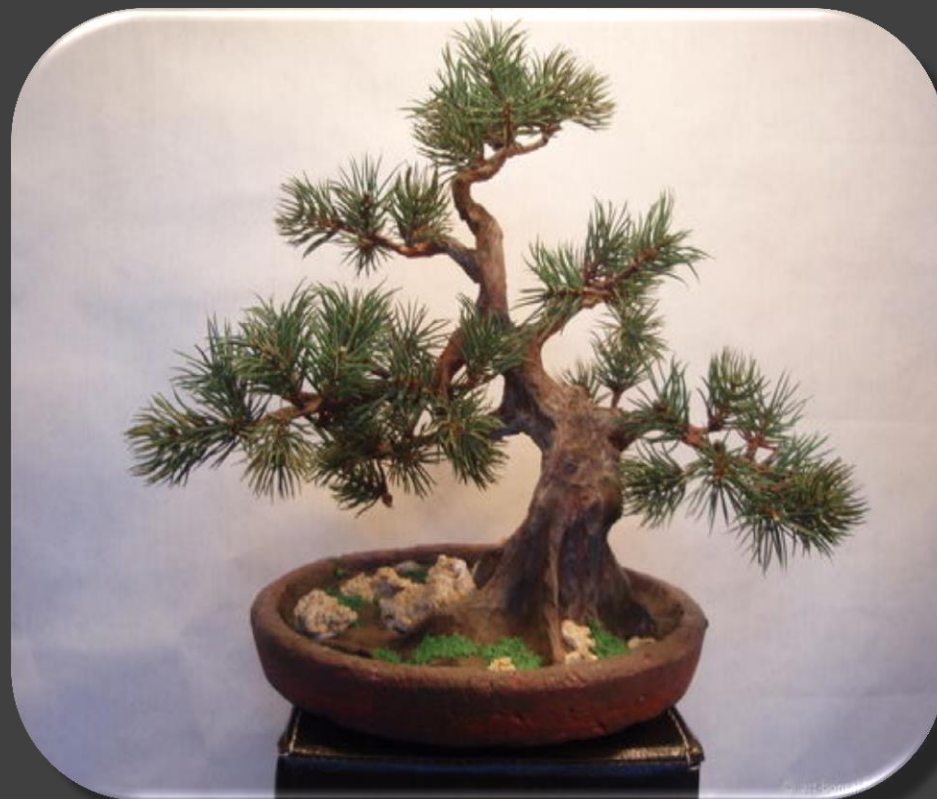
Бонсай Сосна в стиле Moyogi («Неправильный прямостоящий»)

Сегодня в Японии произрастает более 100 тысяч миниатюрных деревьев, причем некоторые уже имеют вековую историю. В японских семьях существует традиция передавать деревья в стиле бонсай из поколения в поколение в качестве ценной семейной реликвии.