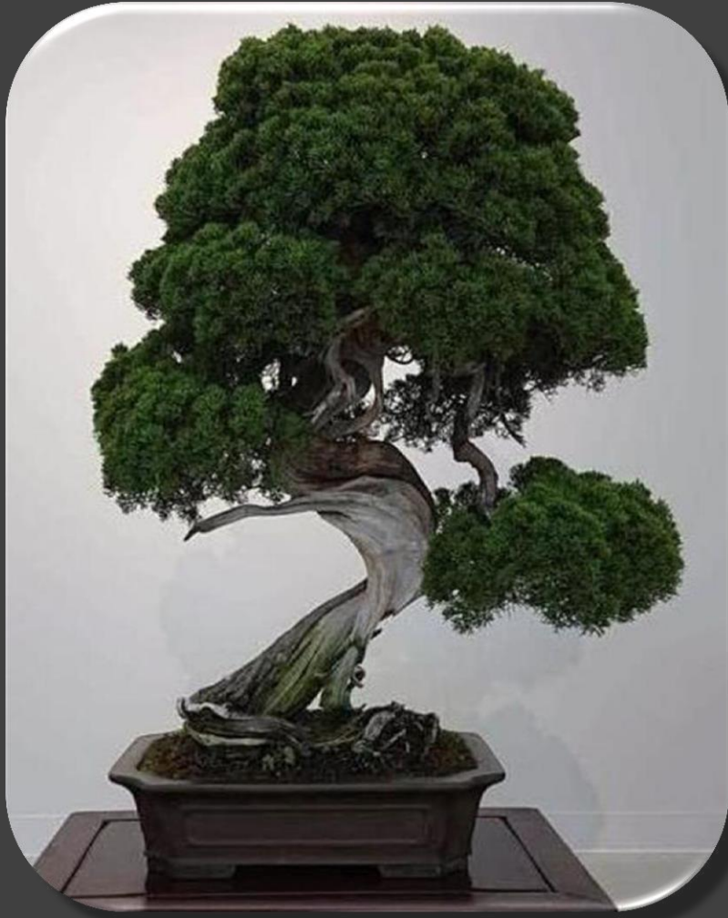
Можжевельник бонсай, возраст – 400 лет

Легенды отодвигают время зарождения бонсай вглубь веков. Одна из легенд гласит. Однажды у властелина Китая возникло желание больше узнать о своей империи. Естественно, исколесить всю Поднебесную император не мог, поэтому во все провинции Китая, с целью изучения характеристик местности и последующего их изображения в миниатюре, были отправлены группы из нескольких десятков образованных людей. Так была создана миниатюрная империя, которая изображала реки, горы, деревья, дома, скот и даже людей в значительно уменьшенном масштабе.