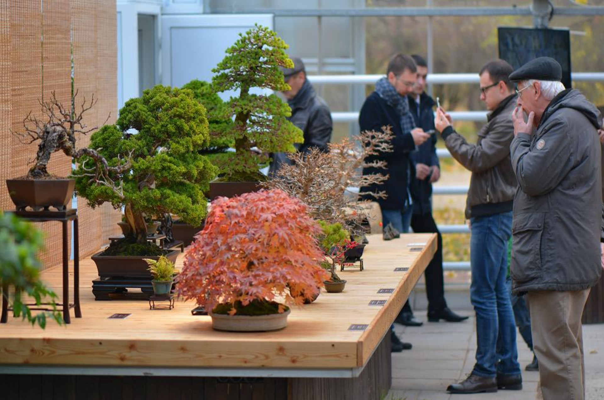
На выставке «Мир в глиняном горшке» в Ботаническом саду МГУ «Аптекарский огород», ноябрь 2015 г.