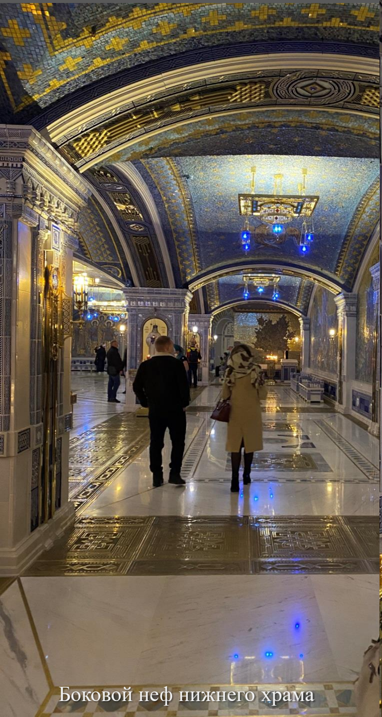
Боковой неф нижнего храма