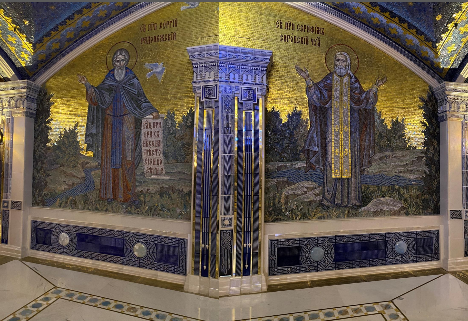
Настенные мозаики с изображениями Св. прп. Сергия Радонежского и Серафима Саровского