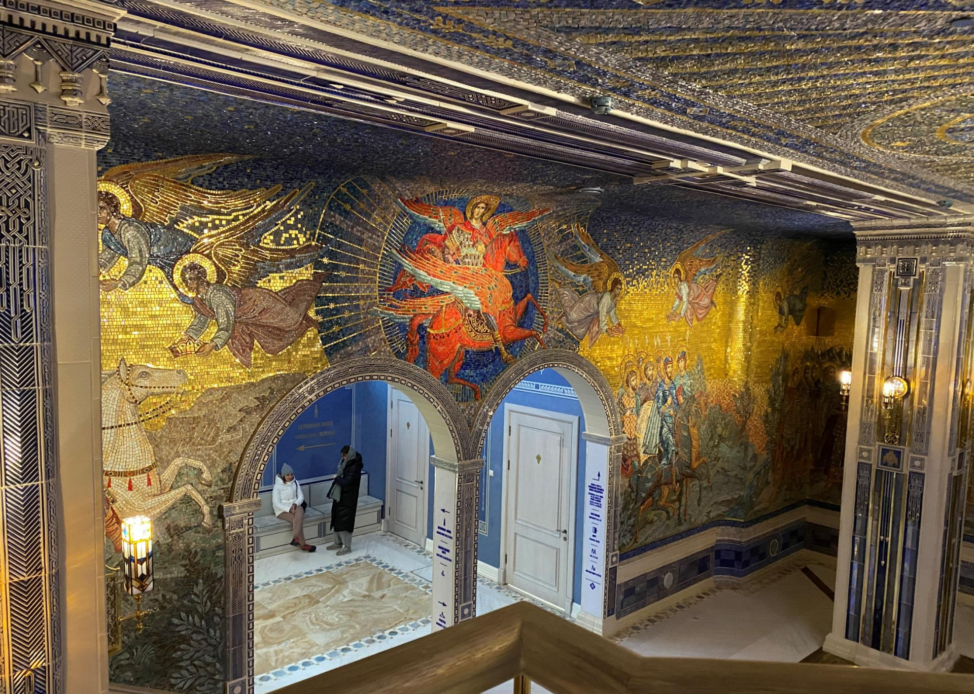
Автор храмовых мозаик - народный художник РФ Василий Нестеренко