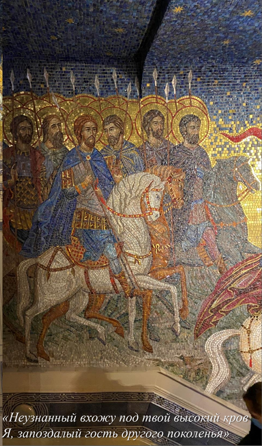
«Неузнанный вхожу под твой высокий кров Я, запоздалый гость другого поколения»