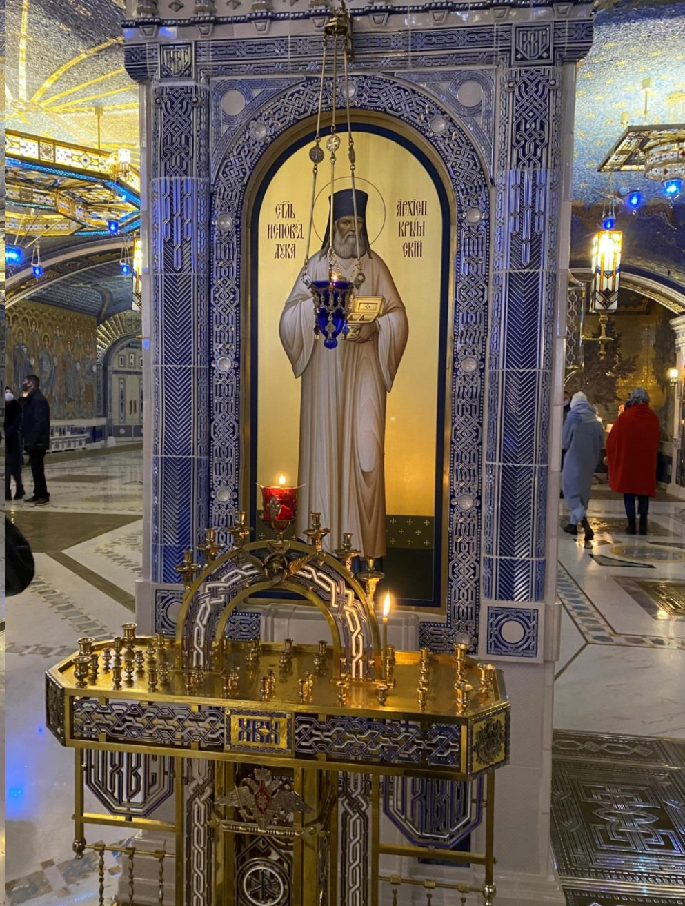
Икона Св. исповедника Луки, архиепископа Крымского