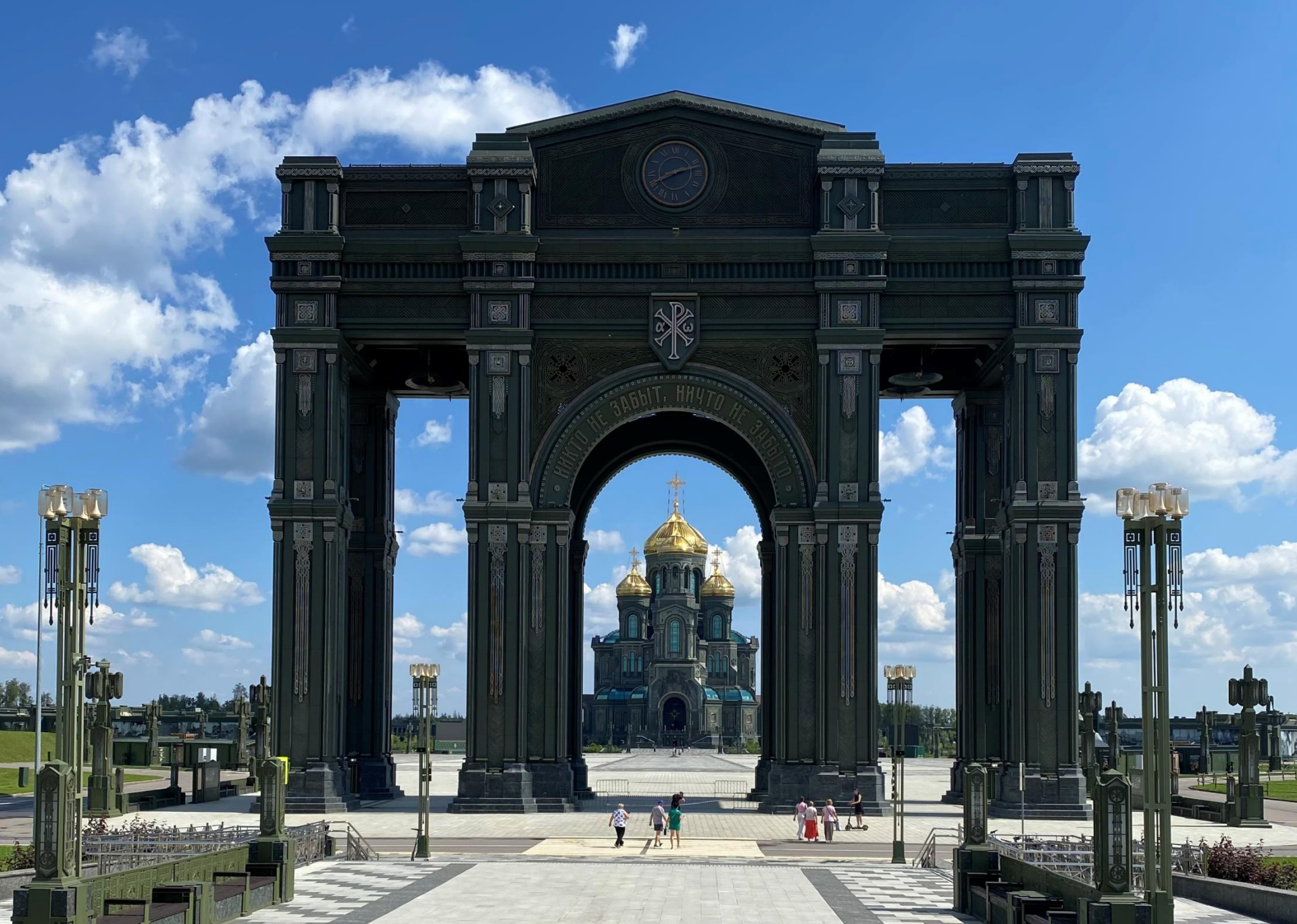
Храм отделан металлом и стеклом, а ступени храма отлиты из найденных фашистских орудий