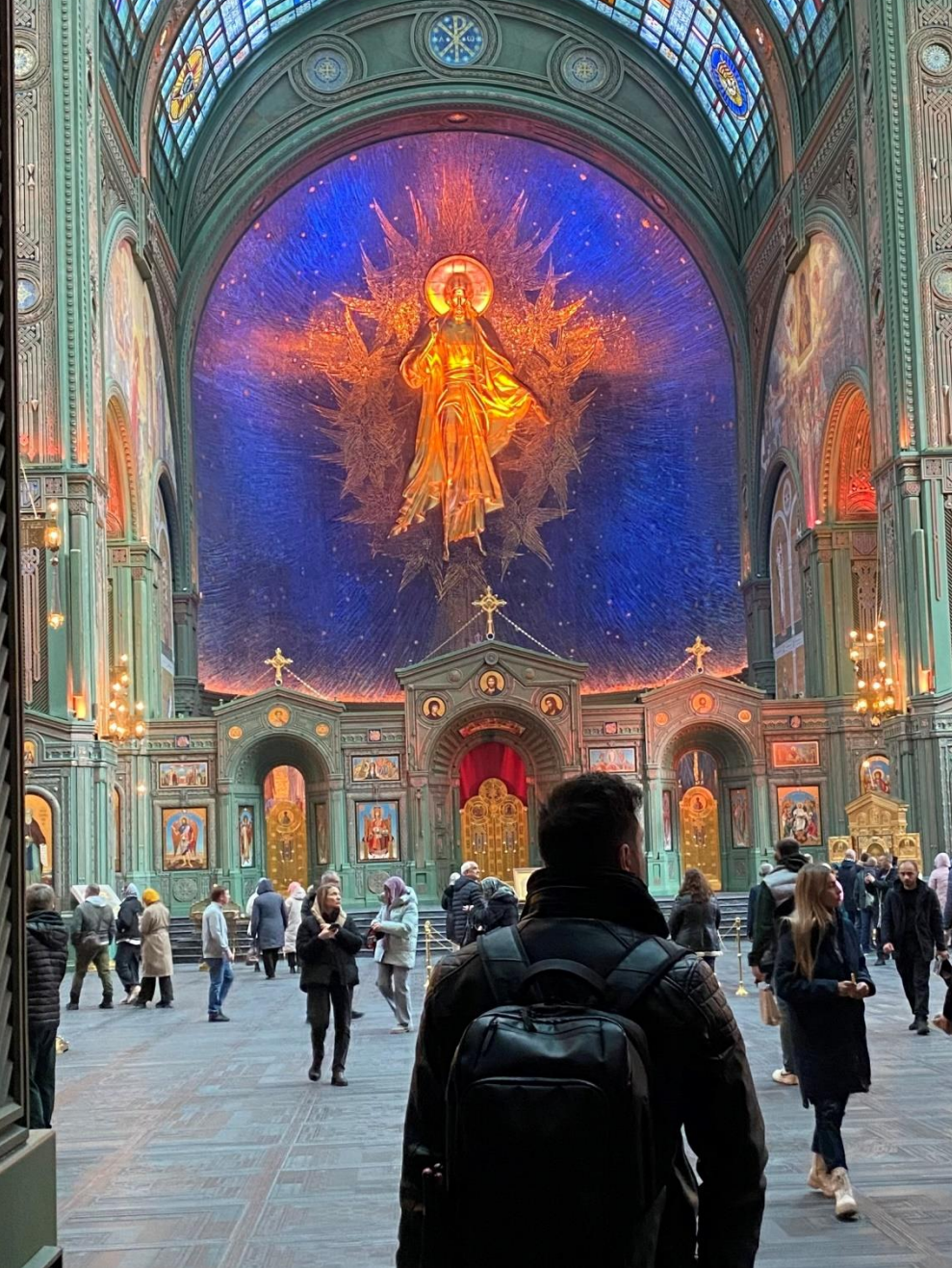
Главный Храм Вооруженных сил России изнутри. Слева: Образ Божией Матери — заступницы России в Великой Отечественной войне. Справа: вид на алтарь и алтарную икону Христа Спасителя.