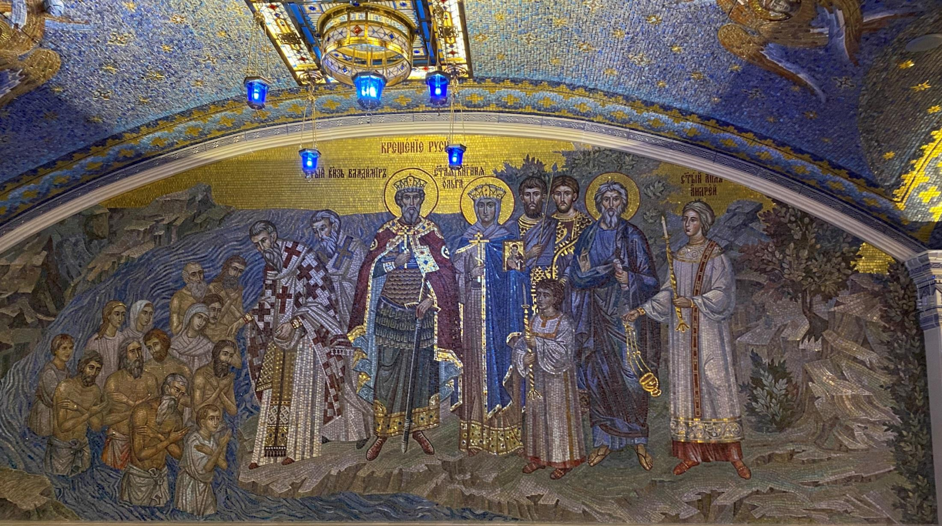
Настенная мозаика «Крещение Руси»