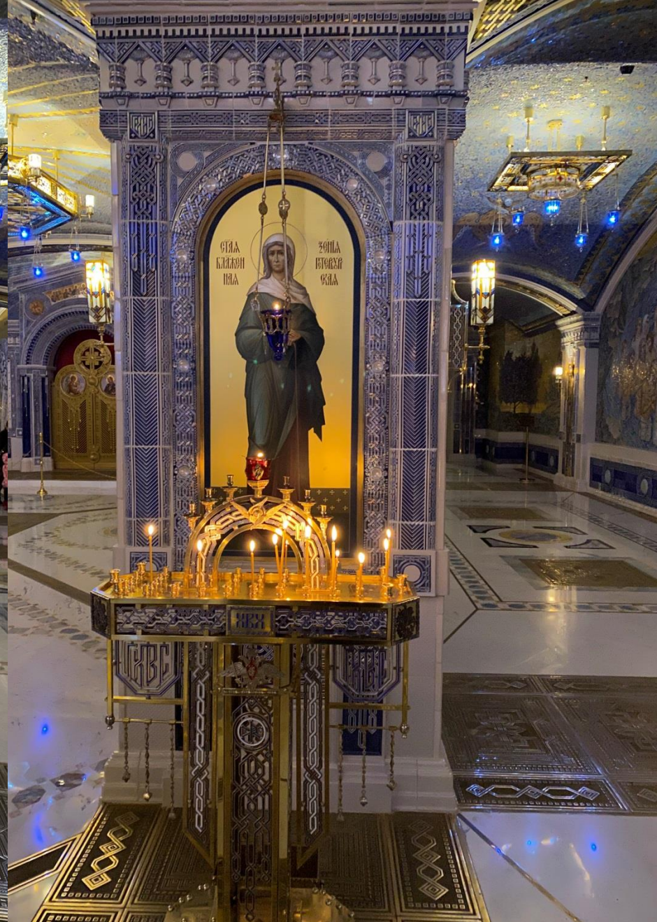
Икона Св.блаженной Ксении Петербургской