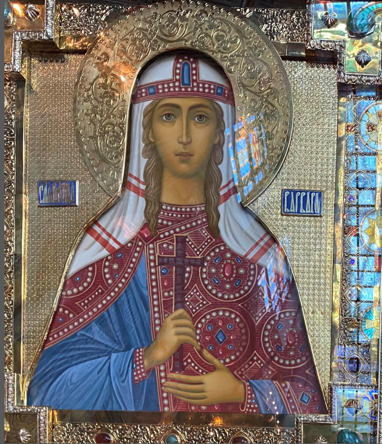
Икона святой великомученицы Варвары

Святая Великомученице Варвара! Пусть раны Твоего святого тела исцелят раны, которые моей душе нанес грех, а Твоя невинно пролитая кровь да очистит меня. Через муки и смерть Твою, молю Тебя, святая Великомученице Варвара, не дай мне умереть без покаяния и не приняв святыя Тайны Тела и Крови Господа нашего Иисуса Христа.