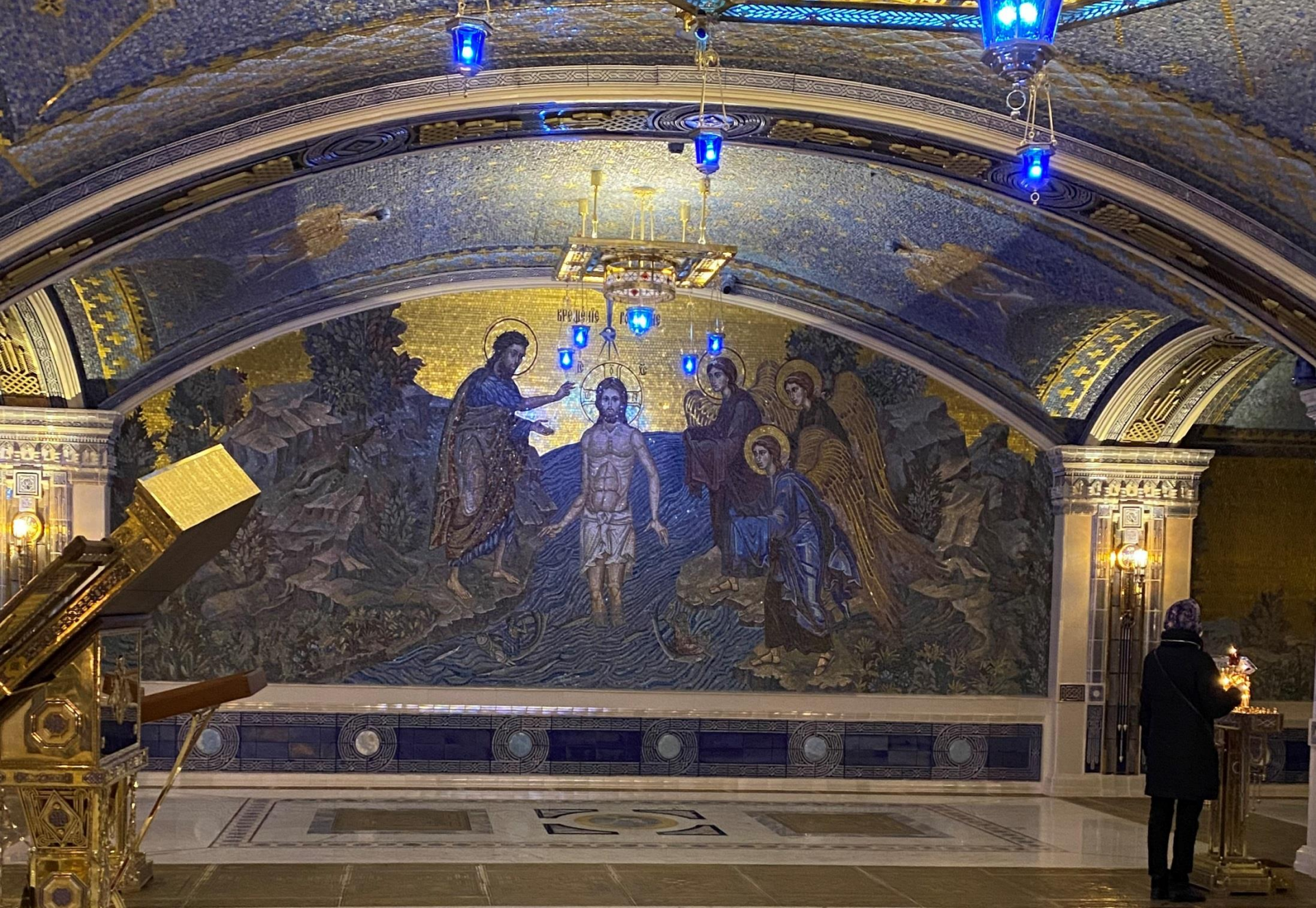
Настенная мозаика с изображением Крещения Господня