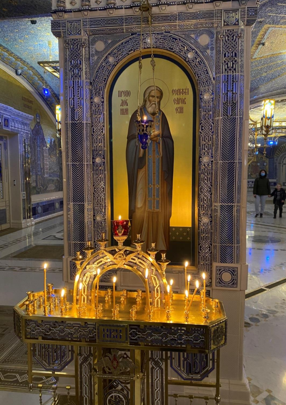
Икона прп. Серафима Саровского