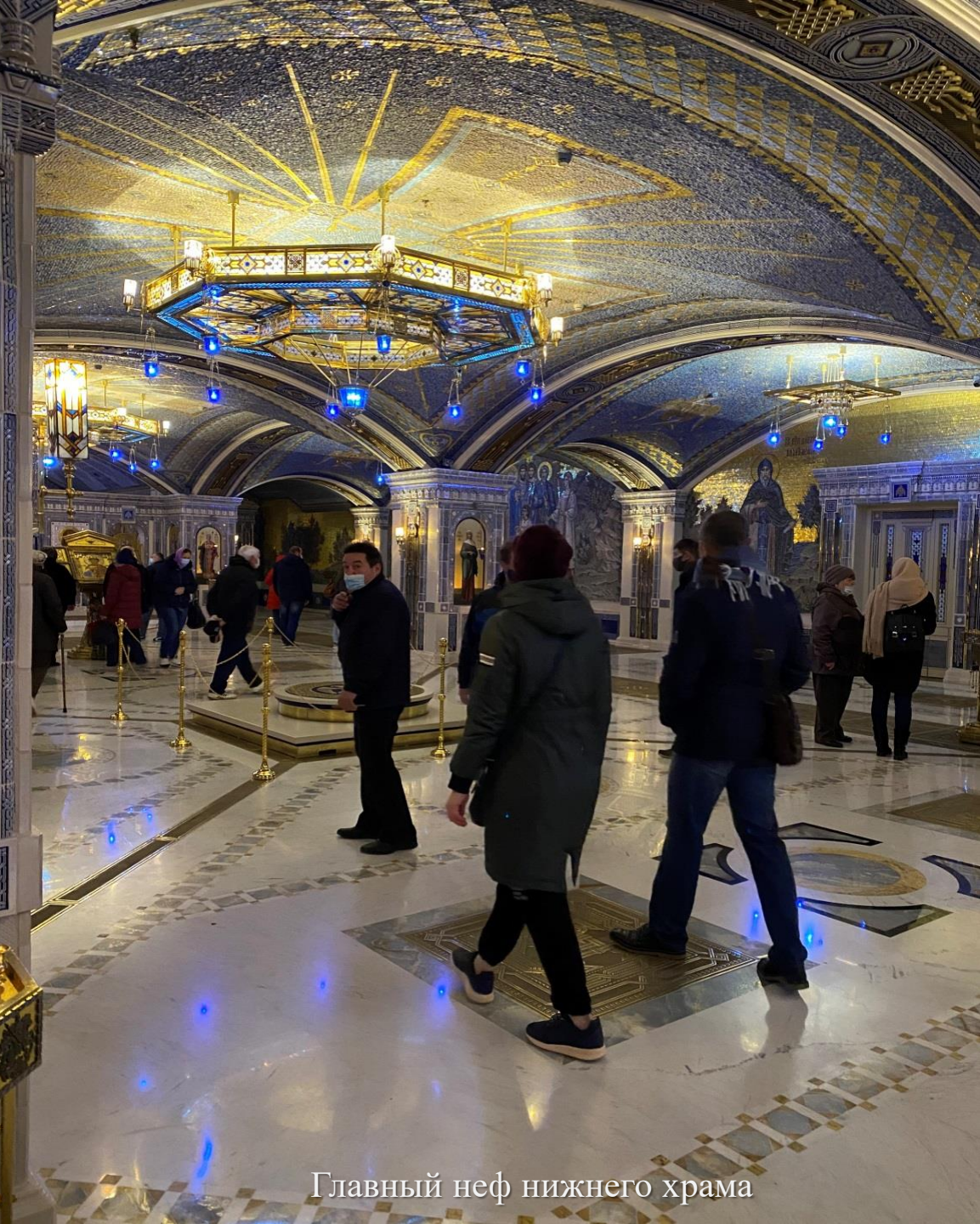
Главный неф нижнего храма