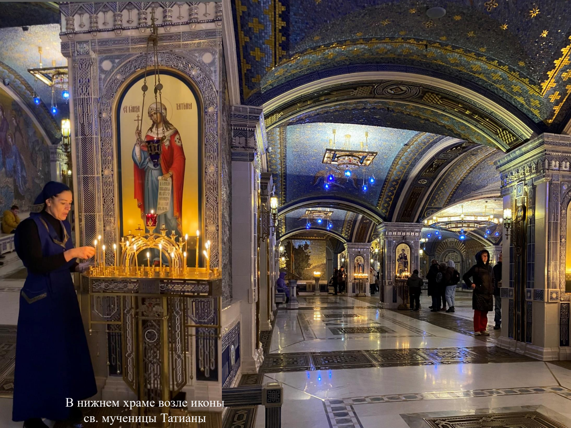
В нижнем храме возле иконы св. мученицы Татианы