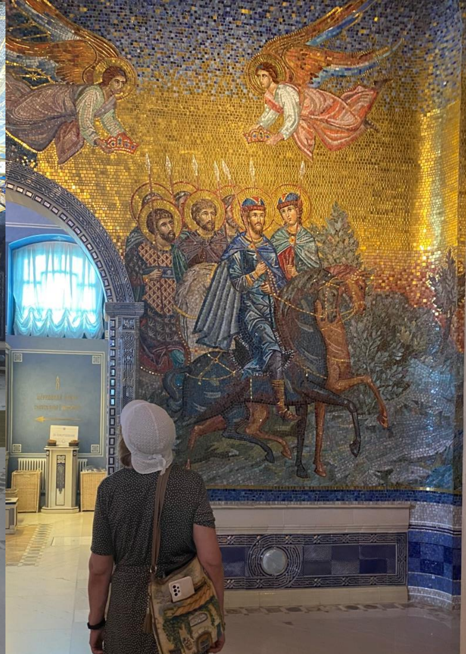
Икона святых Петра и Февронии (слева), Икона святых Бориса и Глеба (справа)