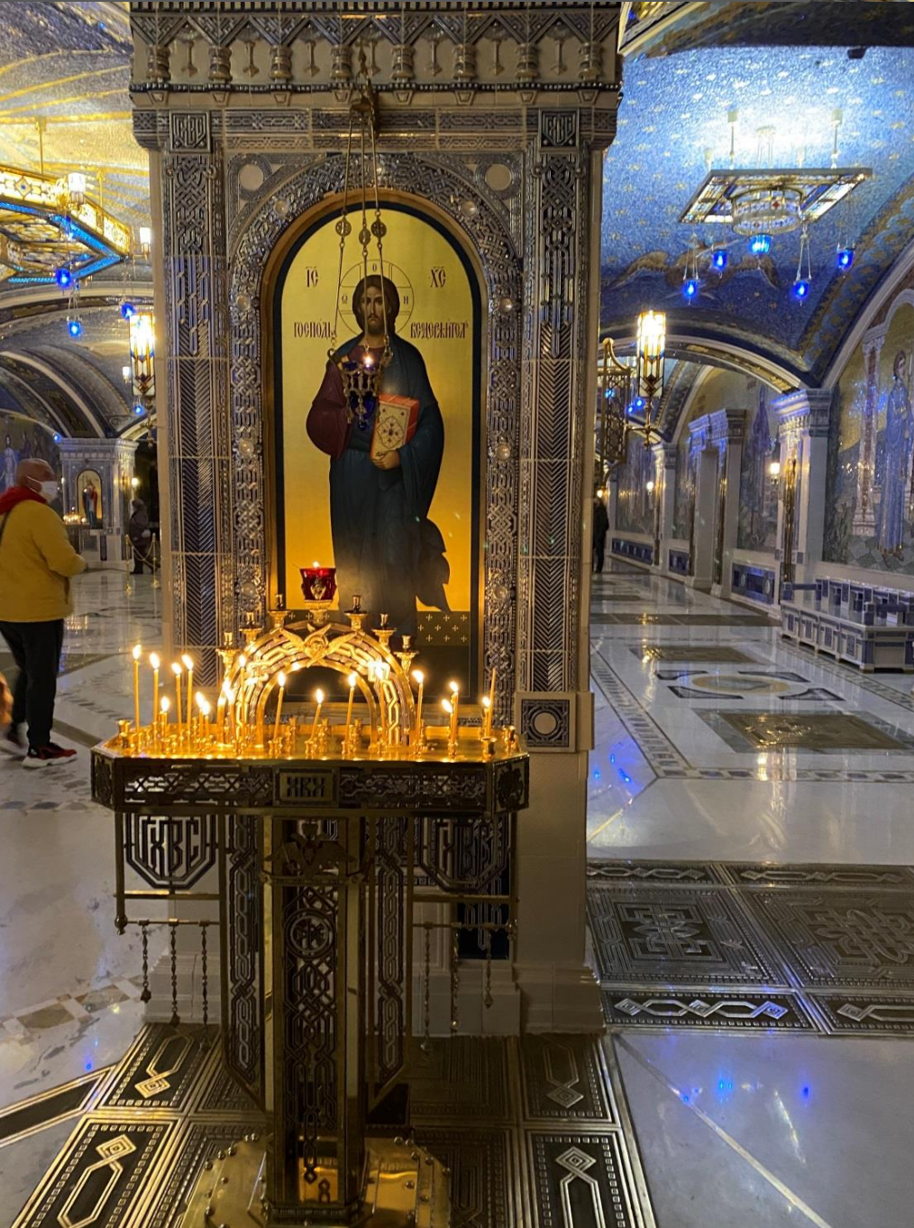
Икона «Господь Вседержитель»