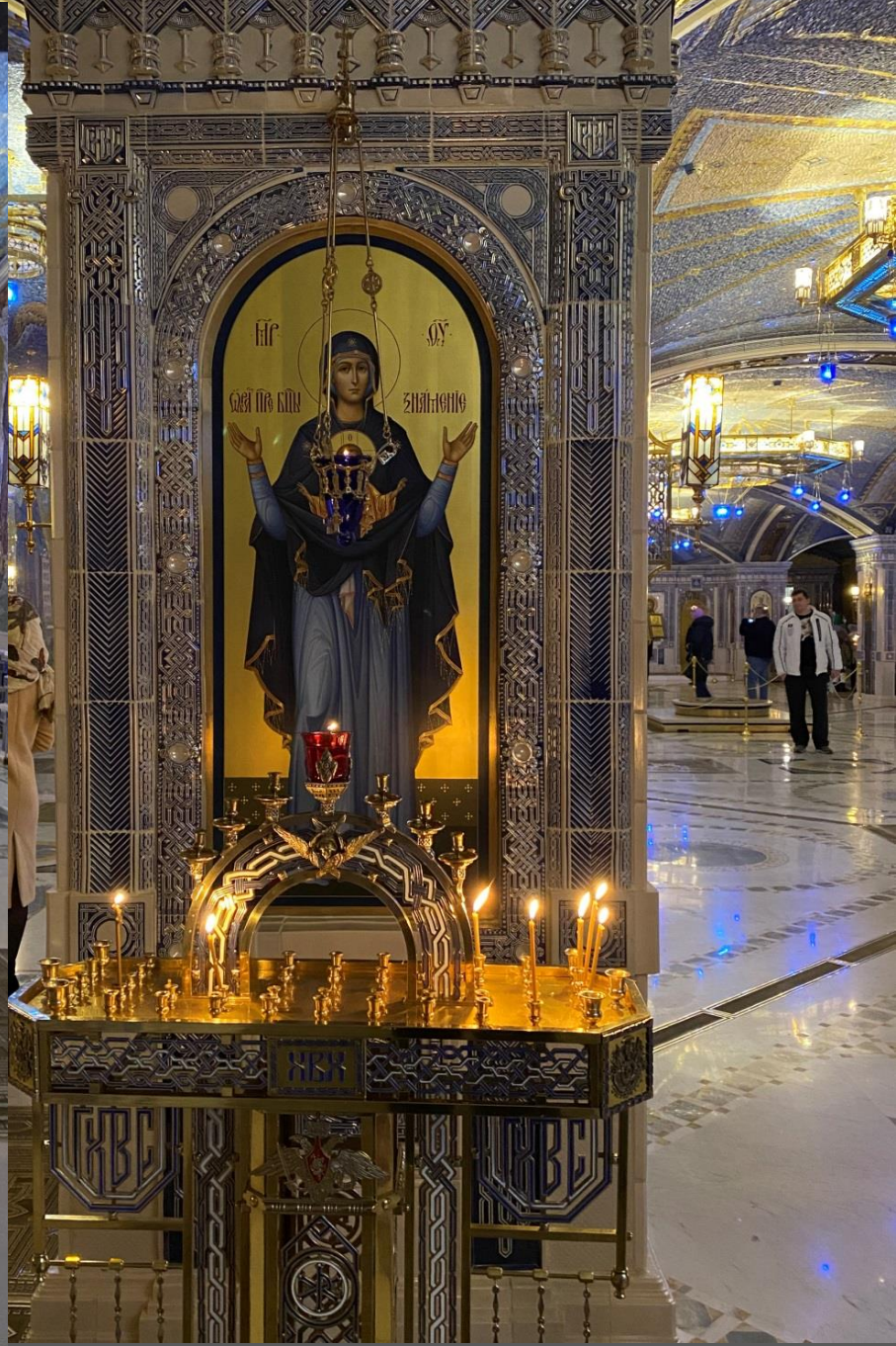
Икона «Богородица Знамение»