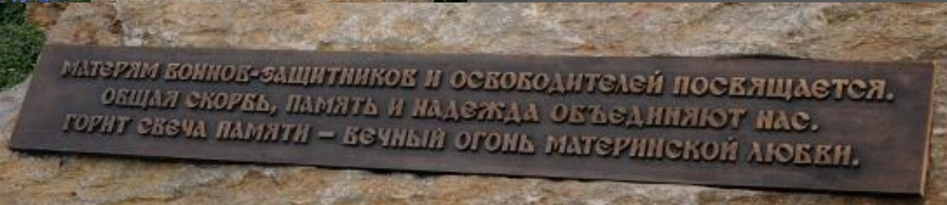
Памятник "Матерям победителей" на территории парка «Патриот»

( https://tvzvezda.ru/news/20206221045-LUapK.html )