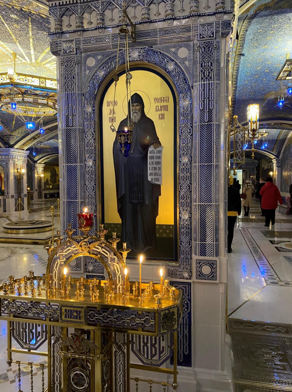
Икона прп. Серафима Вьрицкого