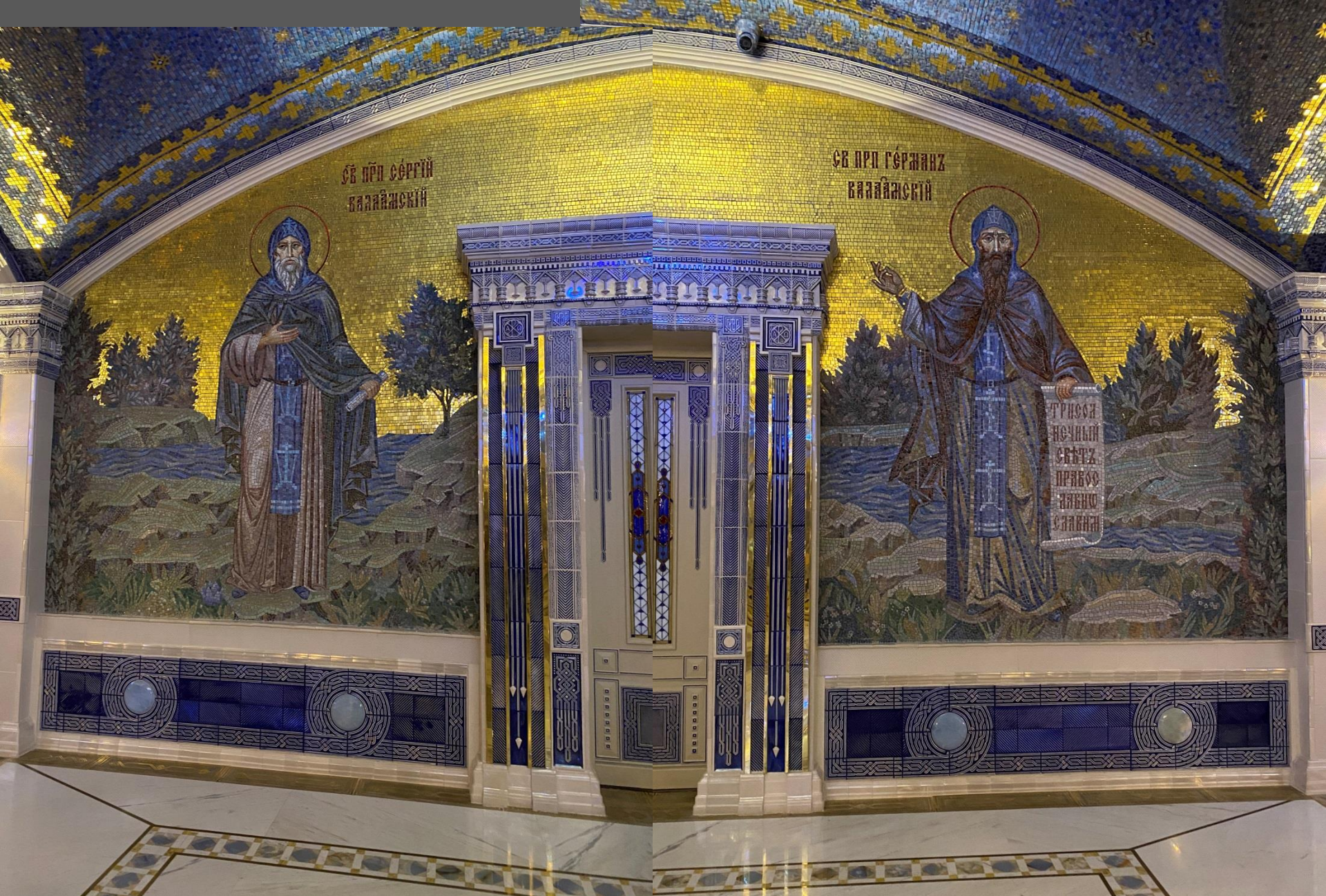
Настенные мозаики с изображениями Св. прп. Сергия и Германа Валаамских