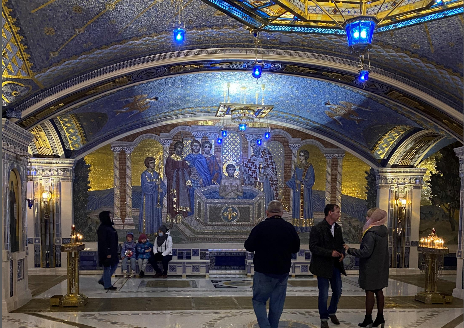
Настенная мозаика с изображением крещения Св. равноапостольного князя Владимира