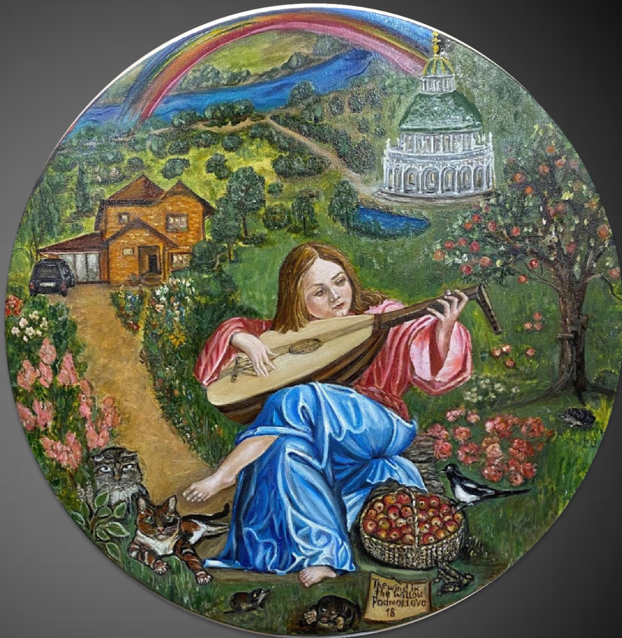
Елена Шкитова Ветер в ивах. Подмоклово. 2021 г. Х., м., 60x60 см