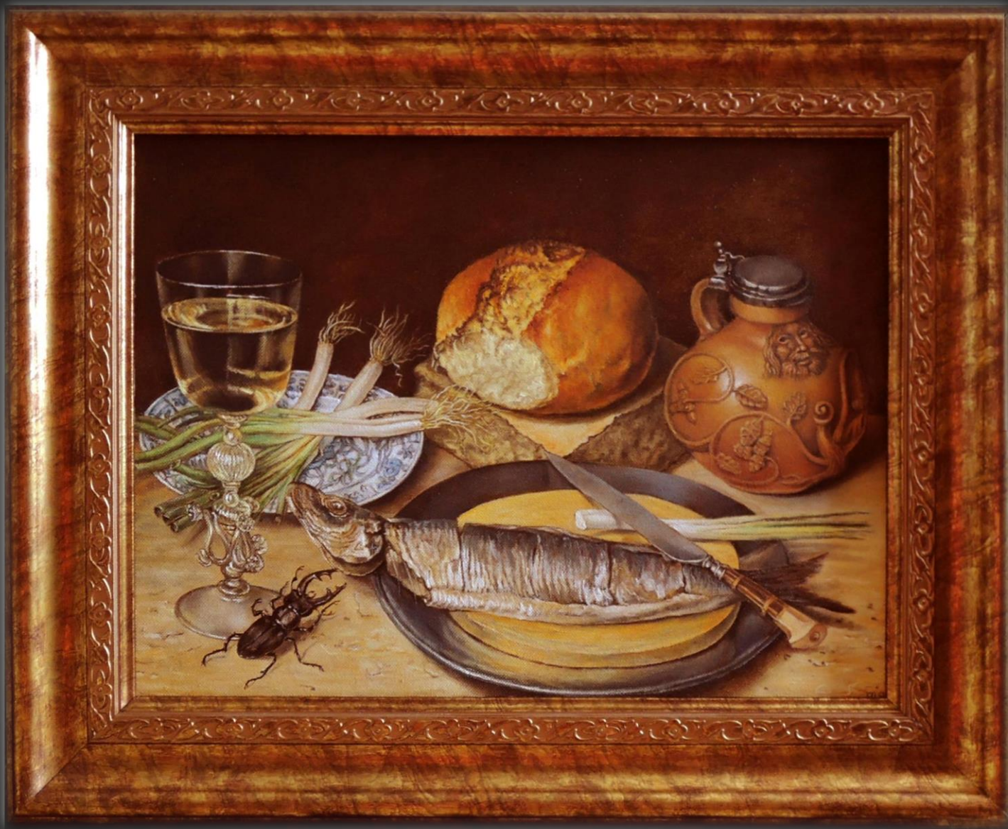
Юлия Якобсон. Натюрморт с жуком-рогачем . 2017 г. Х., м., 30x40 см Копия одноименной картины Георга Флегеля (1635)