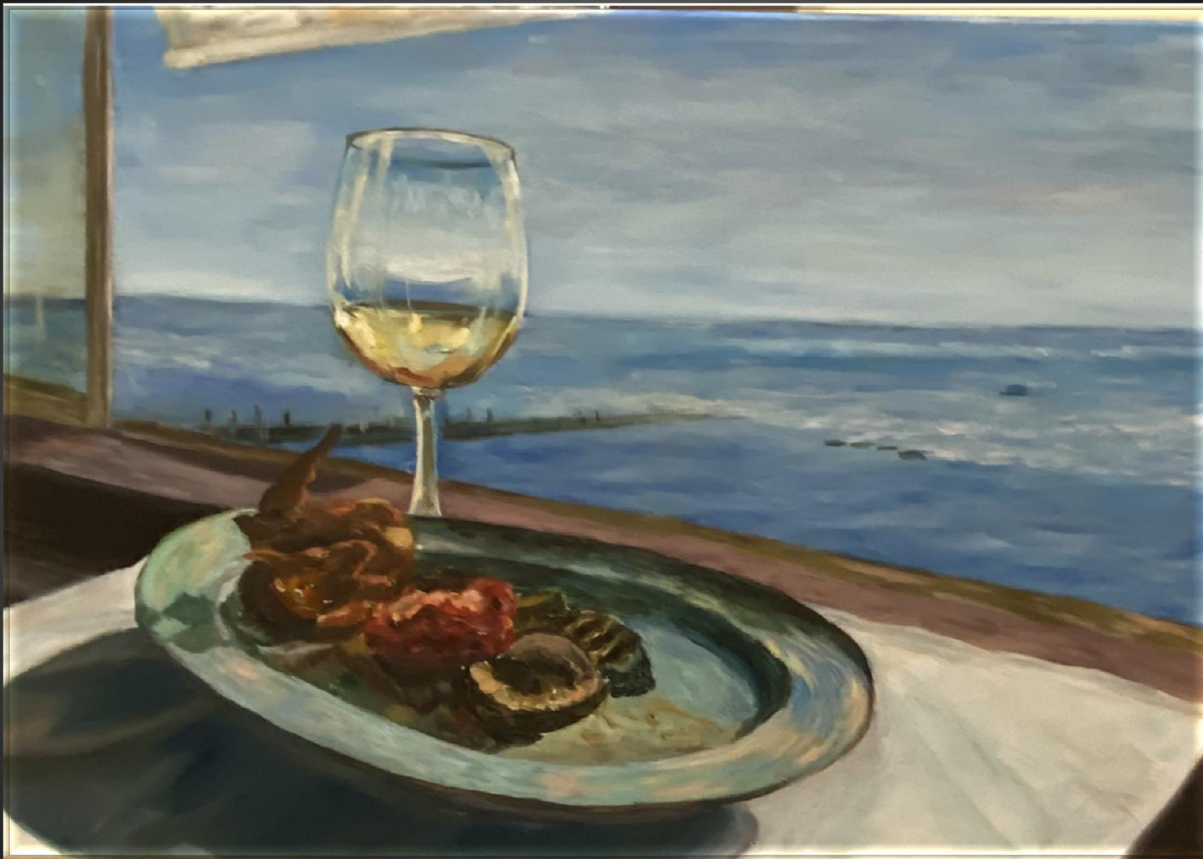
Евгения Цыганенко. Воспоминания о празднике 9 марта 2020 года. 2021 г. Х., м., 35x50 см