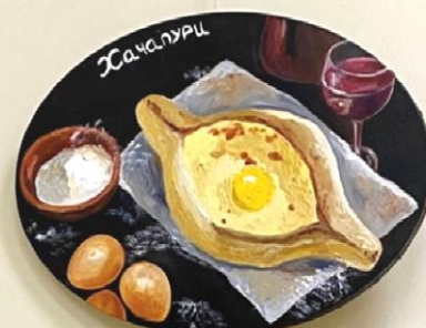
Анастасия Харитоновна Хачапури . Из серии «Грузинская кухня» 2021 Холст, масло