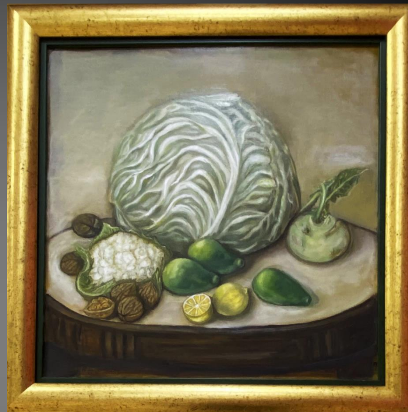
Елена Шкитова Натюрморт с капустой, лимоном и авокадо. 2019 г. Х., м., 50х50 см