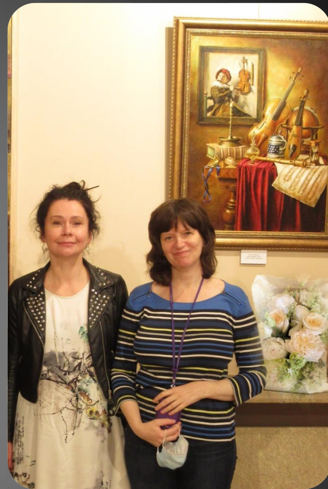
Юлия Якобсон Связь времен. 2020 г. Х., м., 80х60 см