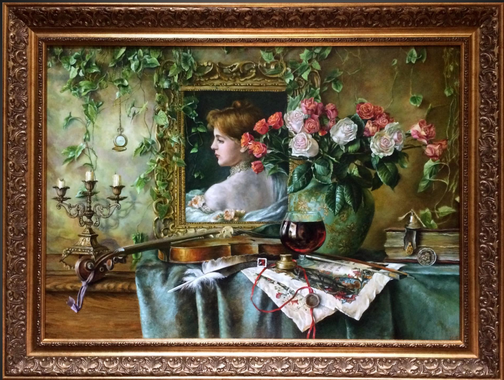
Юлия Якобсон. Ностальгия . 2020 г. Х., м., 50x70 см