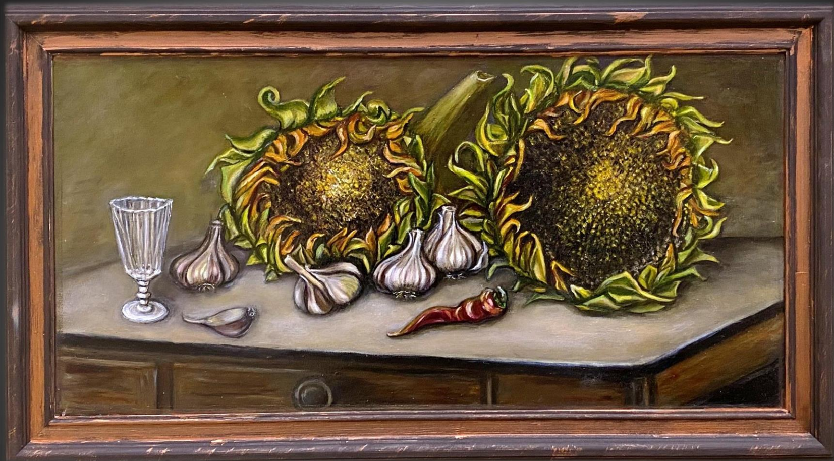
Елена Шкитова. Подсолнухи . 2021 г. Х., м., 30х60 см