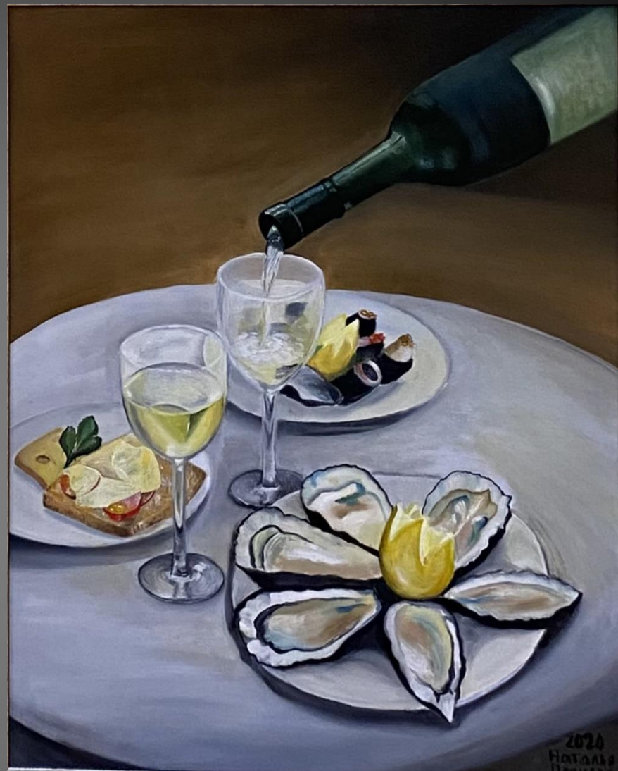
Наталья Попцова. Устрицы и вино. 2020 г. Х., м., 50x40 см.