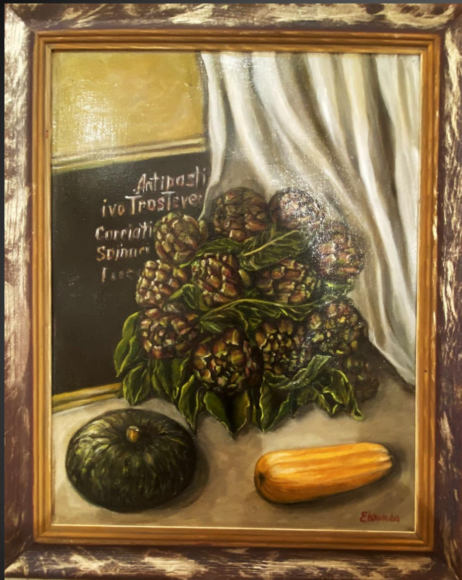
Елена Шкитова Артишоки. 2021 г. Х., м., 60х40 см