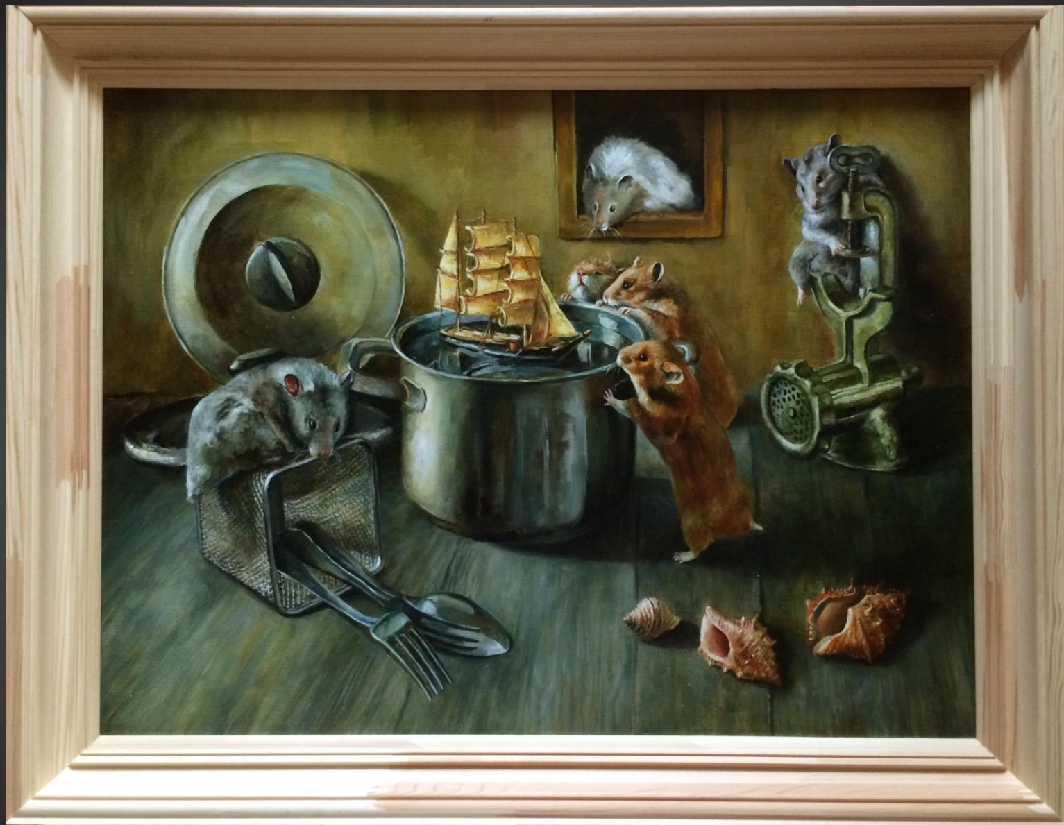
Юлия Якобсон. Попутного ветра . 2019 г. Из серии «Хомячки». Х., м., 45х60 см