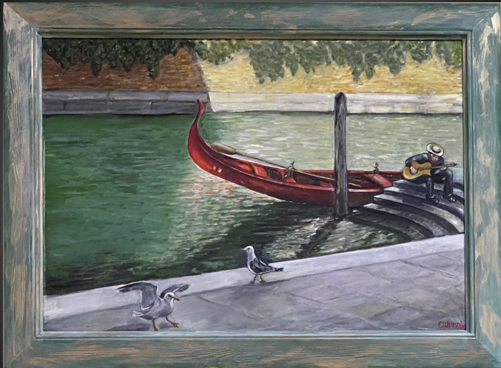
Елена Шкитова. Музыка Венеции . 2021 г. Х., м., 50x70 см