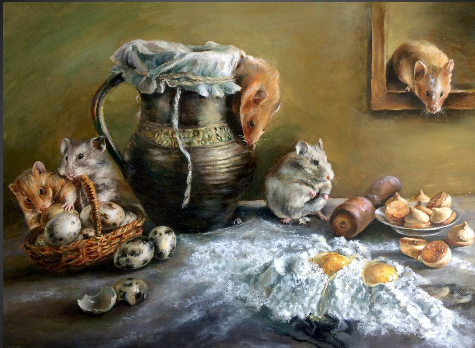
Юлия Якобсон. Свежая выпечка . 2019 г. Из серии «Хомячки». Х., м., 45х60 см