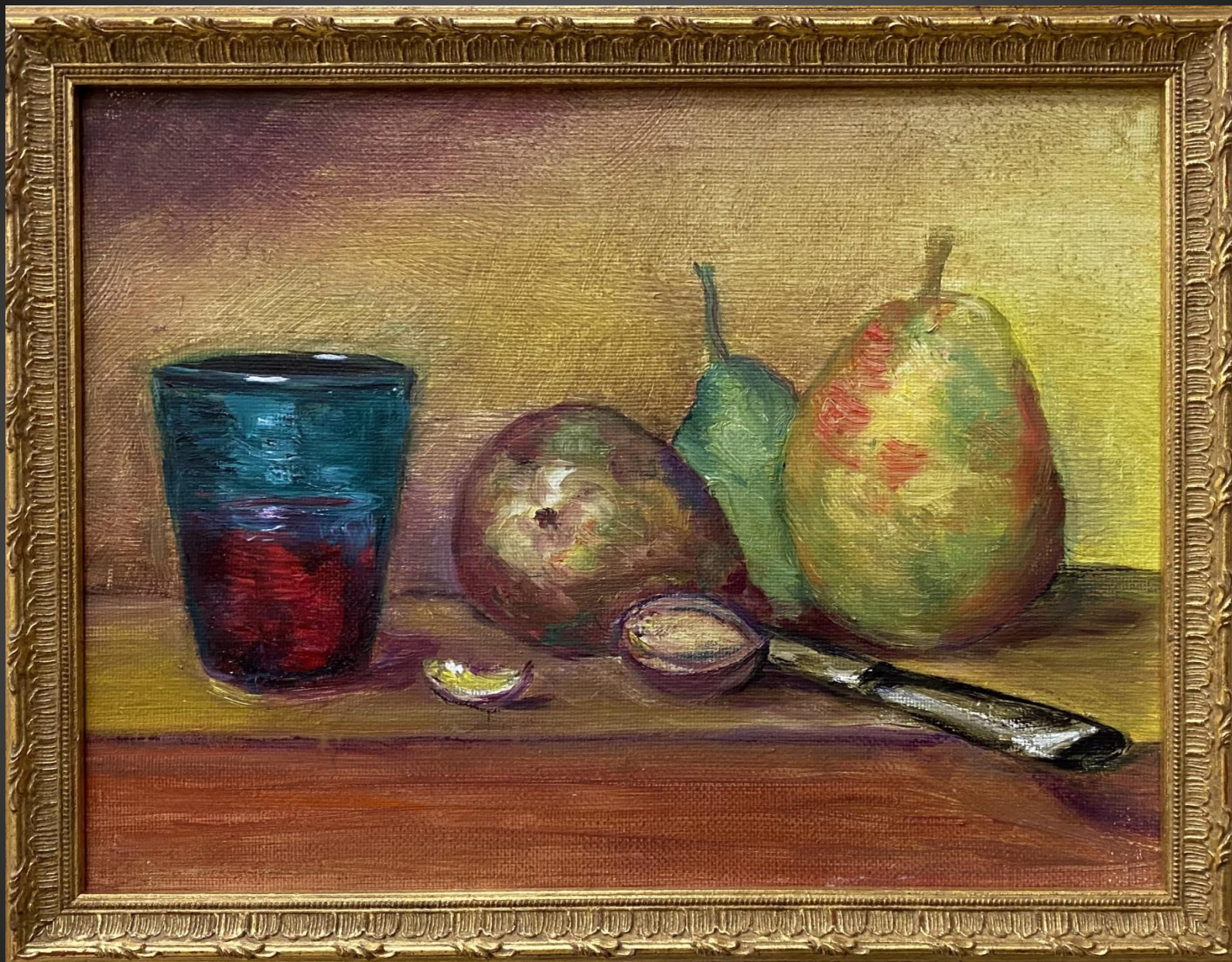
Татяна Тарасова. Шарден . 2021 г. Х., м., 30х40 см