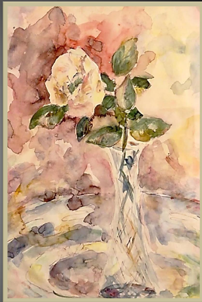
Лев Ягужинский. Роза в хрустале . 2010 г.