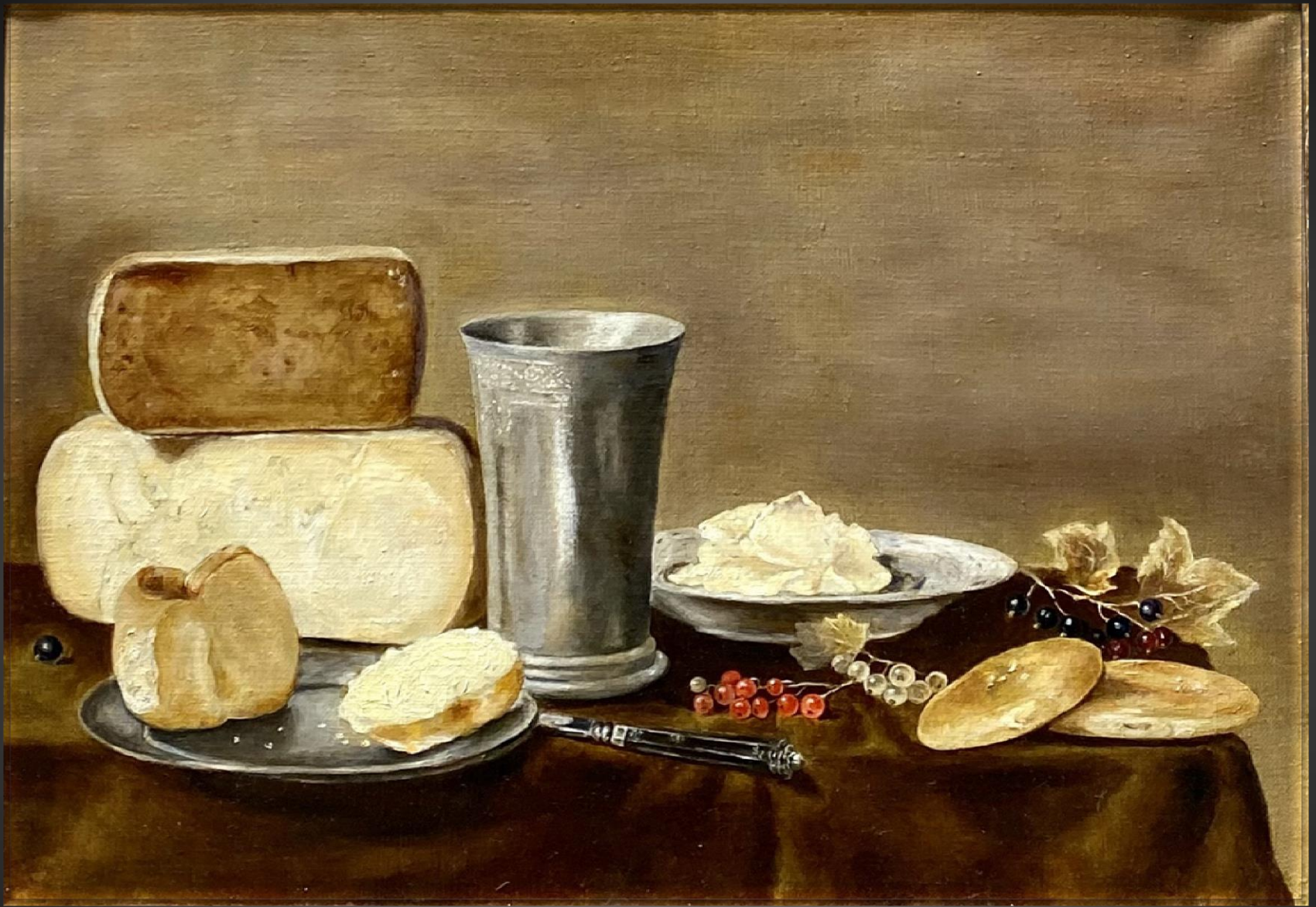
Ирина Сорокина. Натюрморт . 2019 г. Х., м., 35x50 см Творческая копия одноименной картины Флориса Герритса ван Схотена (ок. 1585)