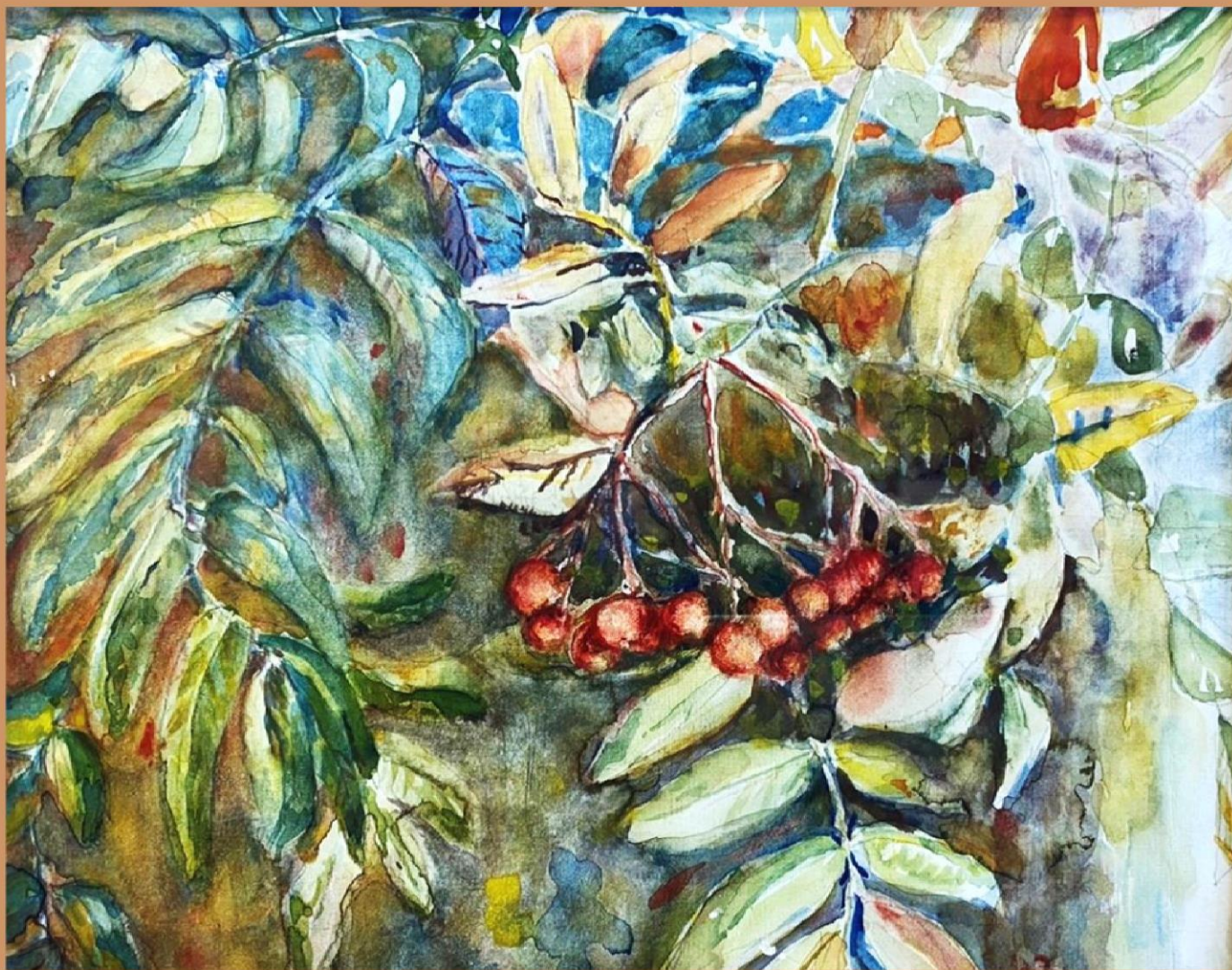
Лев Ягужинский. Ветка рябины . 2010 г. Бумага, гуашь, 24x30 см