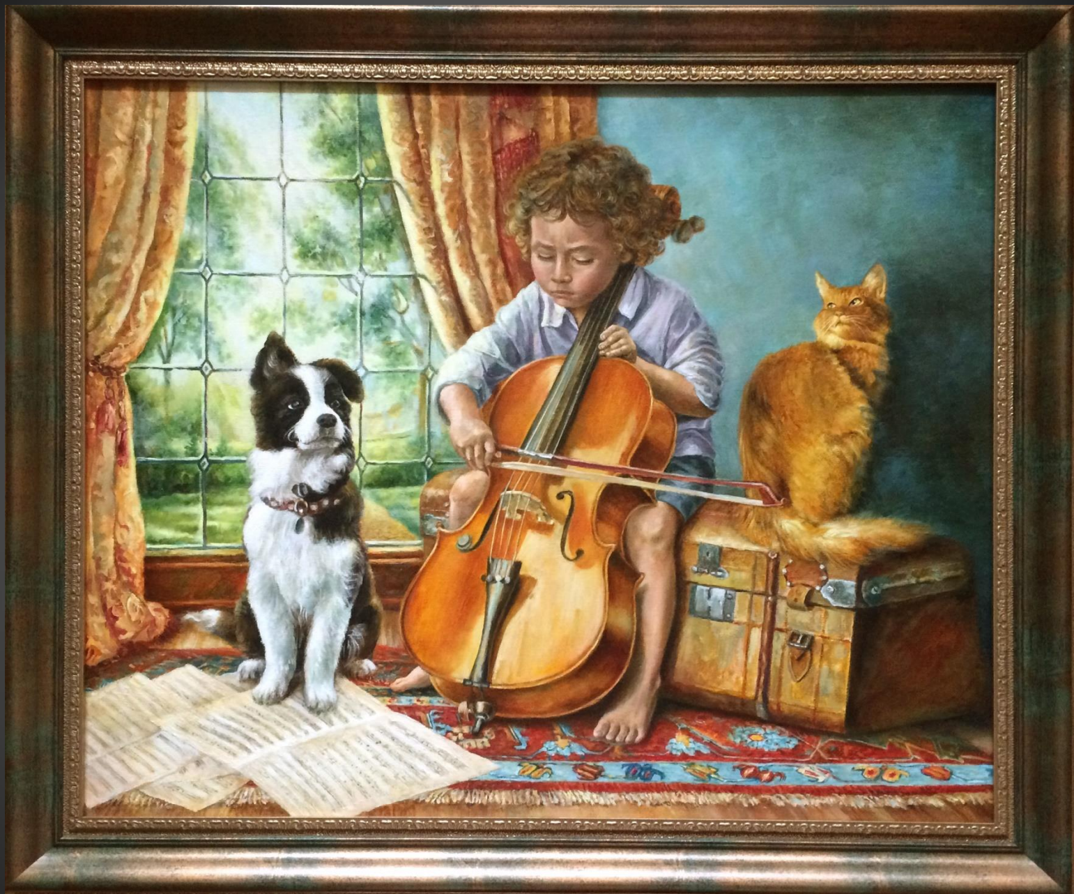
Юлия Якобсон. Маленький музыкант . 2021 г. Х., м., 50x60 см