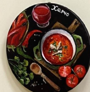
Анастасия Харитоновна Харчо . Из серии «Грузинская кухня» 2021 Темно Холст, масло