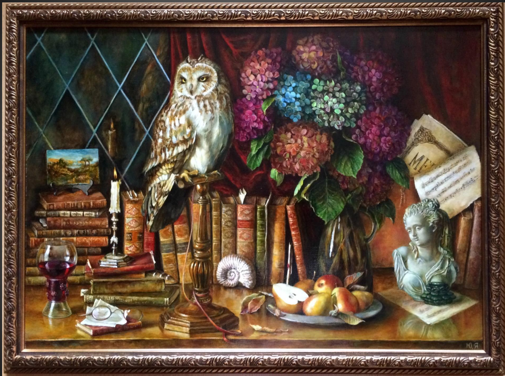
Юлия Яковсон. Трудный выбор . 2021 г. Х., м., 50x70 см