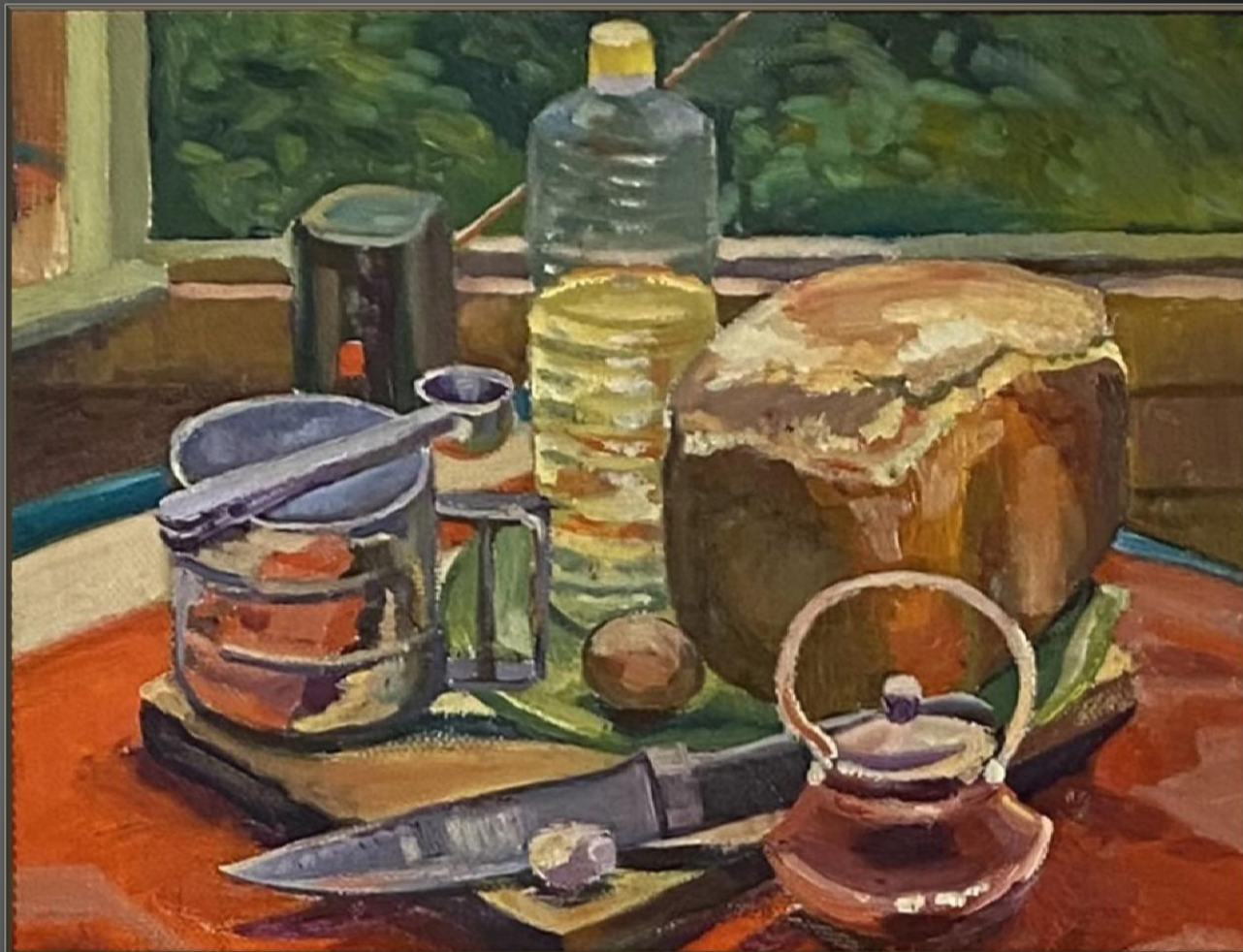
Олег Рындин Хлебушек. 2021 г. Х., м., 30x40 см