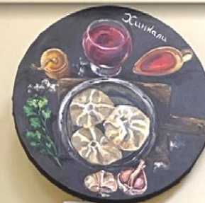
Анастасия Харитоновна Хачапури . Из серии «Грузинская кухня» 2021 Темно Холст, масло