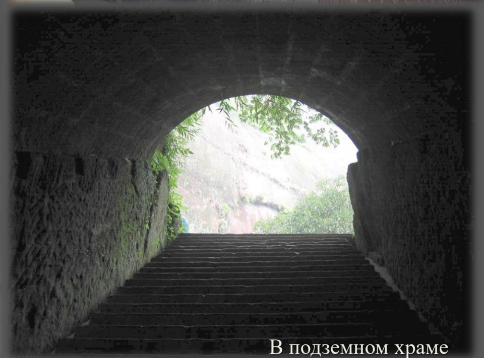
В подземном храме