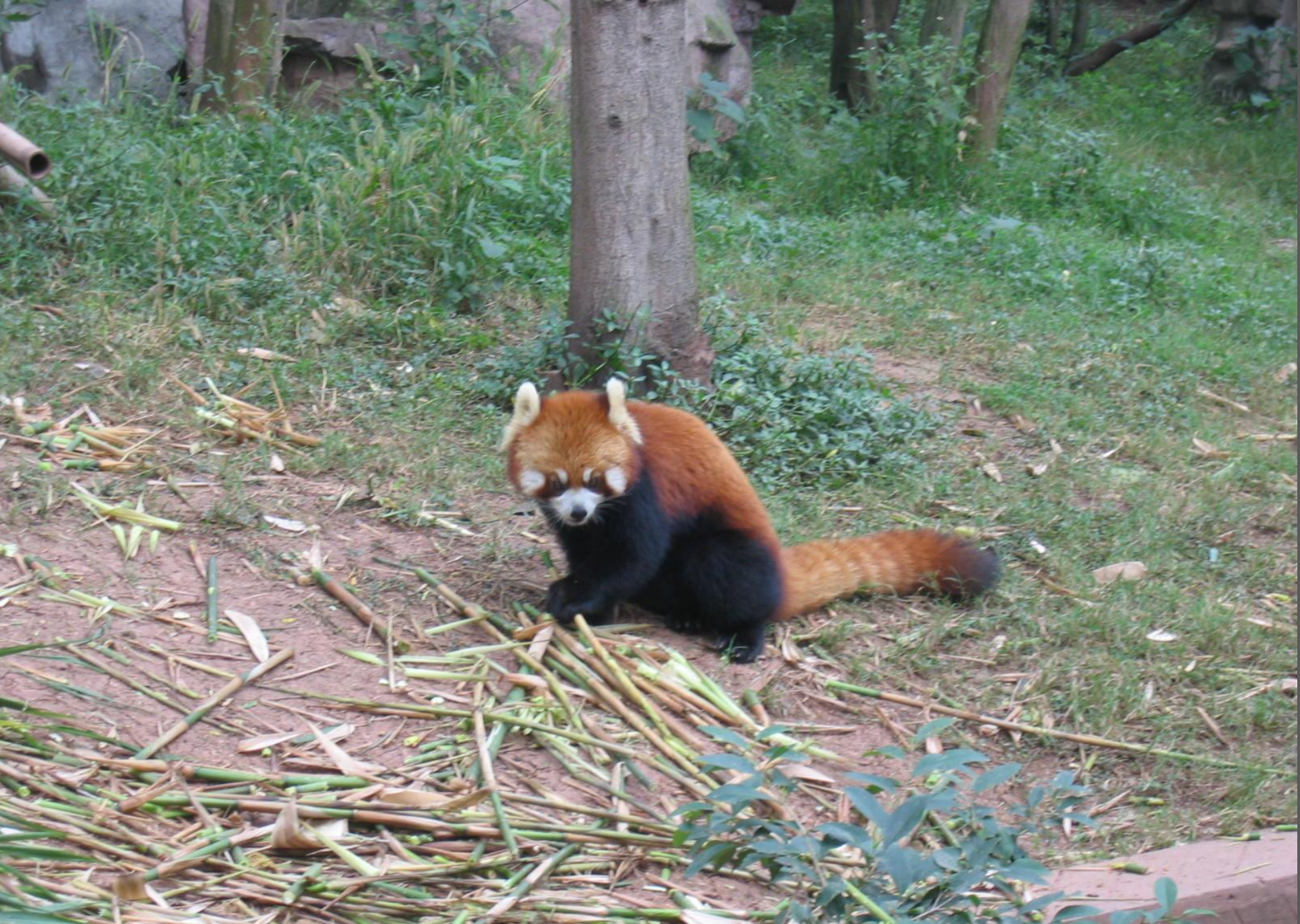
А это более мелкая, красная панда