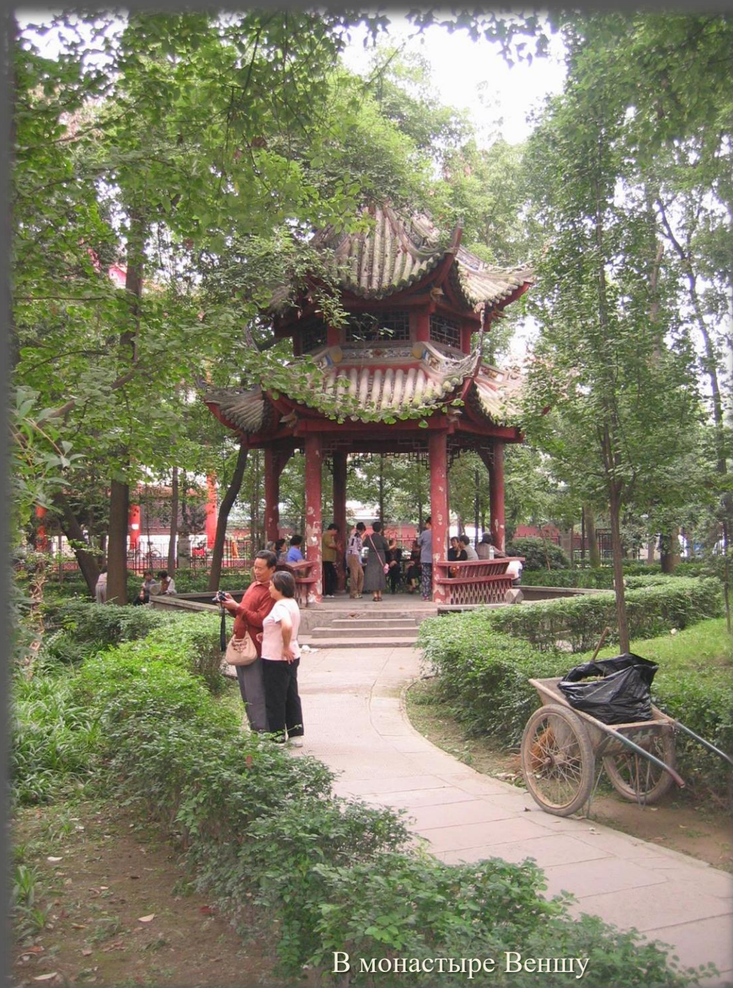
В монастыре Веншу