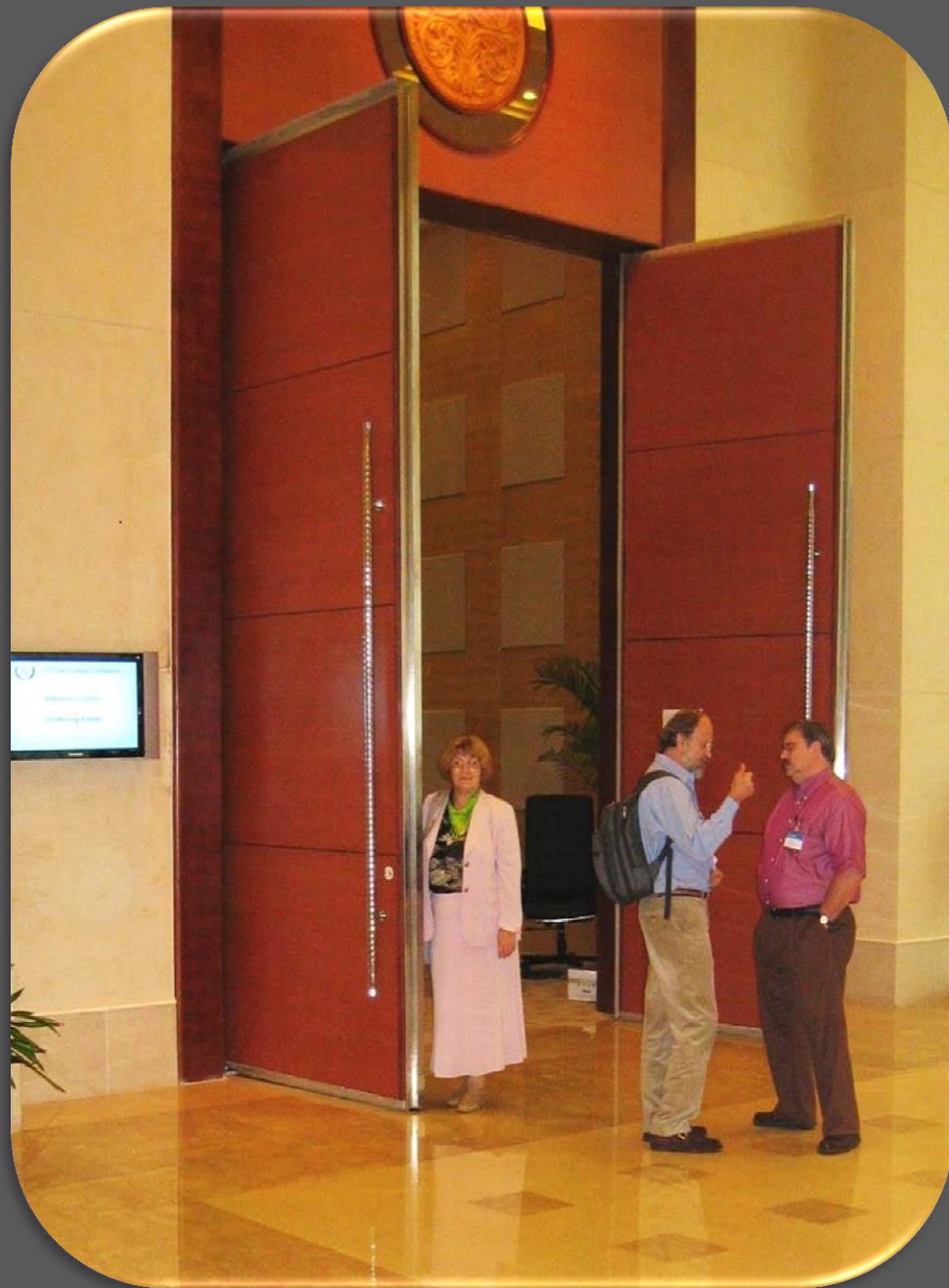
Вход в зал заседаний