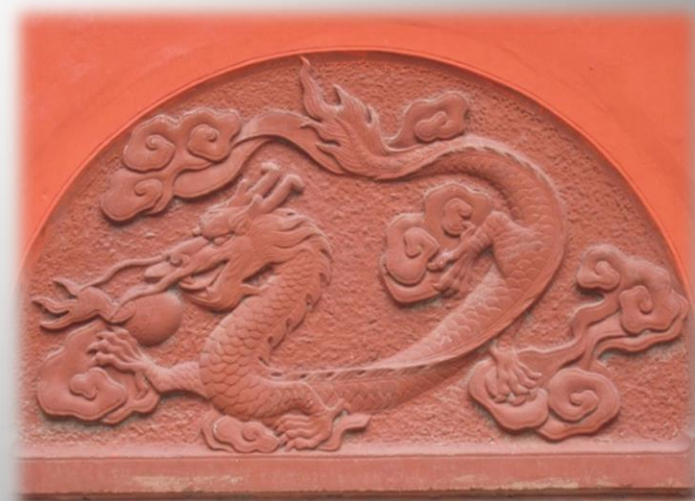
В монастыре Веншу