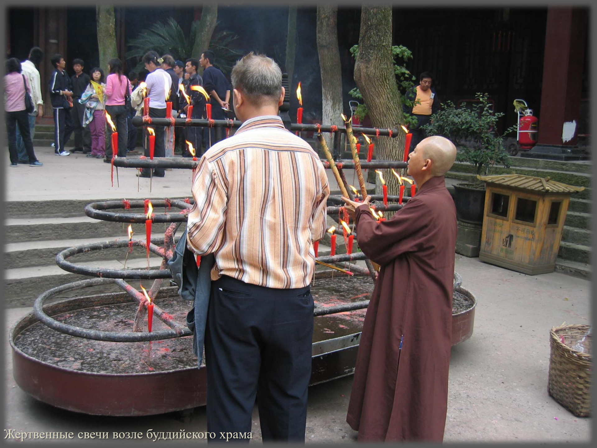
Жертвенные свечи возле буддийского храма