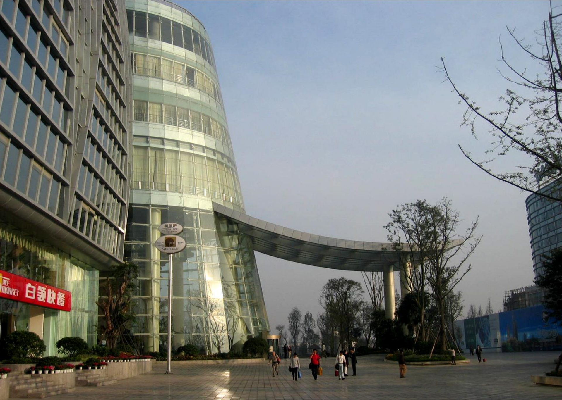
Международный Центр, в котором проходила наша конференция, примыкал к отелю Холидей Инн