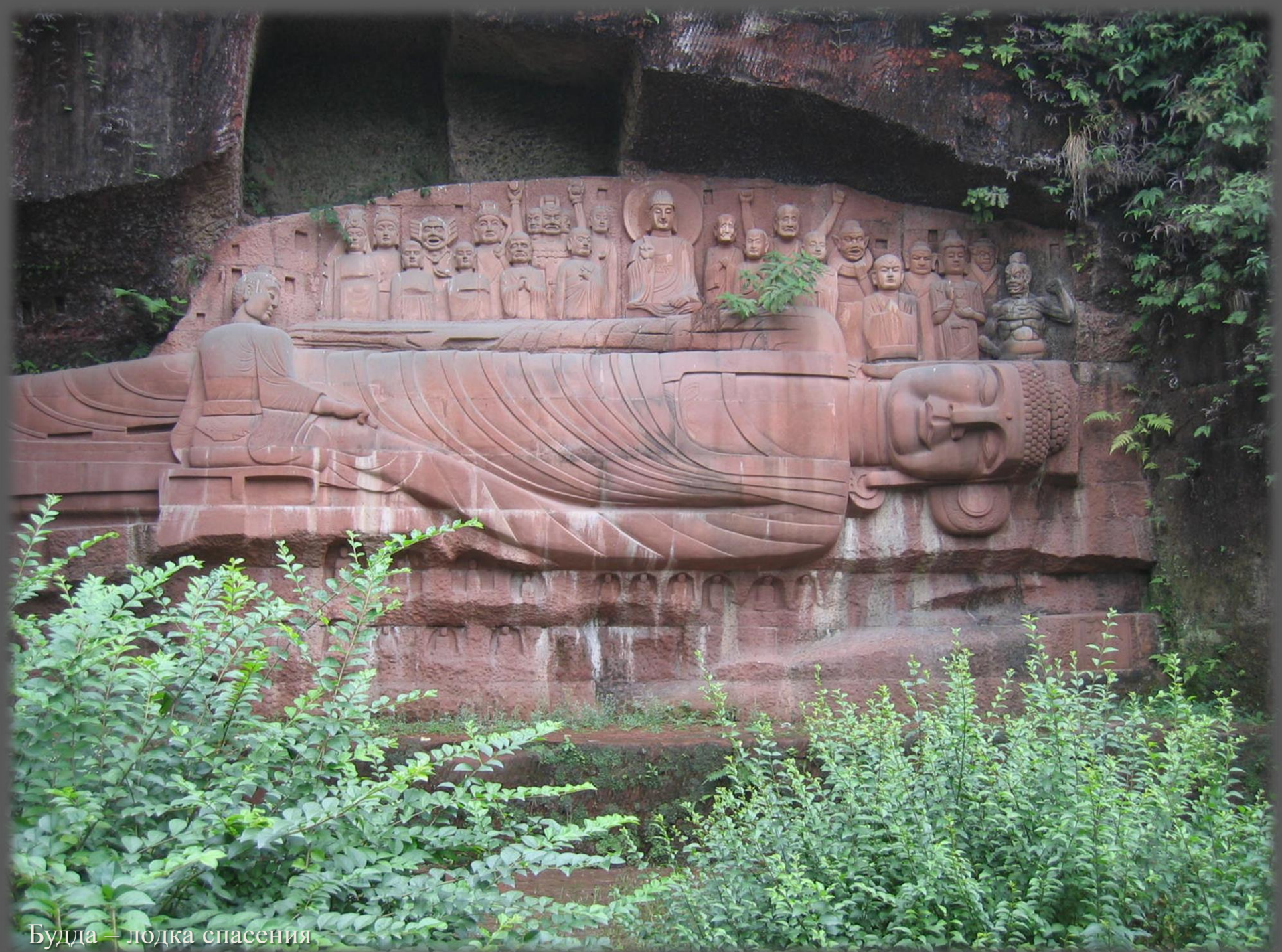
Будда — лодка спасения