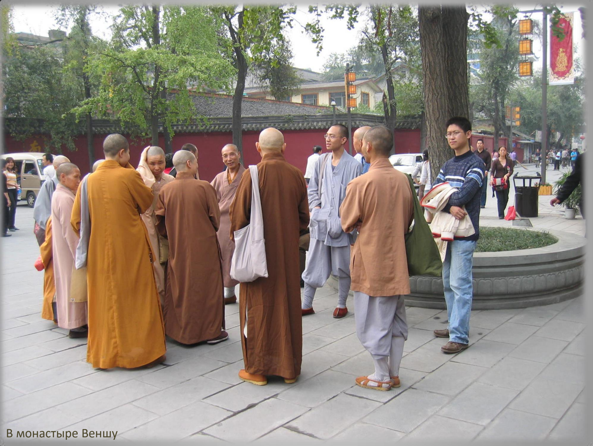
В монастыре Веншу