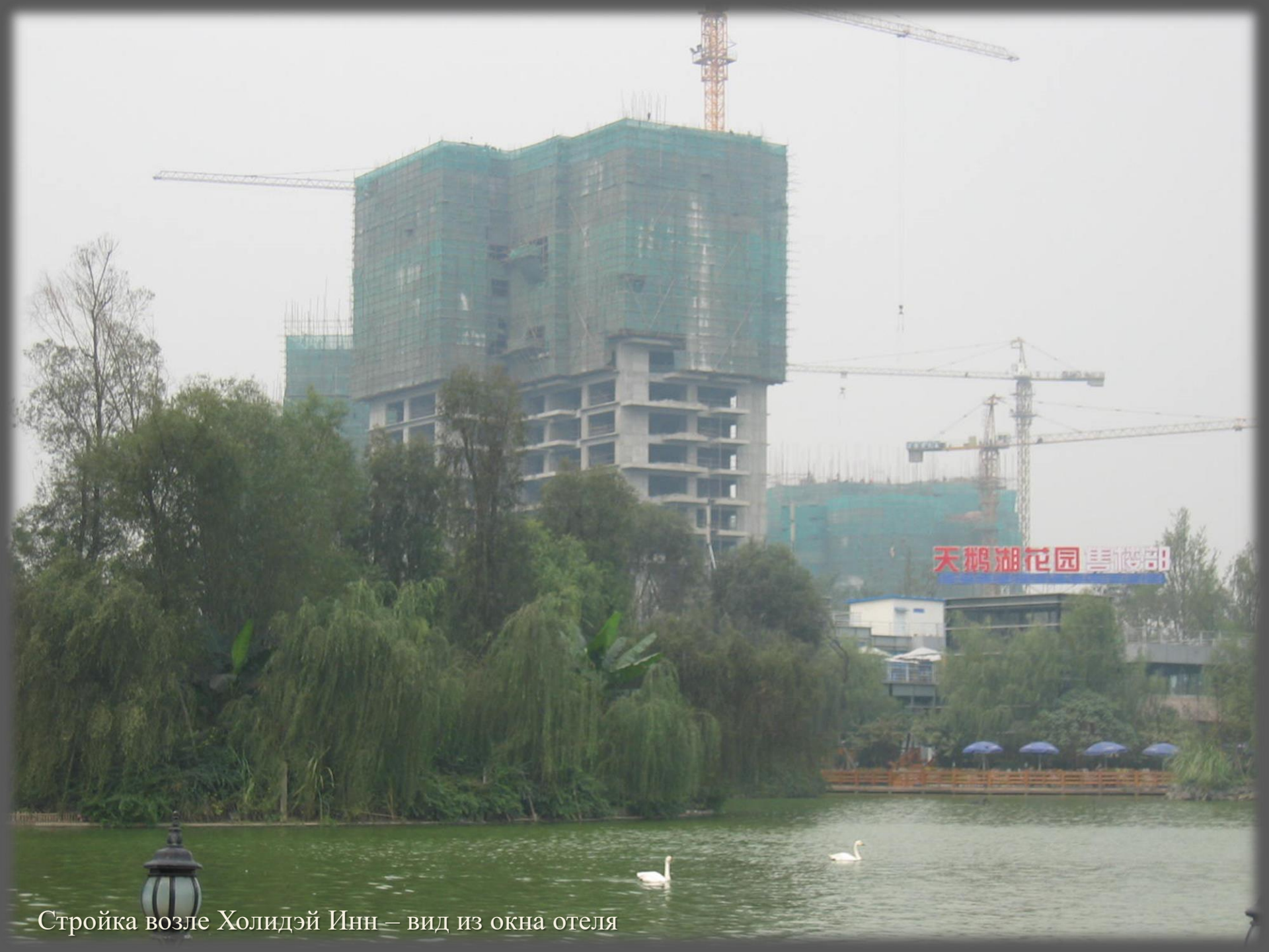
Стройка возле Холидэй Инн — вид из окна отеля