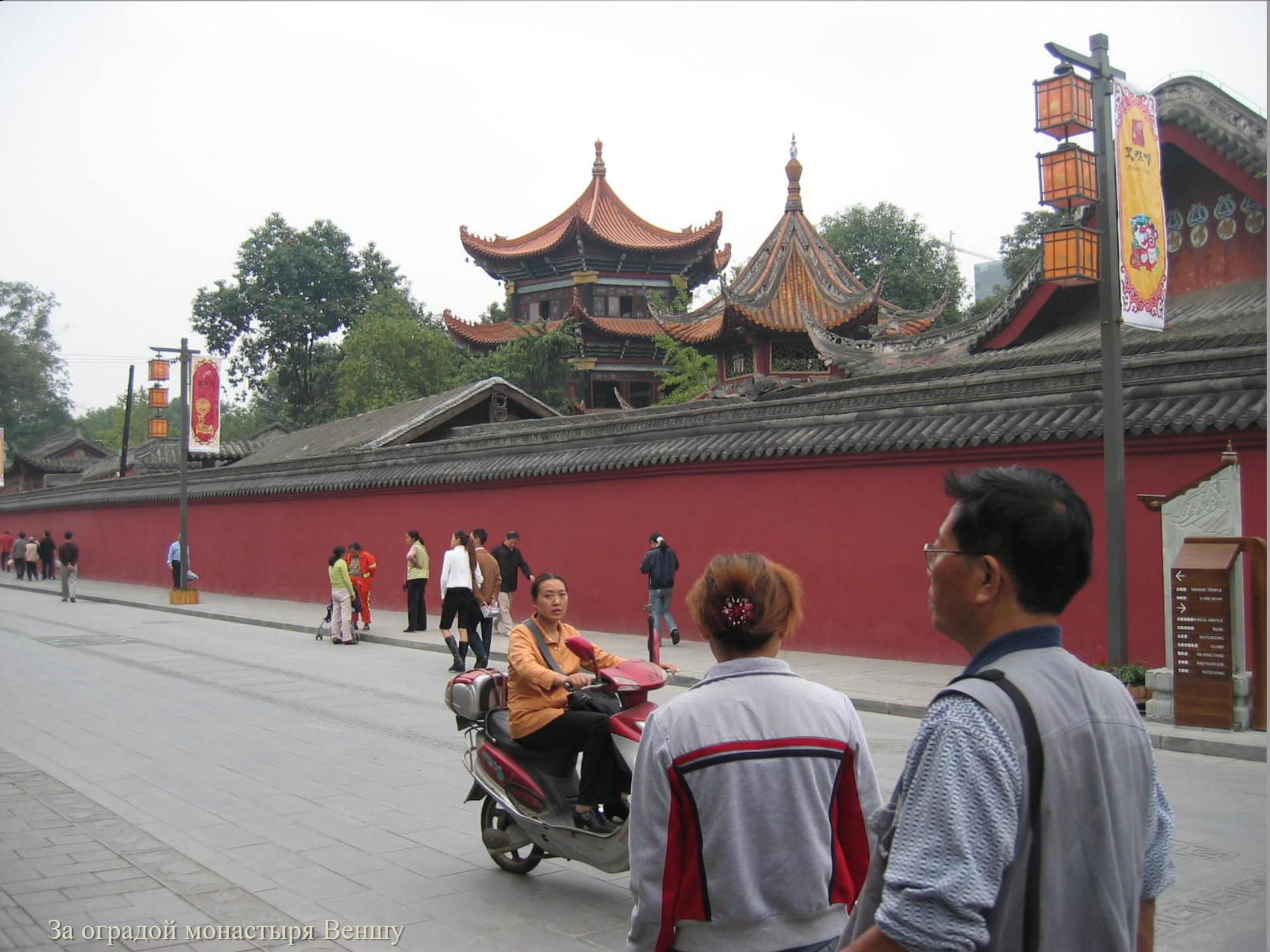
За оградой монастыря Веншу