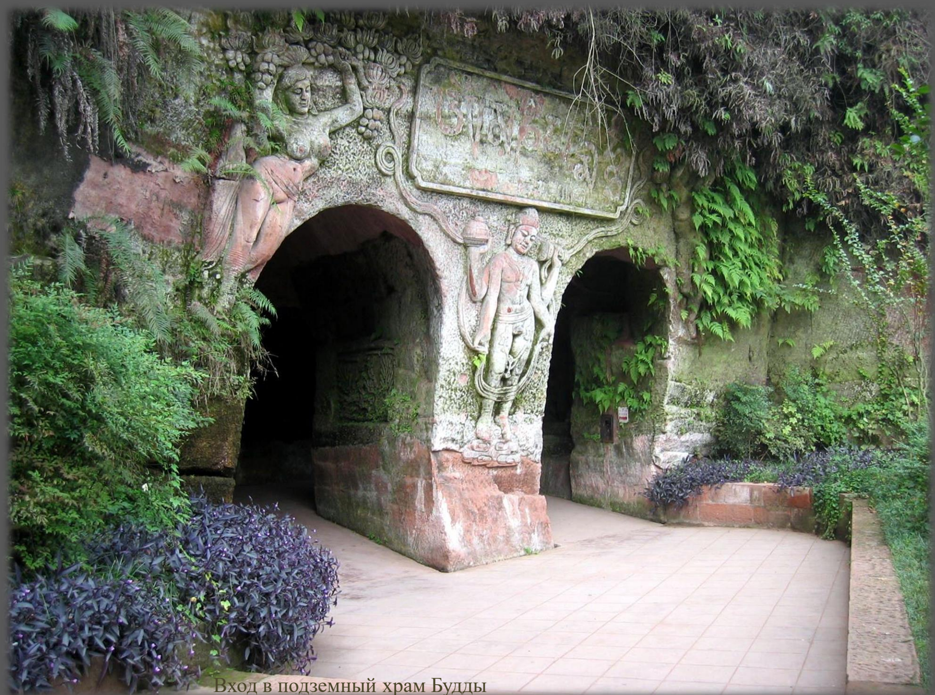
Вход в подземный храм Будды