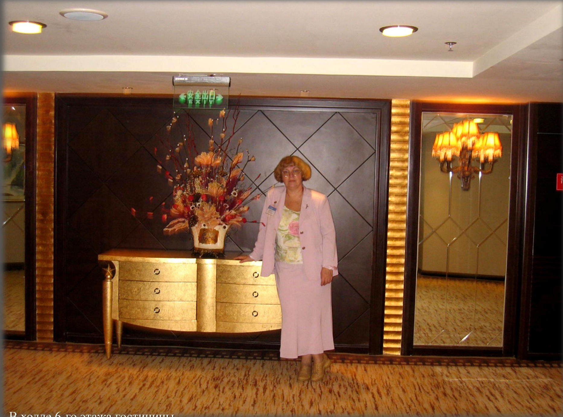
В холле 6-го этажа гостиницы