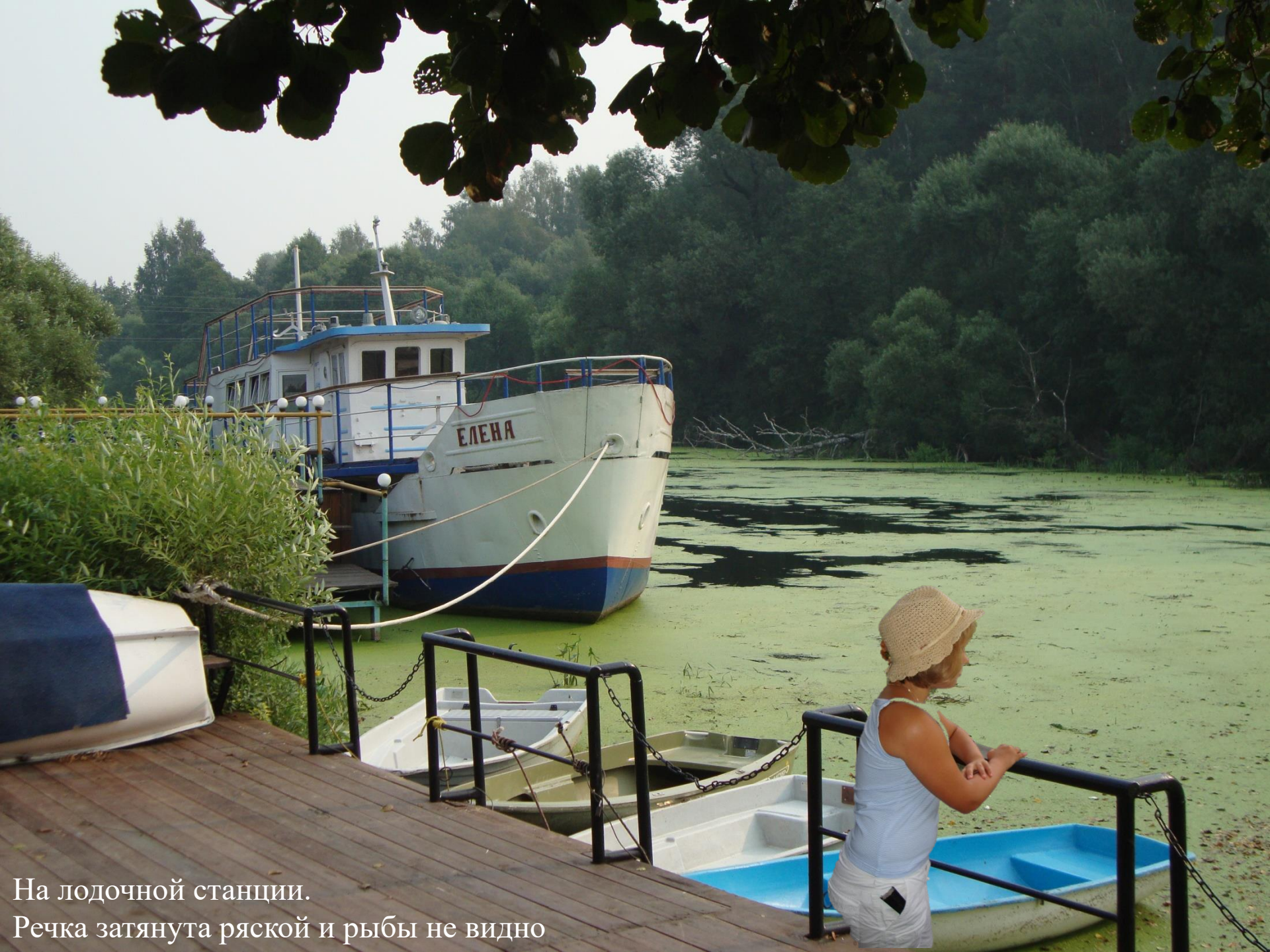
На лодочной станции. Речка затаюта ряской и рыбы не видно