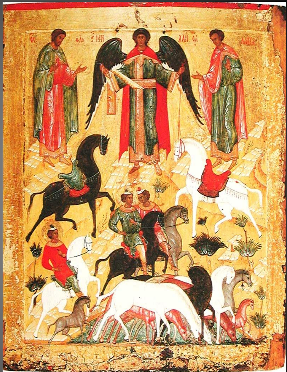
Святые мученики Флор и Лавр (Новгородская икона 15 в.)

Господь мой! Дай мне Твои глаза, чтобы видеть образ Божий в моих детях. Дай мне Твое сердце, чтобы любить их безусловно. Дай мне Твою нежность, чтобы растить их как цветы. Дай мне Твою мудрость, чтобы направлять их жизненный путь. Дай мне Твою силу, чтобы, когда придет время, предоставить им свободу выбора. Аминь!