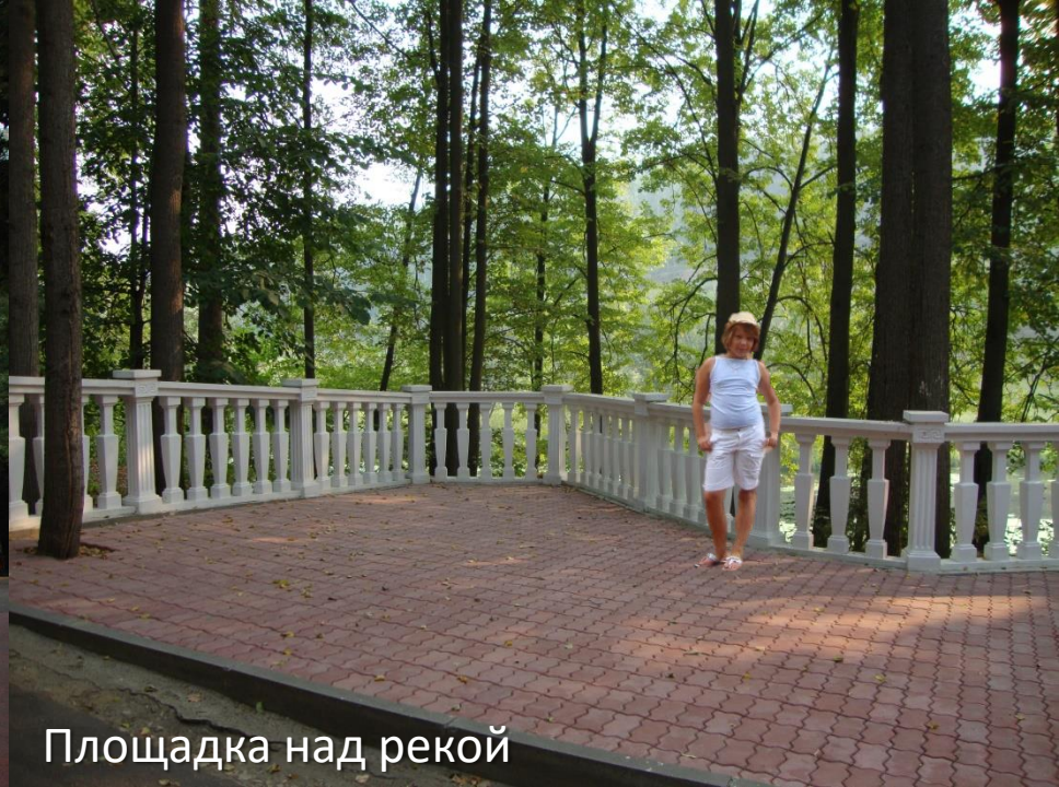
Площадка над рекой