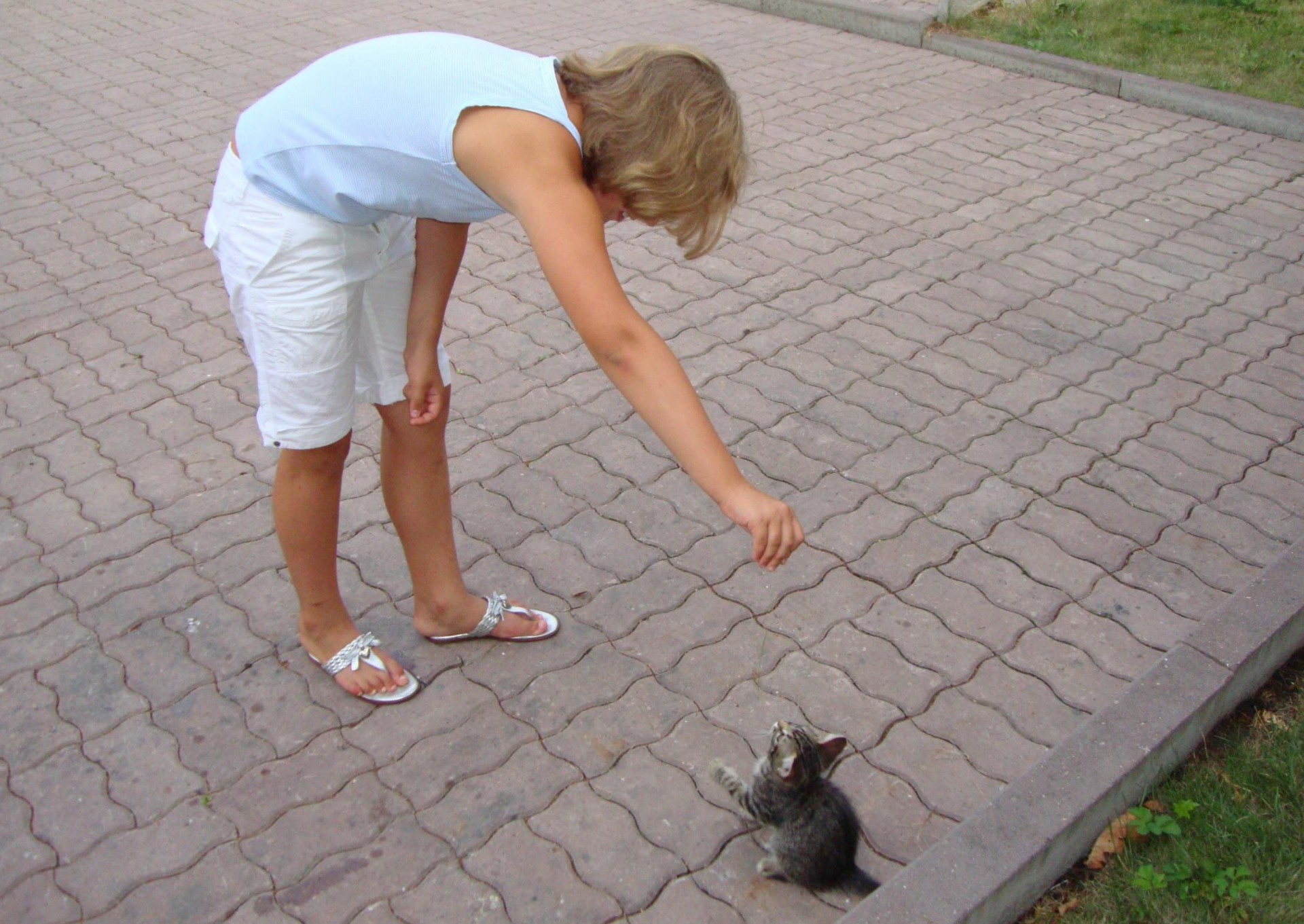
Я поиграла с одним из котят, даже погладила его по головке.