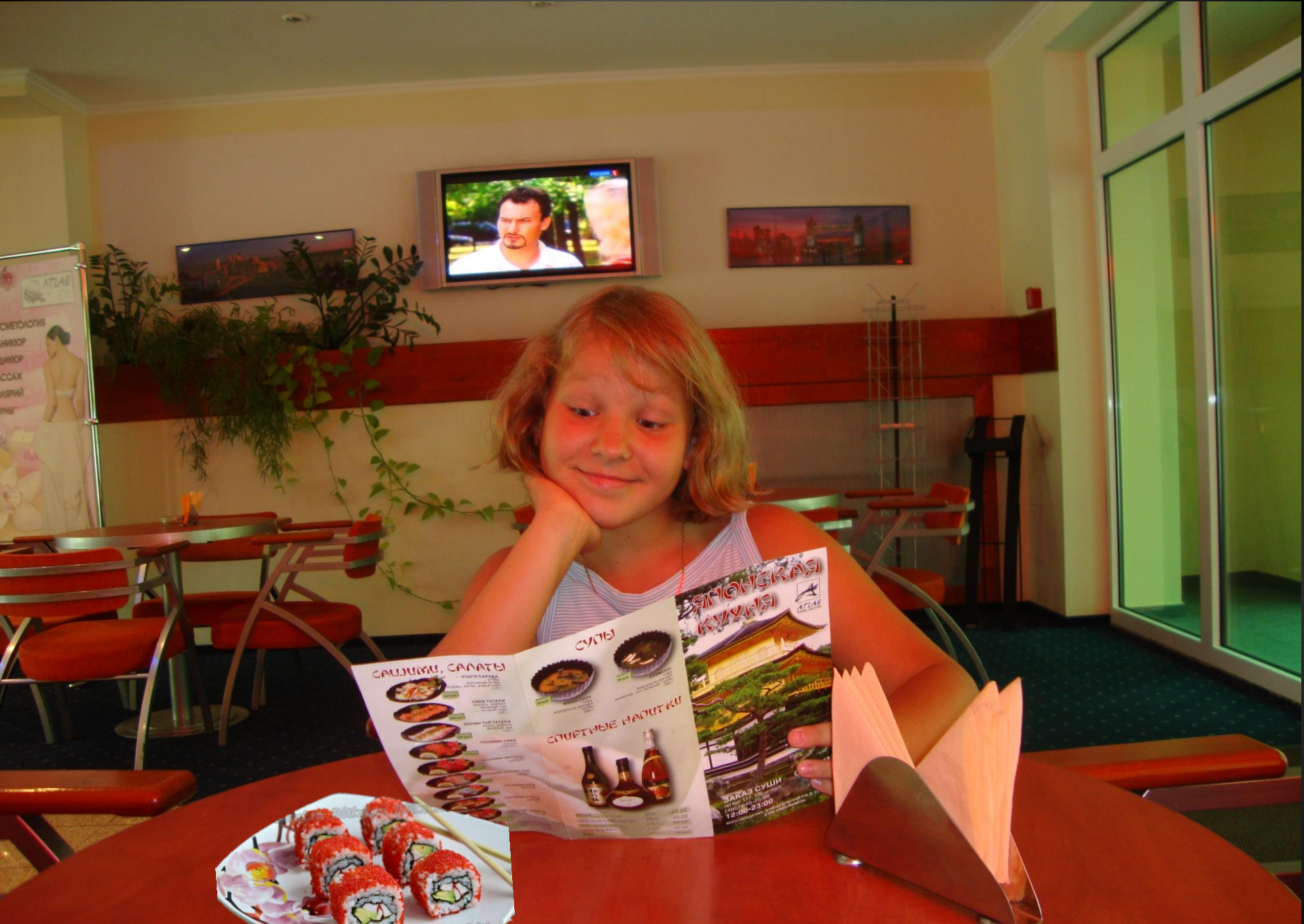
В Суши-баре мы с удовольствием попили зеленого чая, заедая его роллами Калифорния.