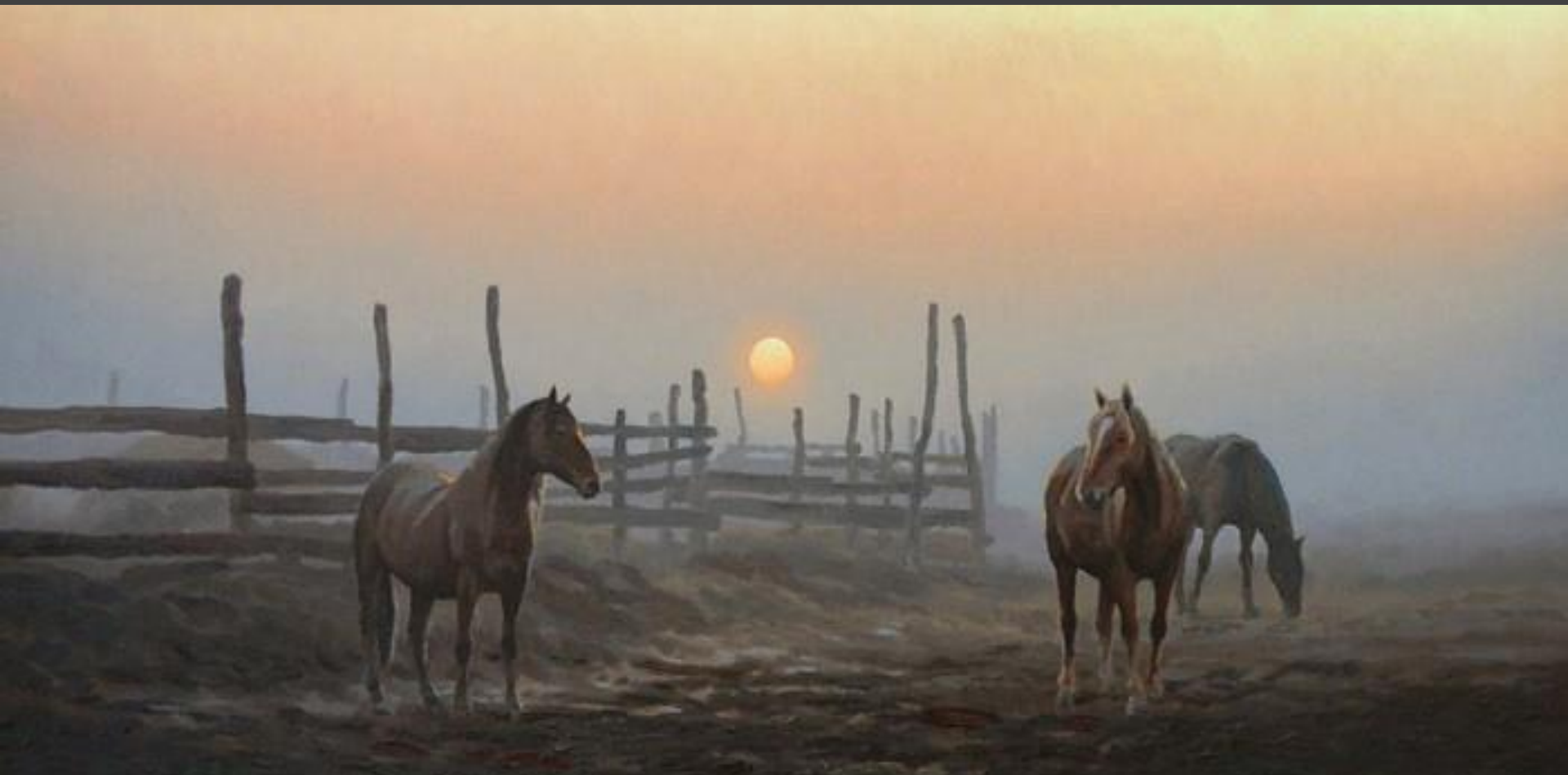
Закат (деталь картины). Художник Алексей Адамов

Твоим точёным силуэтом Любуюсь в отблесках заката. Ты прилетишь ко мне с рассветом, Судьбой подаренный когда-то. Крутой изгиб атласной шеи, Шальной огонь в глазах лиловых. В округе нет тебя резвее, Скакун горячий, мой бедовый.